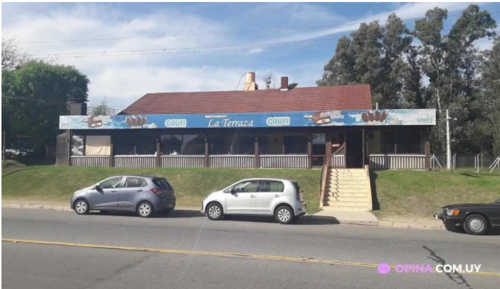
La terraza todas