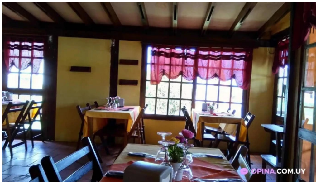
La terraza ambiente