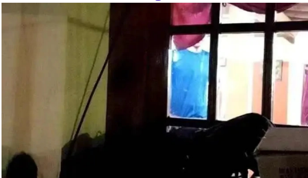
La terraza videos