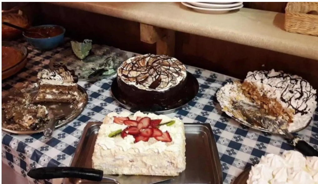
La terraza comida y bebida