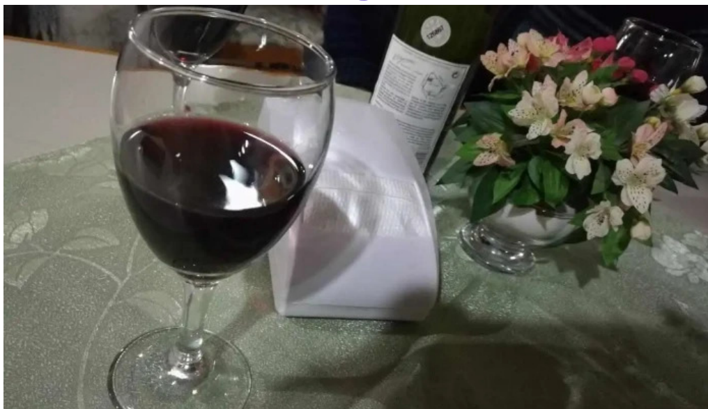
Don juan vino