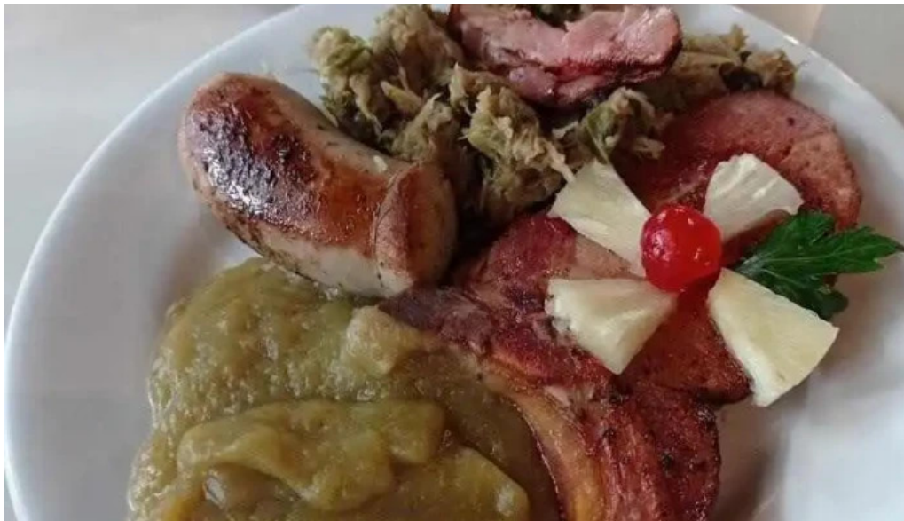
Don juan comida y bebida