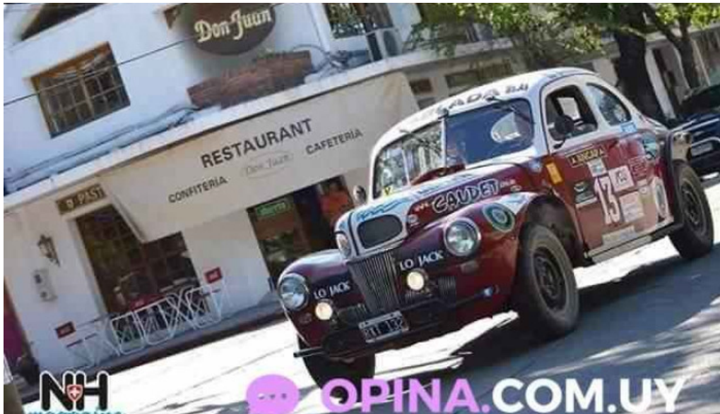
Don juan del propietario