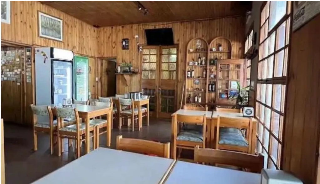
Don juan todas