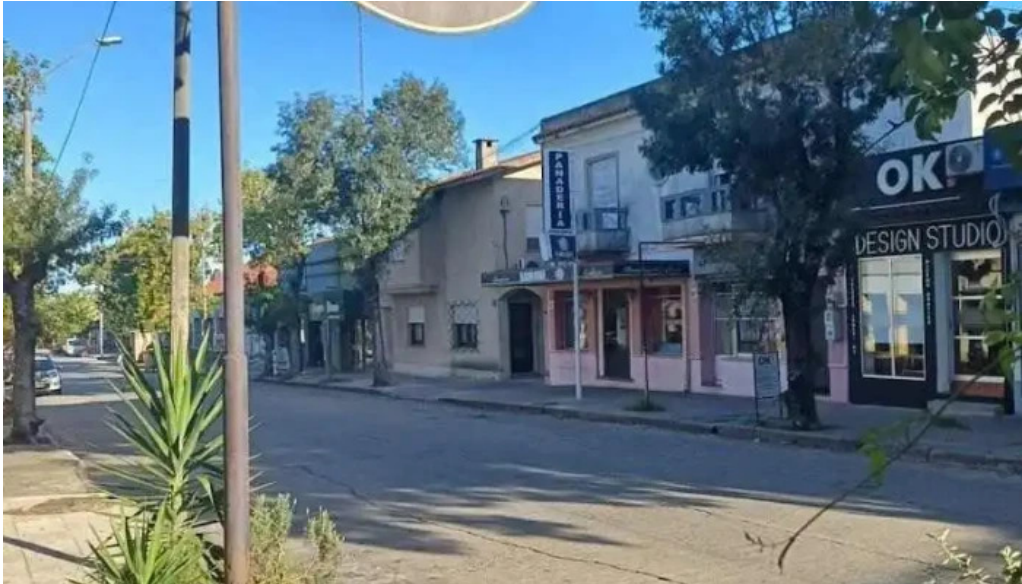
Don juan mas recientes