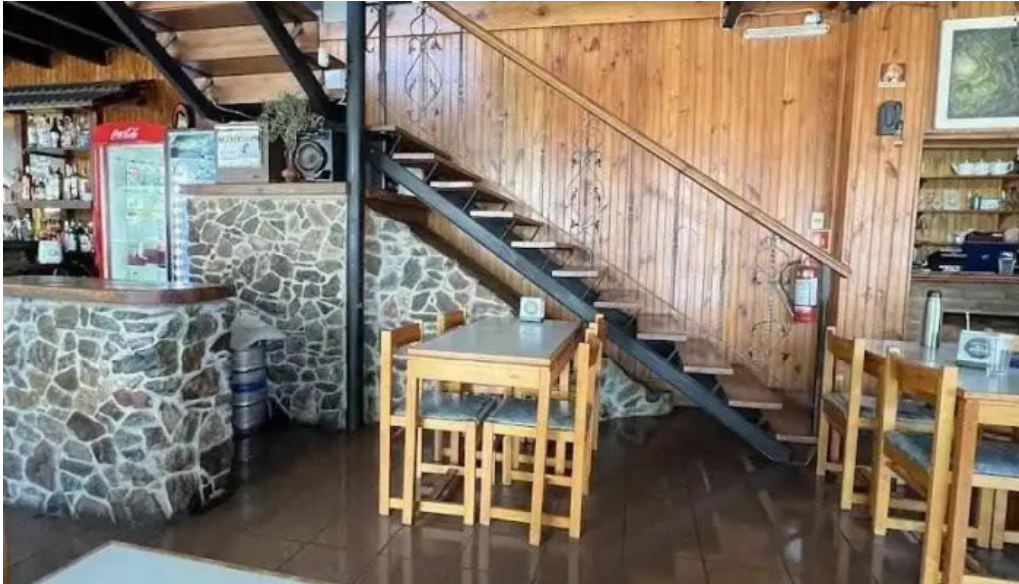
Don juan ambiente