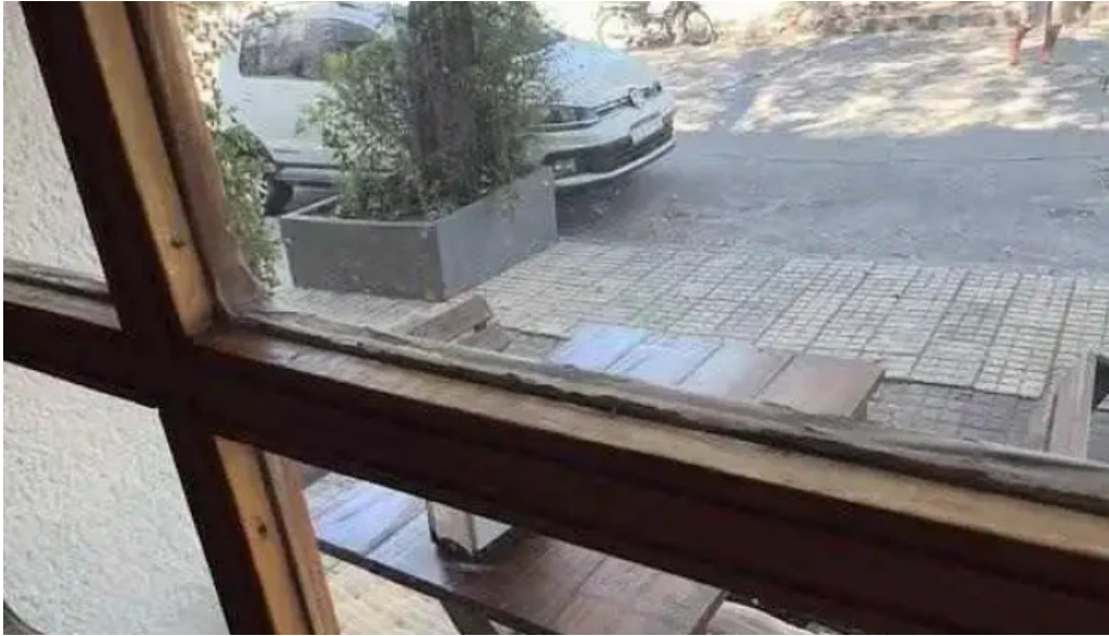
Don juan videos