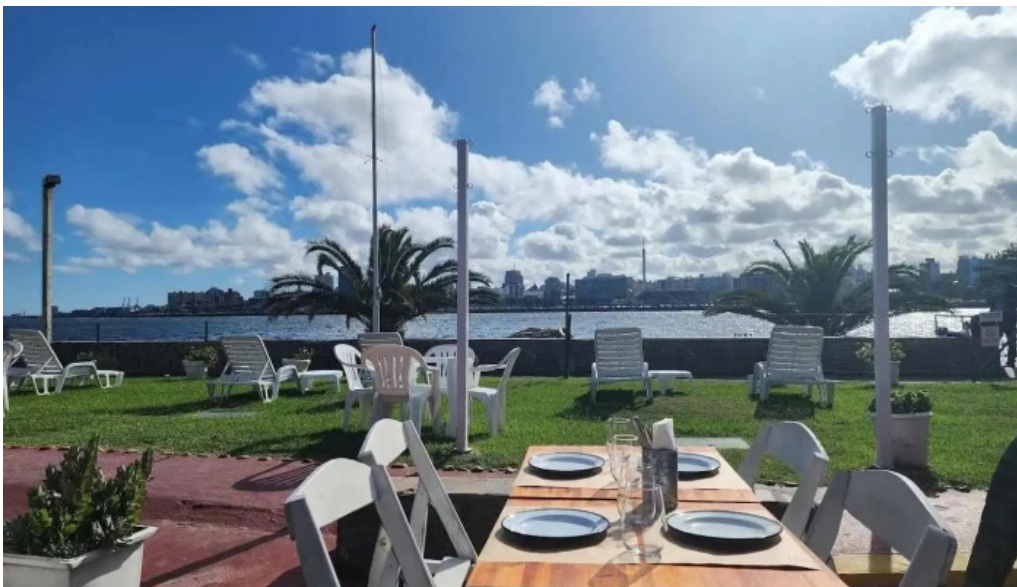
Noa noa todas