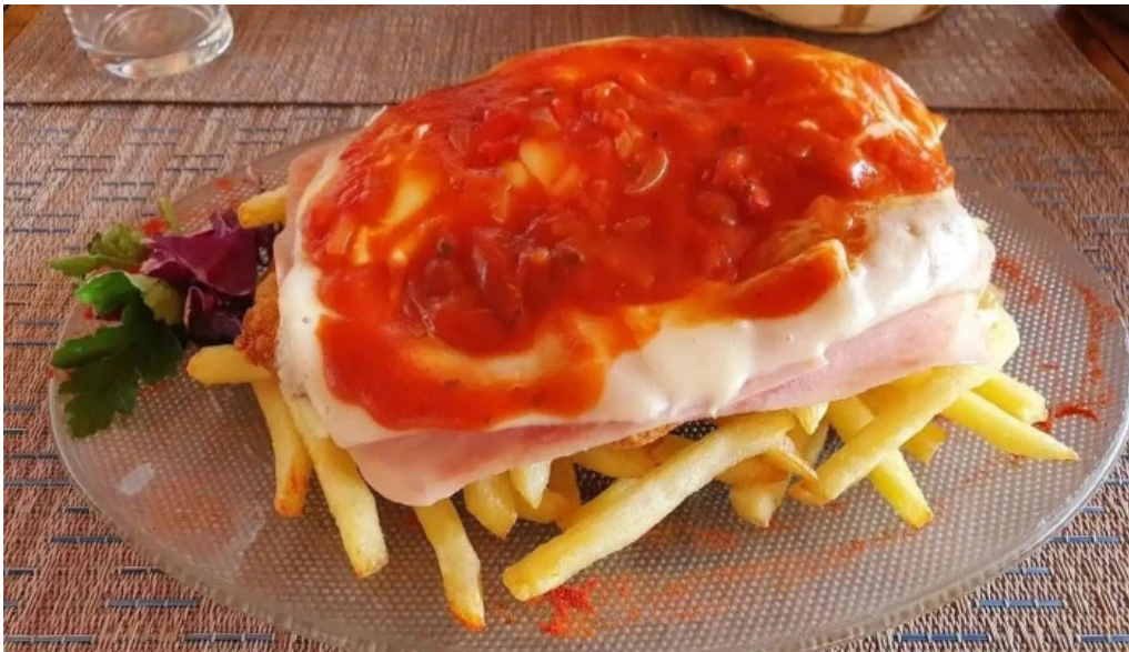
Noa noa comida y bebida