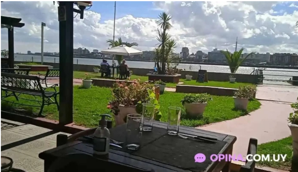
Noa noa videos