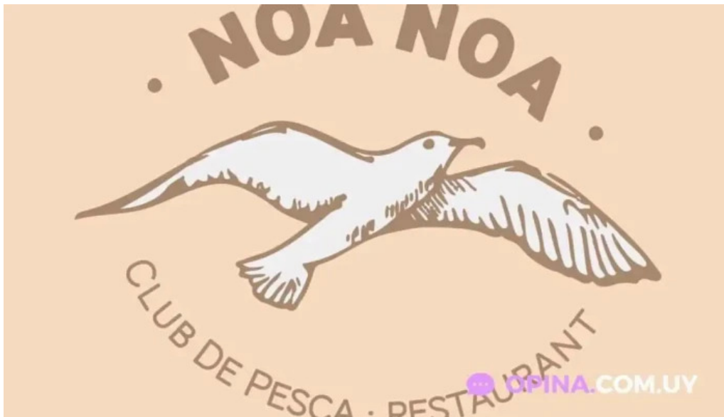
Noa noa del propietario