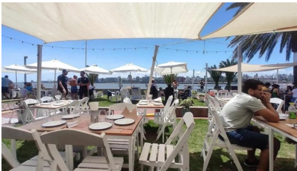
Noa noa ambiente