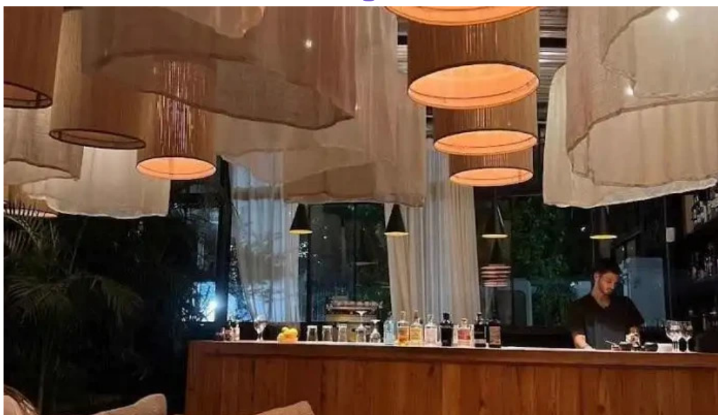
Niko cocina fusión montevideo