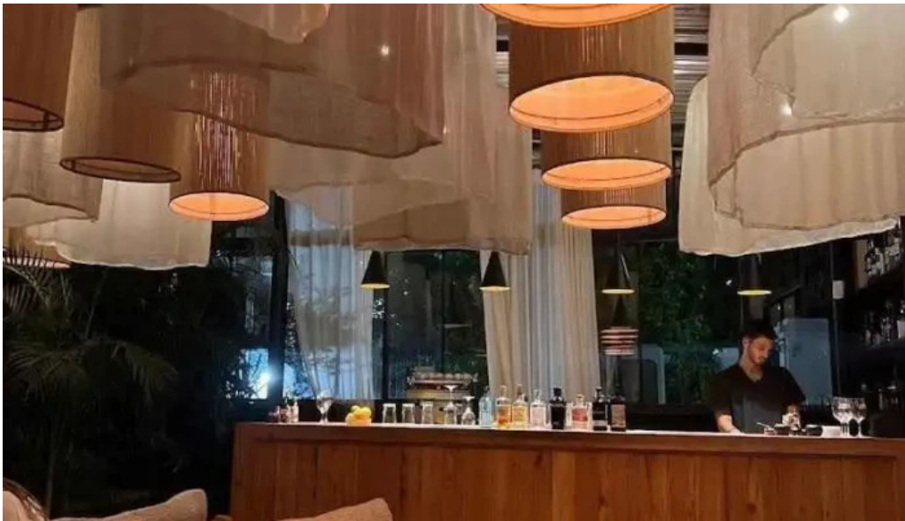
Niko cocina fusion todas