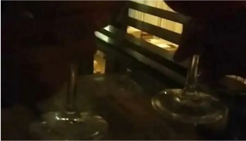
Niko cocina fusion videos