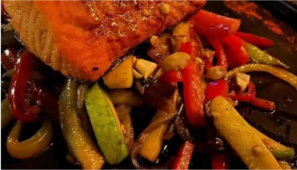
Niko cocina fusion mas recientes