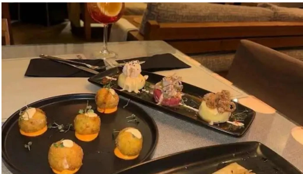
Niko cocina fusion comida y bebida