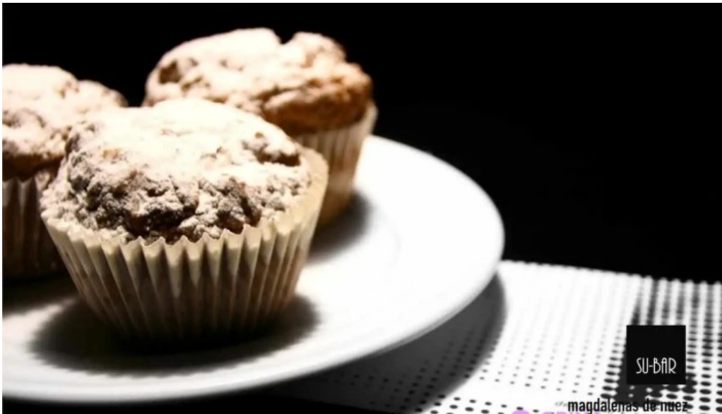
Su bar comida y bebida