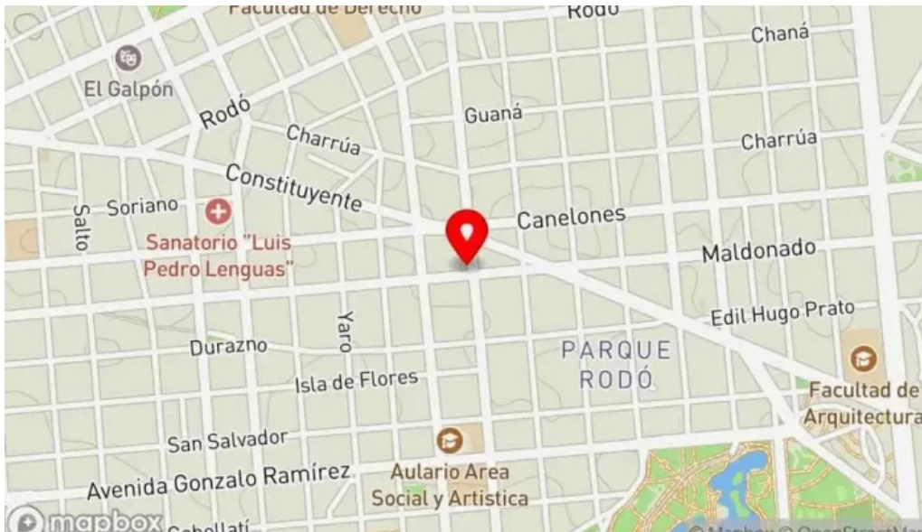
Su bar mapa