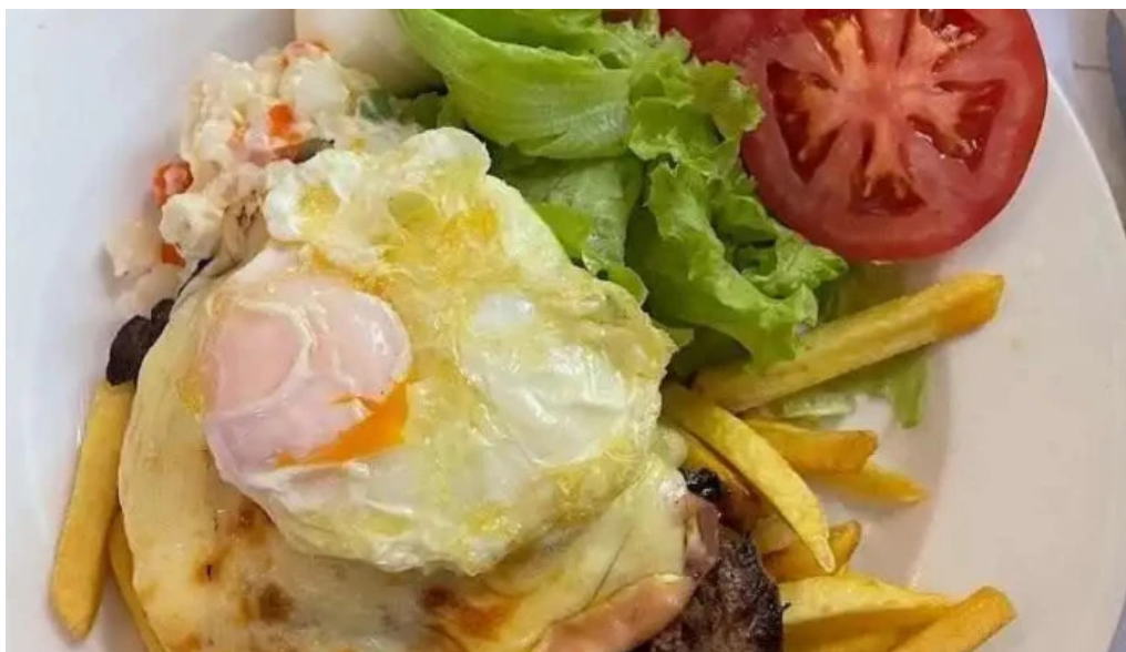
Su bar mas recientes