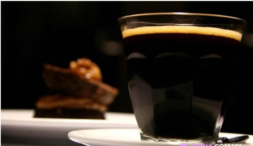
Su bar del propietario