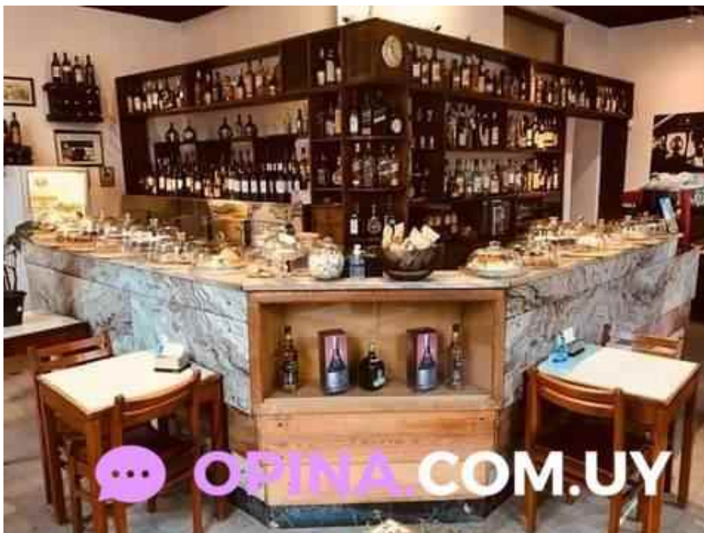
Su bar ambiente