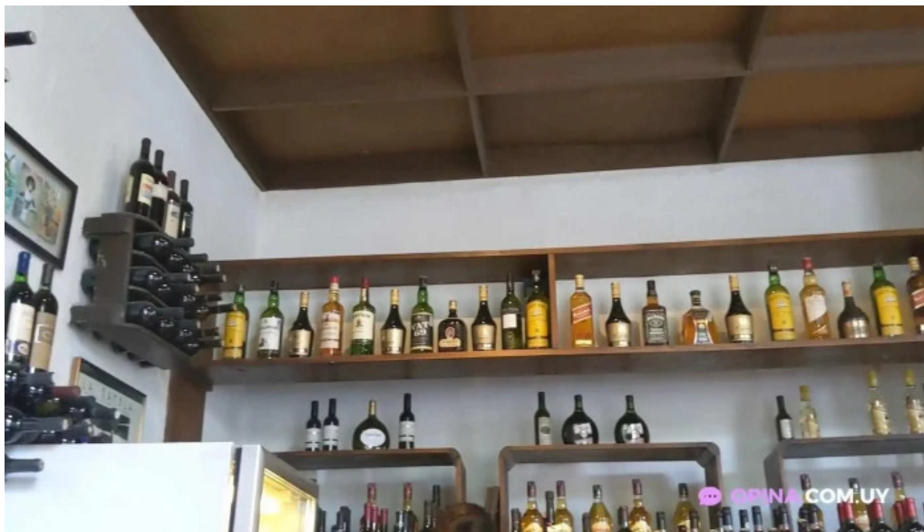
Su bar videos