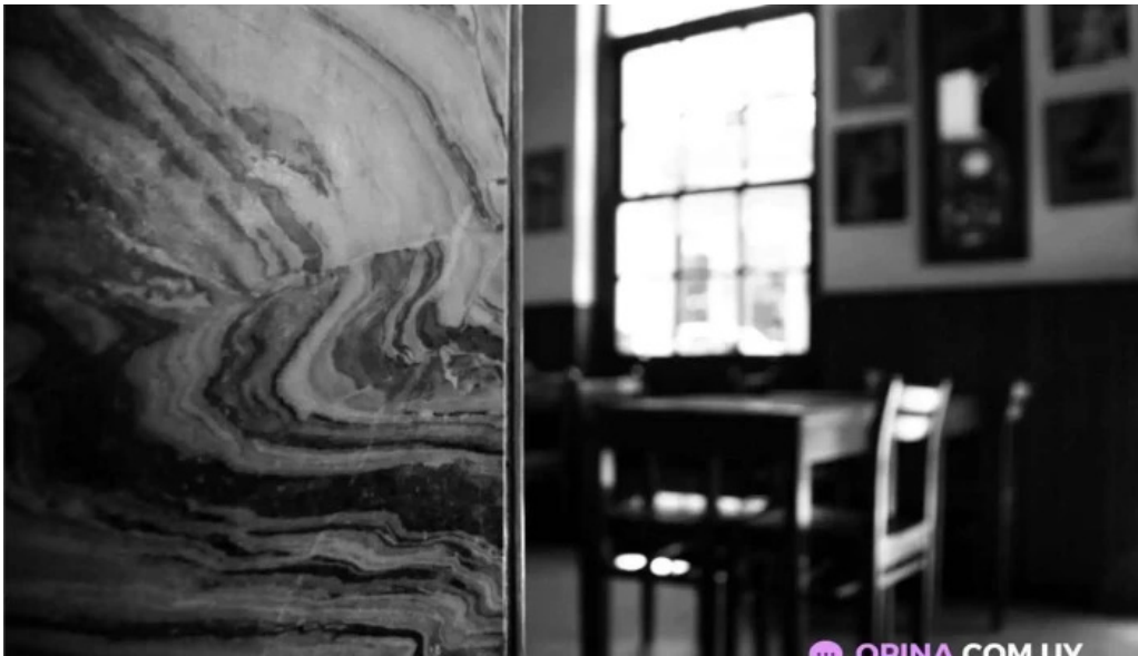
Su bar monteideo