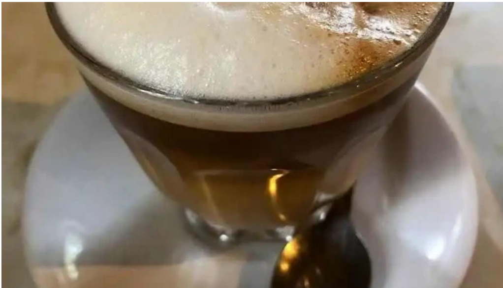
Su bar cortado