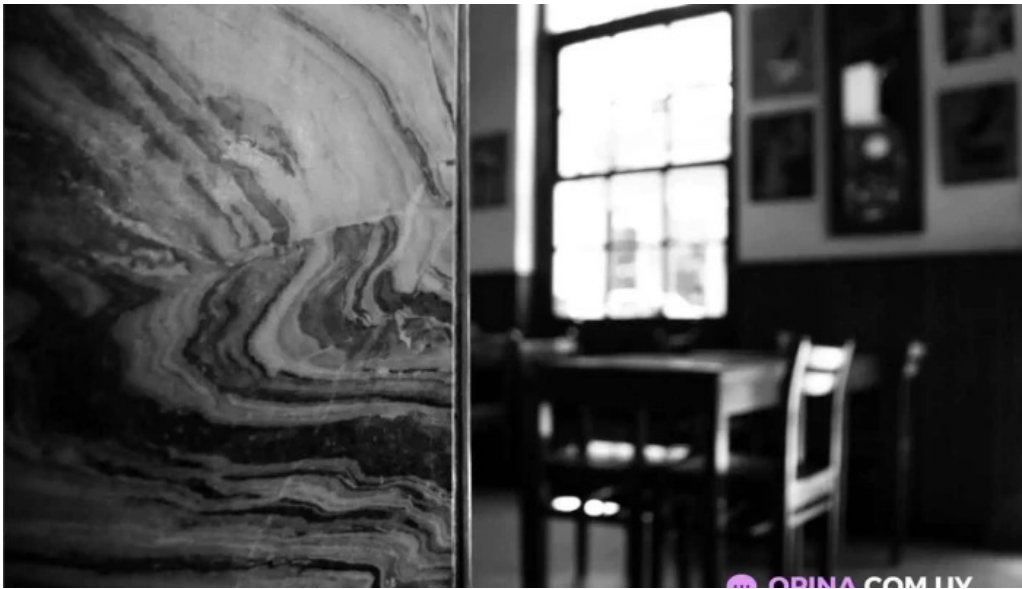
Su bar todas