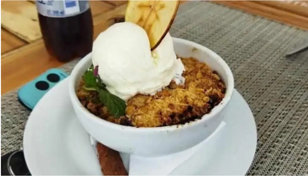
Salmuera comida y bebida