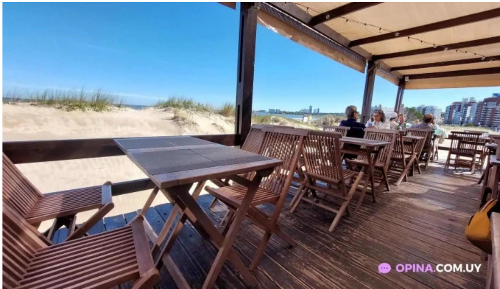
Salmuera mas recientes