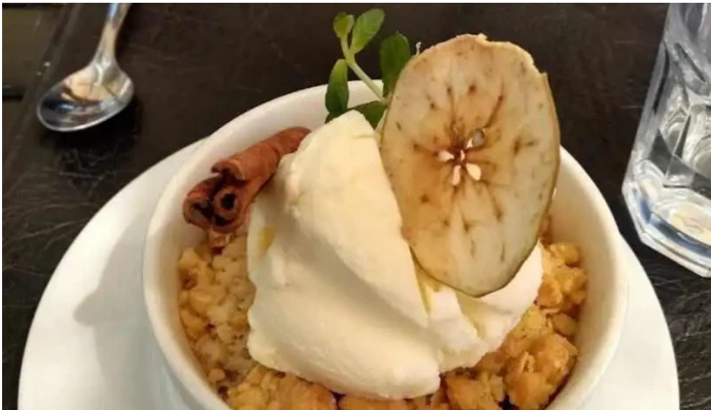
Salmuera crujiente de manzana