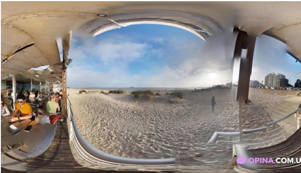
Salmuera street view y 360