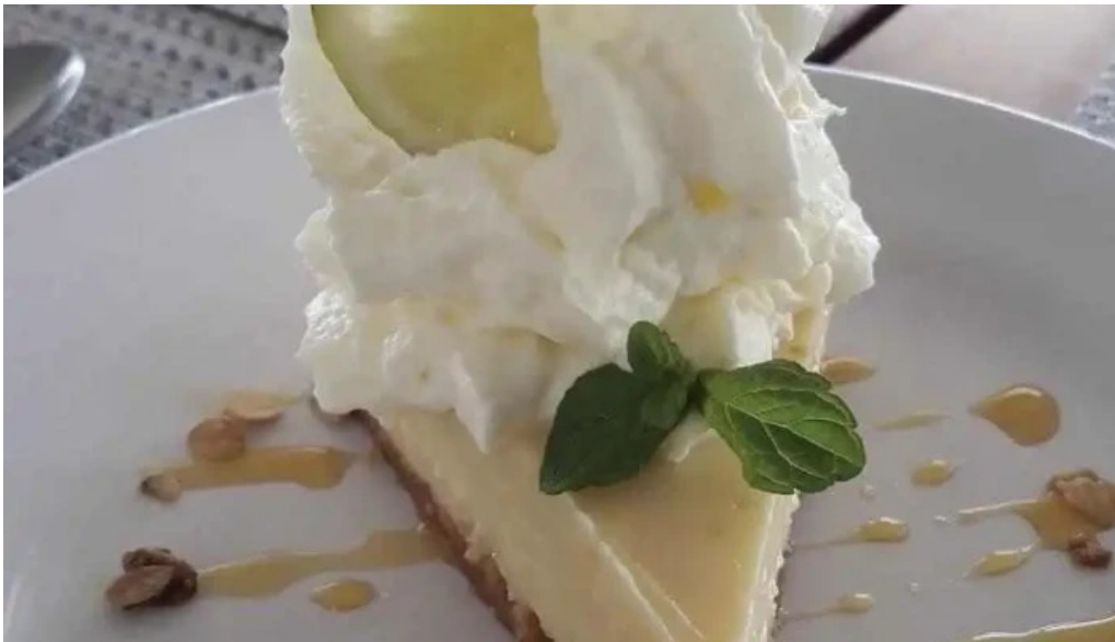
Salmuera tarta de lima