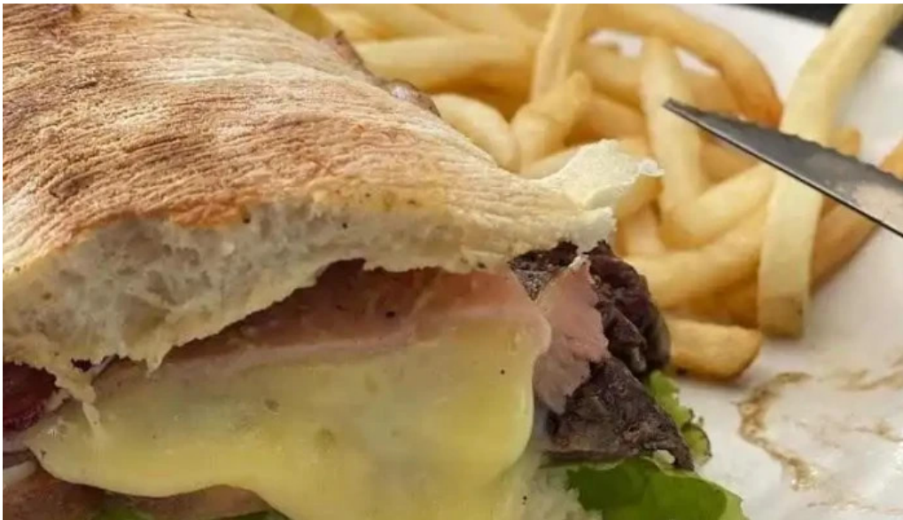
Salmuera sandwich de bistec