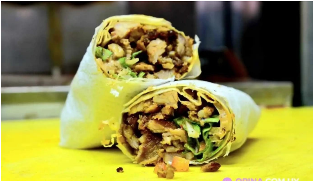
Restaurante shawarma estacion comida y bebida