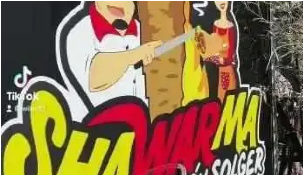
Restaurante shawarma estacion del propietario