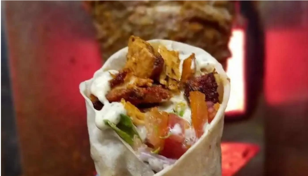
Restaurante shawarma estacion shawarma