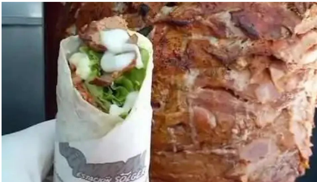
Restaurante shawarma estacion todas