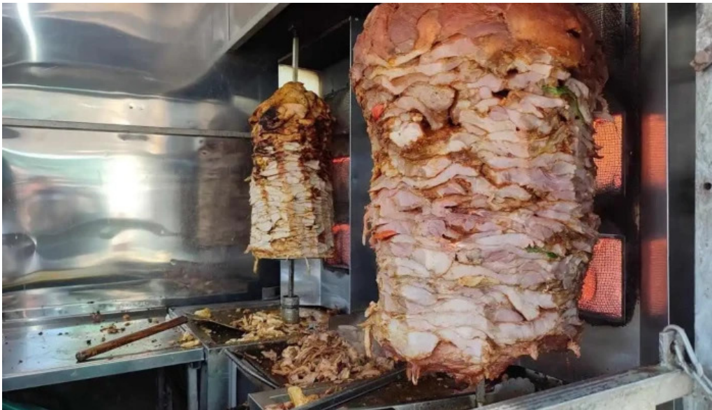
Restaurante shawarma estacion kebab