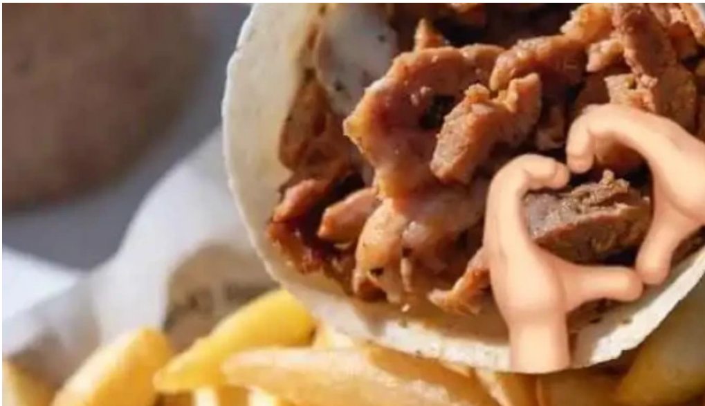
Restaurante shawarma estacion mas recientes