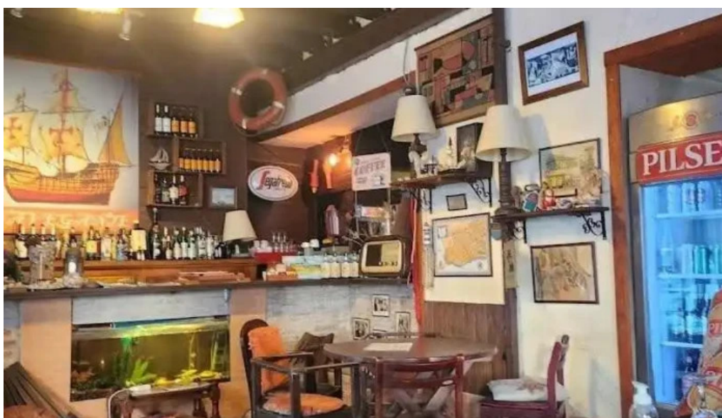
Restaurant el navegante ambiente