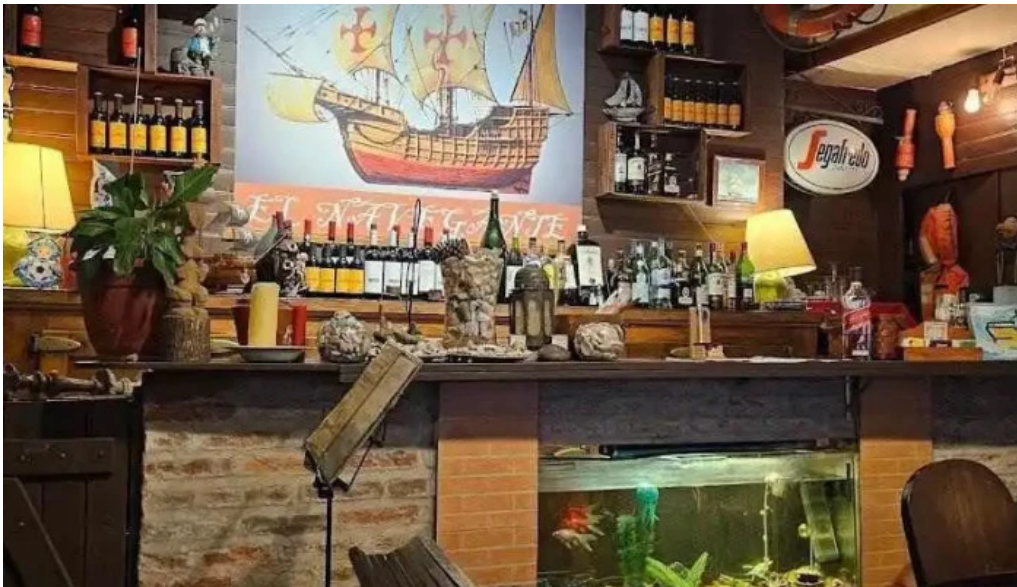
Restaurant el navegante montevideo