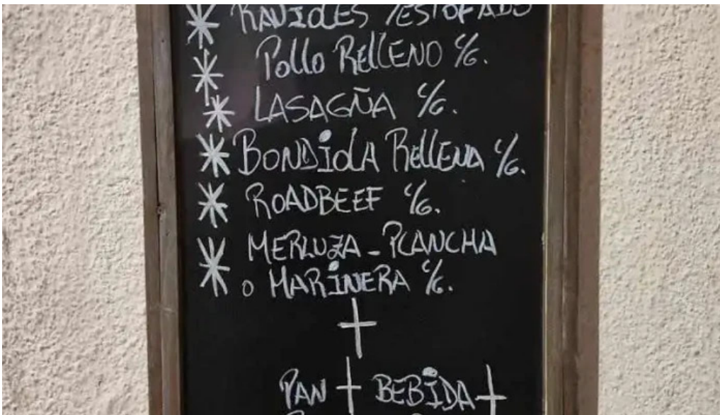
Restaurant el navegante menu