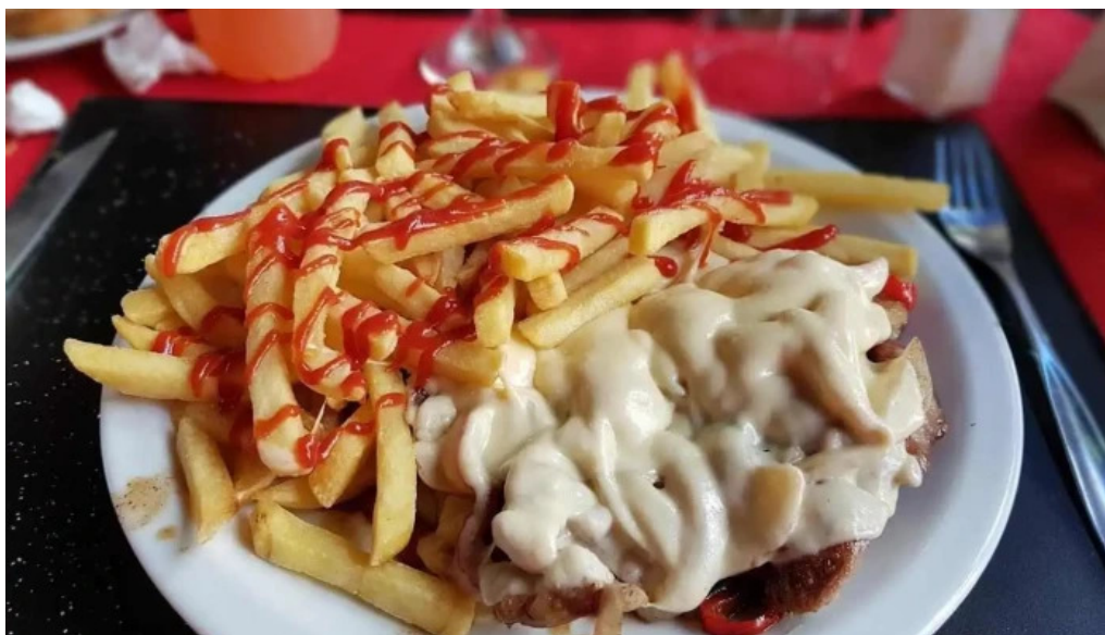
Restaurant el navegante comida y bebida