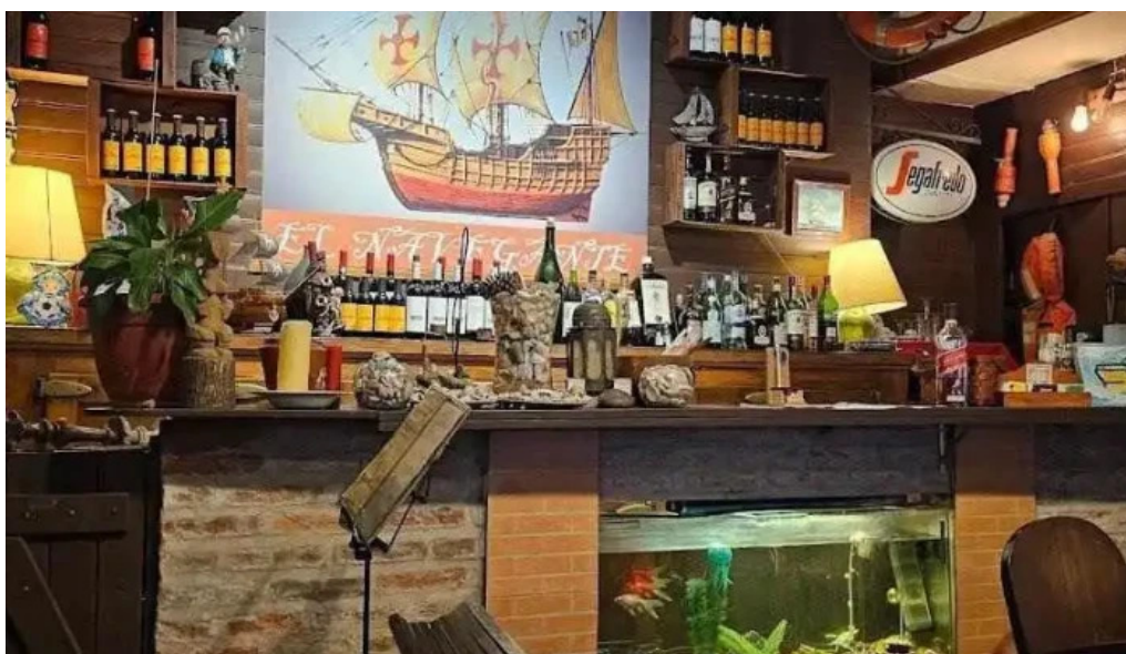
Restaurant el navegante todas