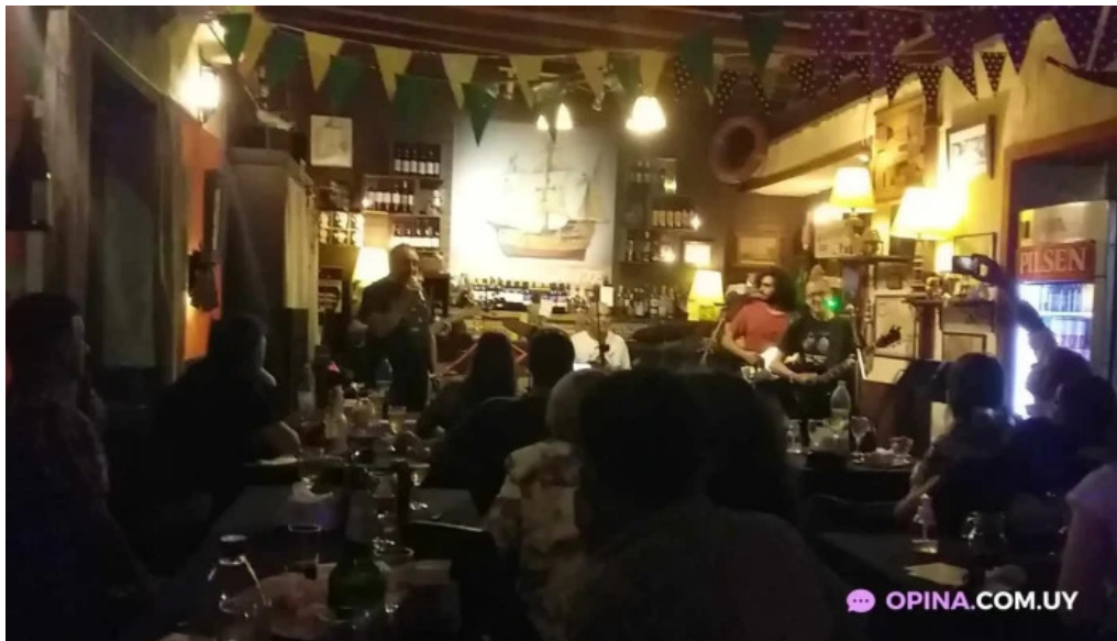
Restaurant el navegante videos