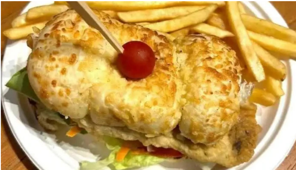
Punto pez comida y bebida