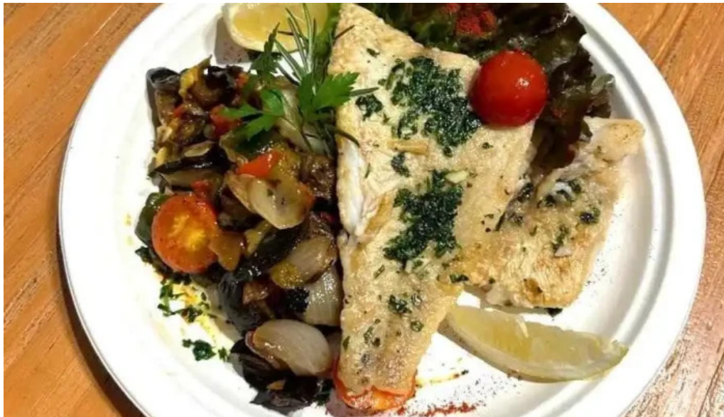
Punto pez montevideo