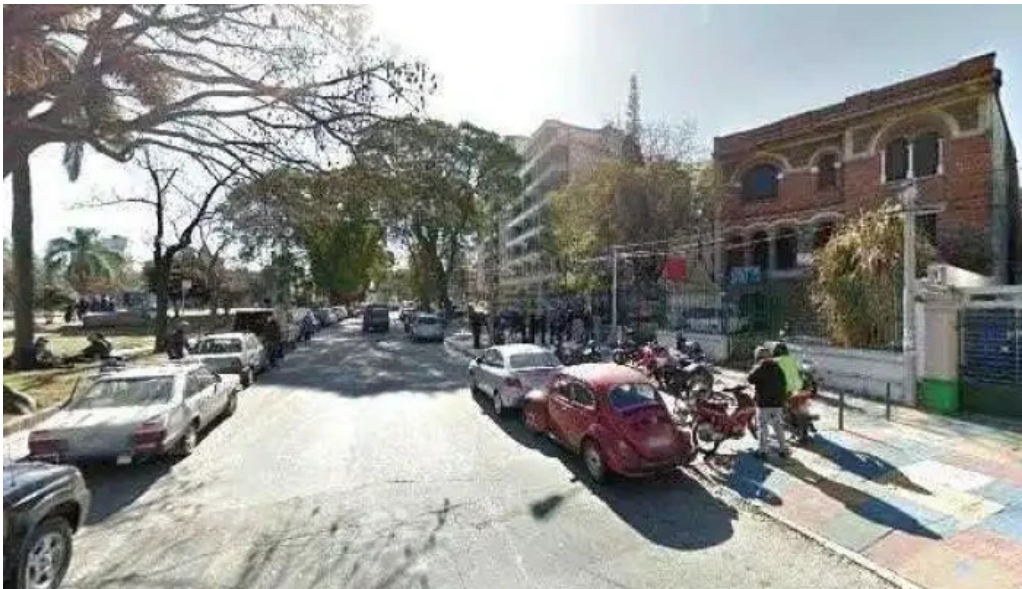
Punto pez street view y 360