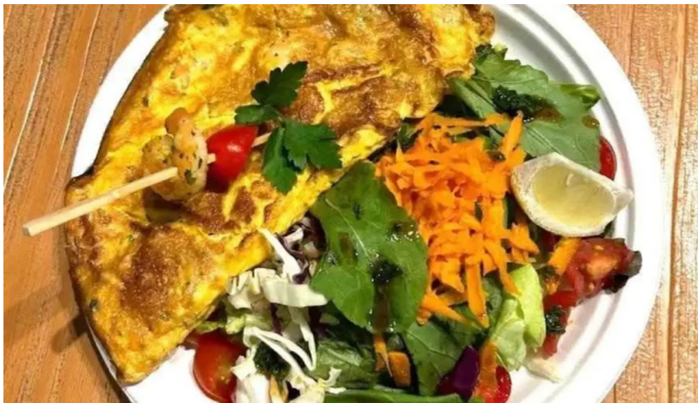
Punto pez del propietario