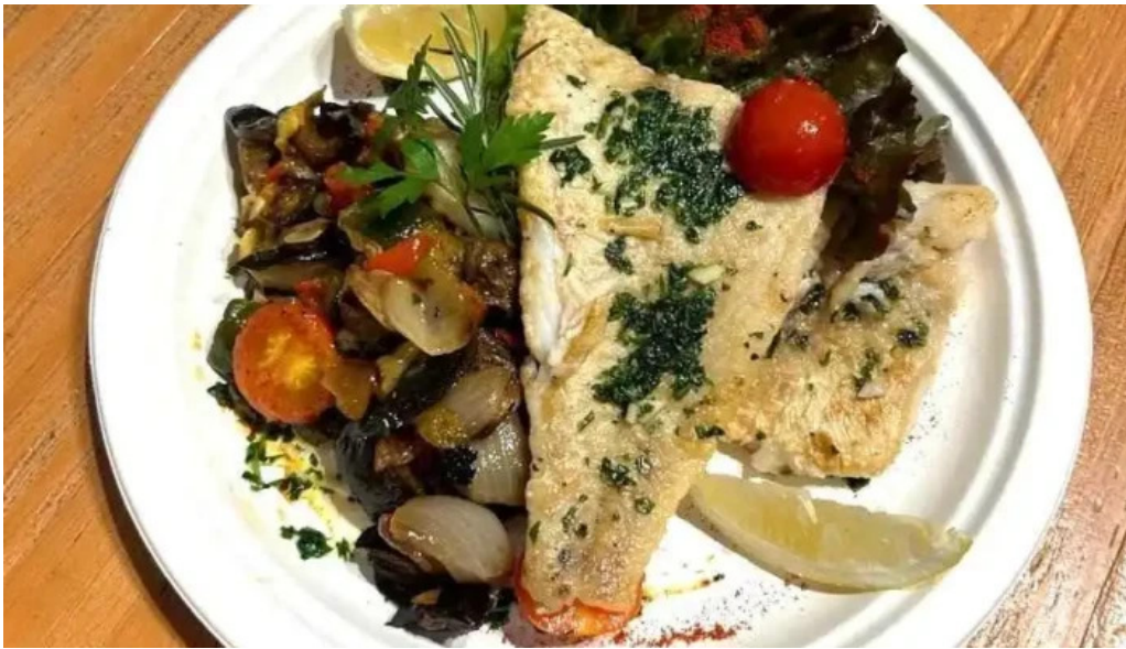
Punto pez todas