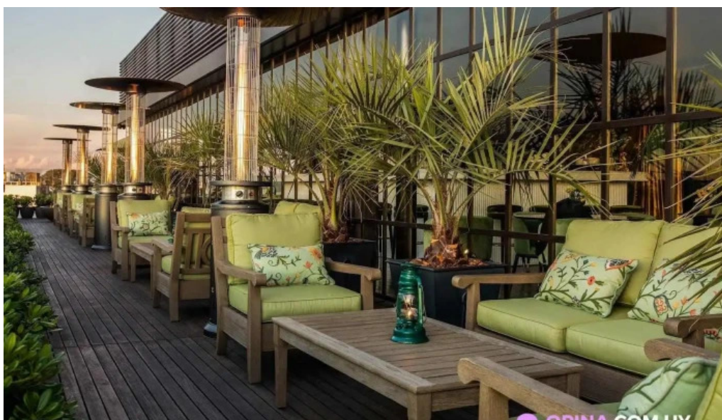
Polo bamba todas