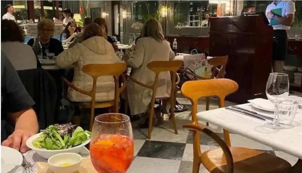
Polo bamba comida y bebida