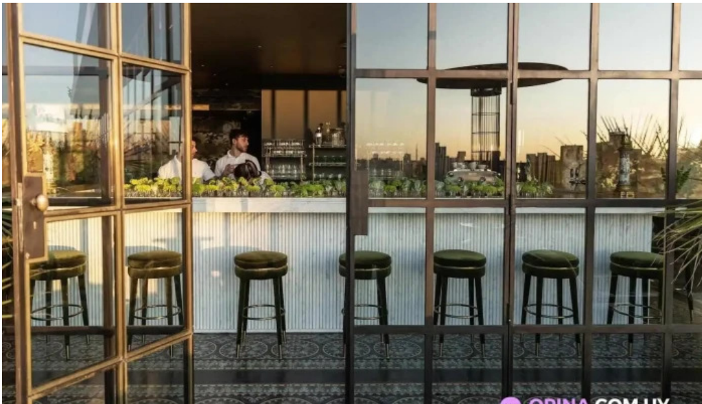
Polo bamba ambiente