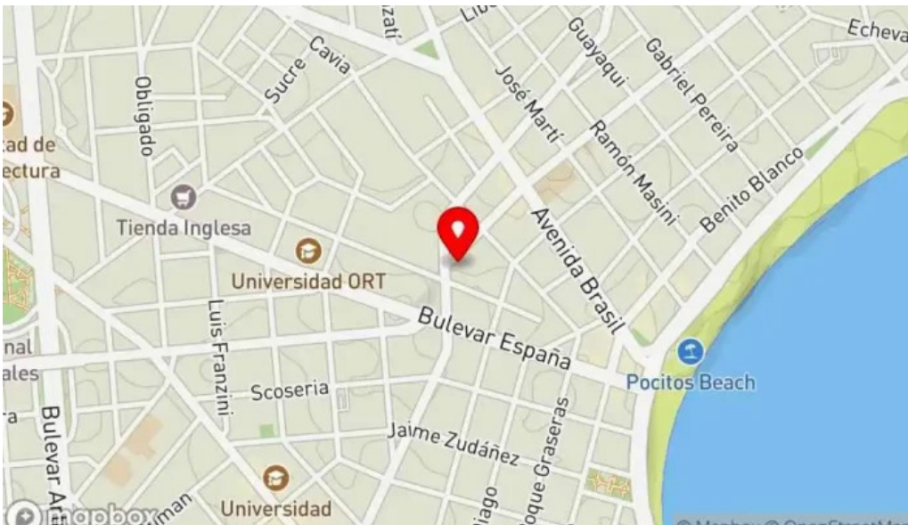
Polo bamba mapa