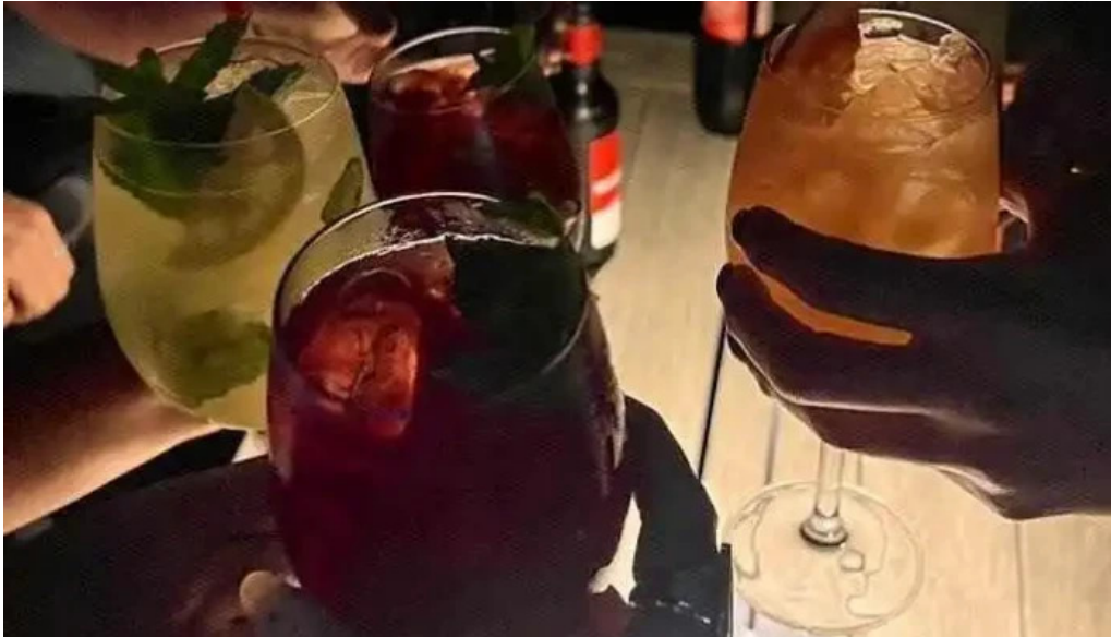
Polo bamba mas recientes