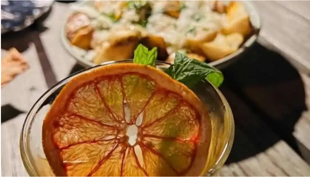
Polo bamba jugo