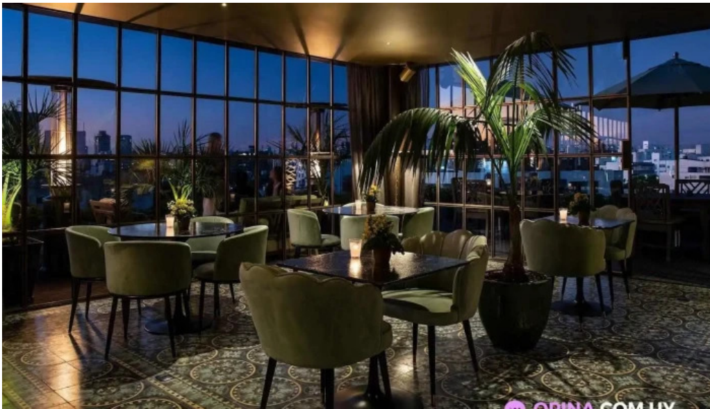
Polo bamba del propietario