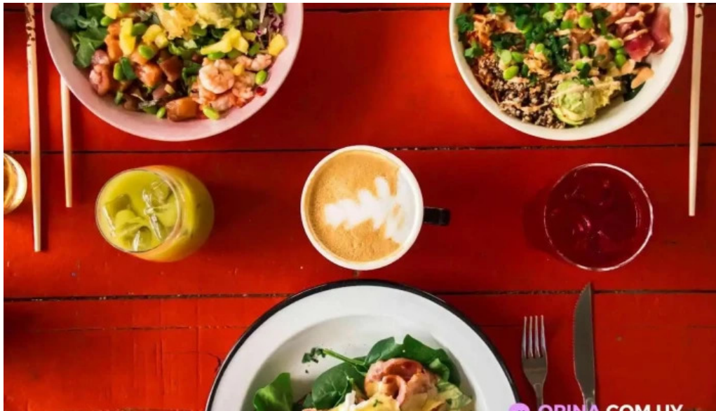
Obra del propietario