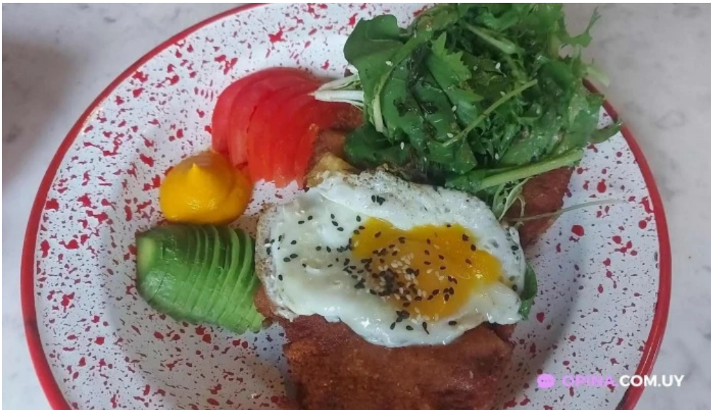
Obra mas recientes