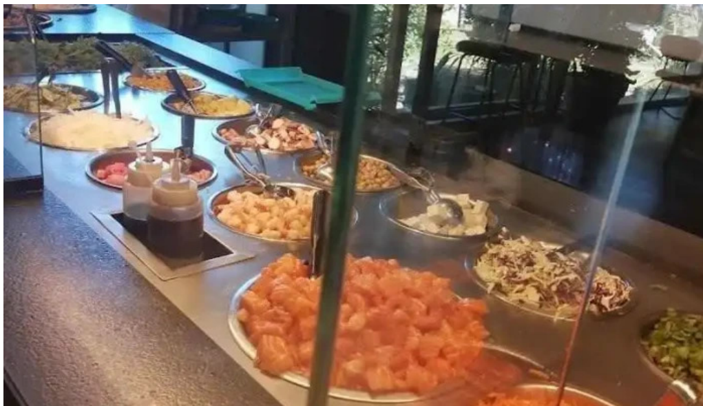
Obra comida y bebida