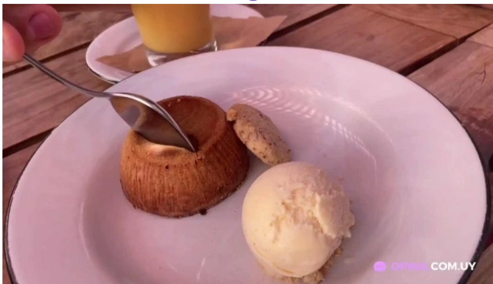
Manzanar restaurant videos