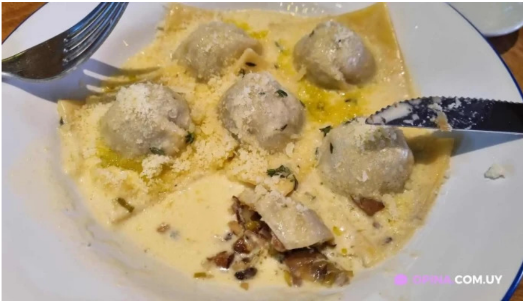
Manzanar restaurant ravioli