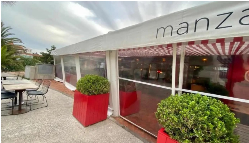
Manzanar restaurant montevideo