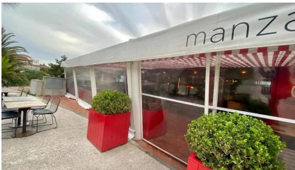
Manzanar restaurant todas