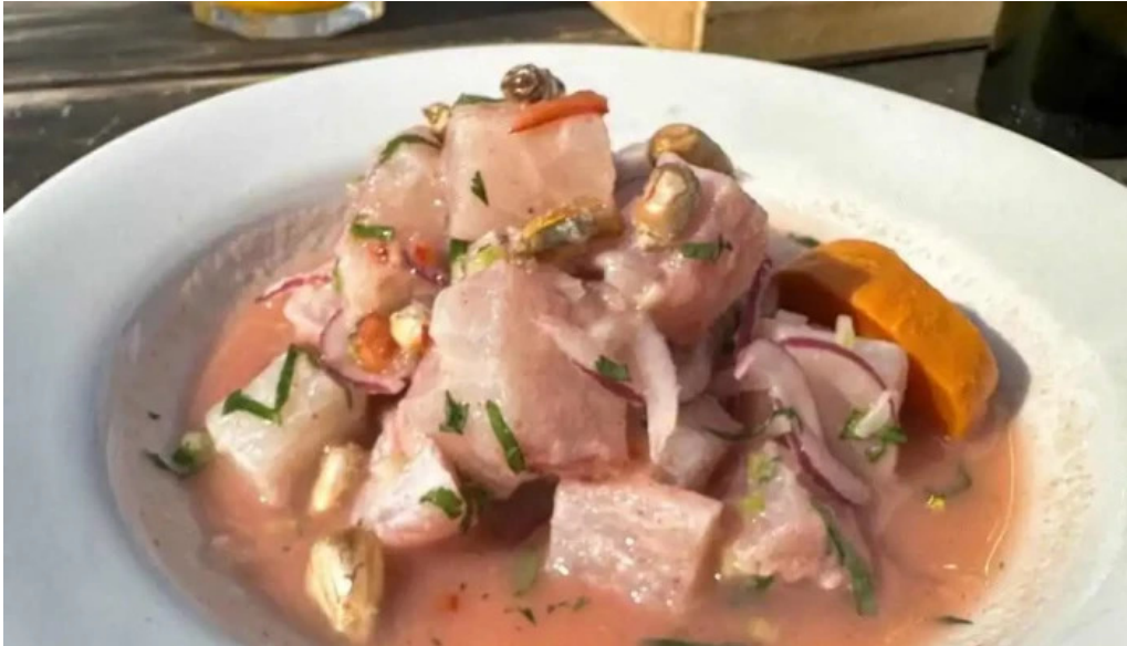
Manzanar restaurant ceviche