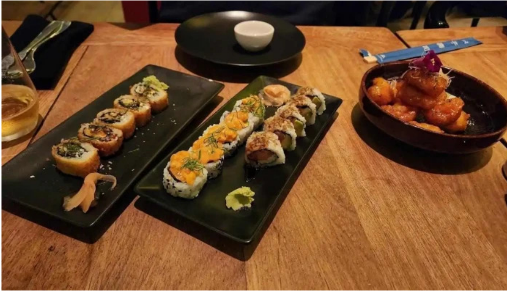
Manzanar restaurant sushi