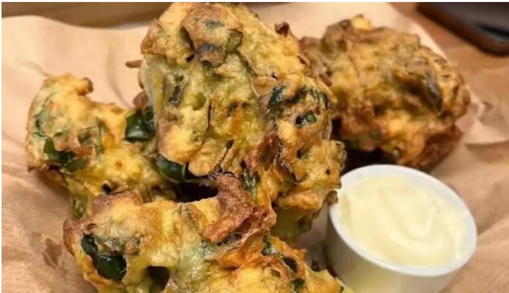
Manzanar restaurant pakora