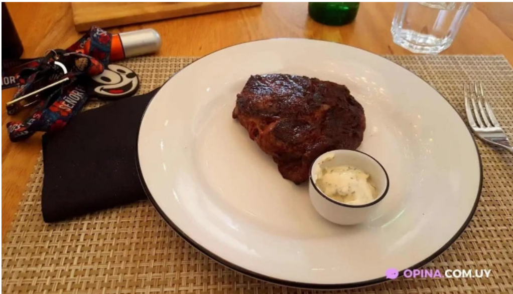
Manzanar restaurant ribeye