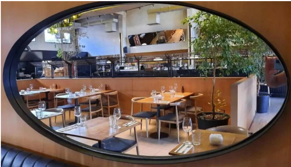
Manzanar restaurant ambiente