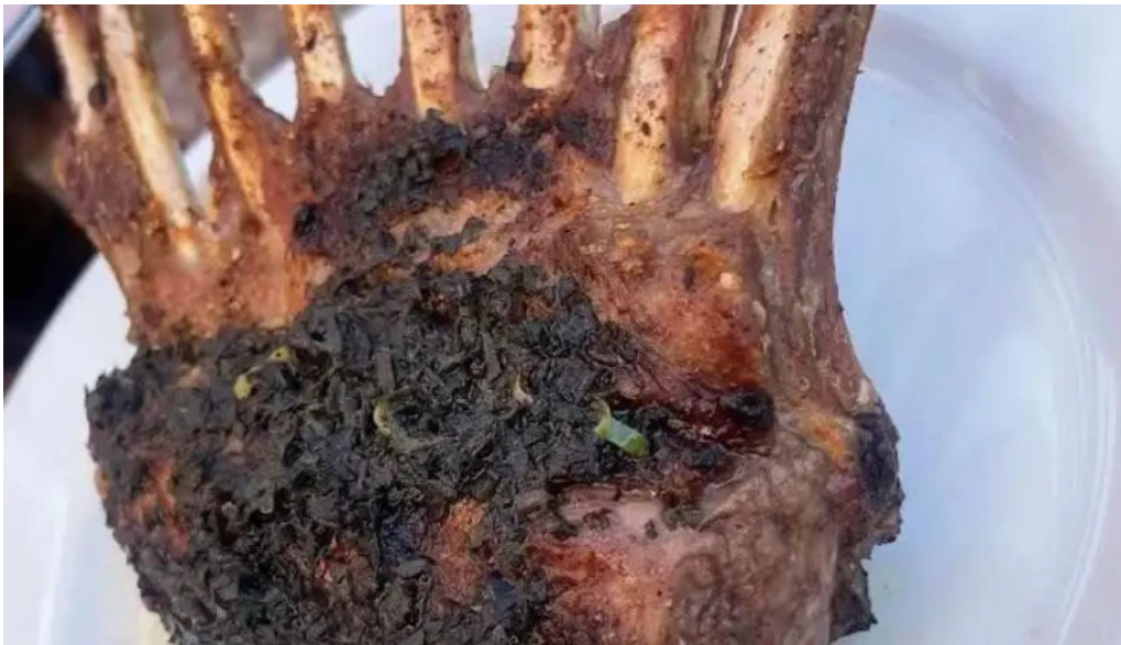
Manzanar restaurant costillar de cordero