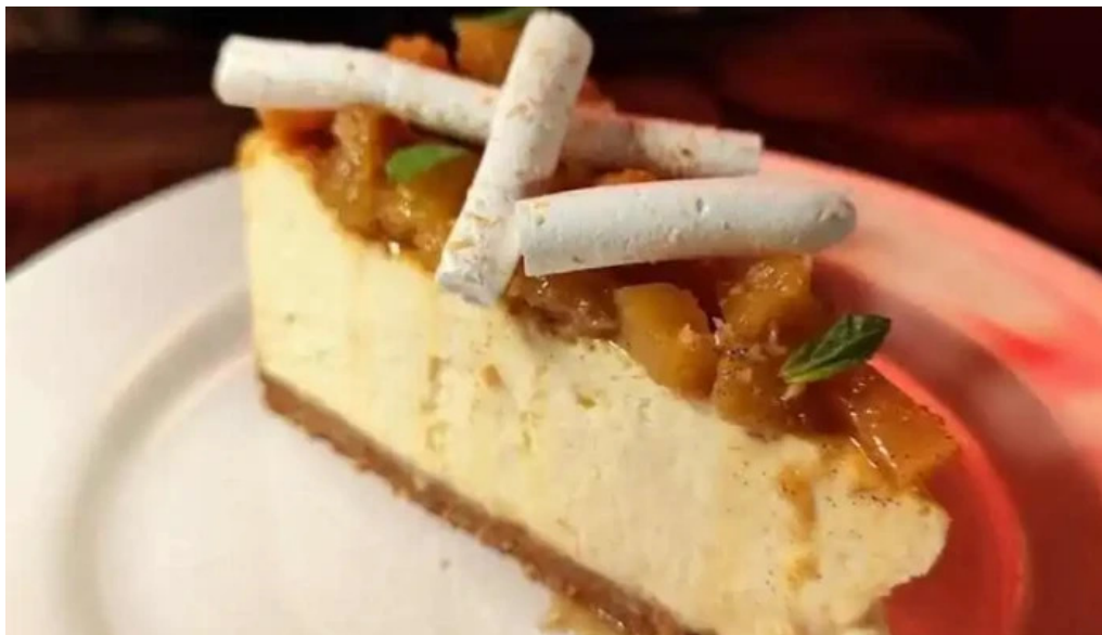
Manzanar restaurant mas recientes