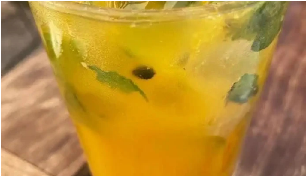
Manzanar restaurant mojito