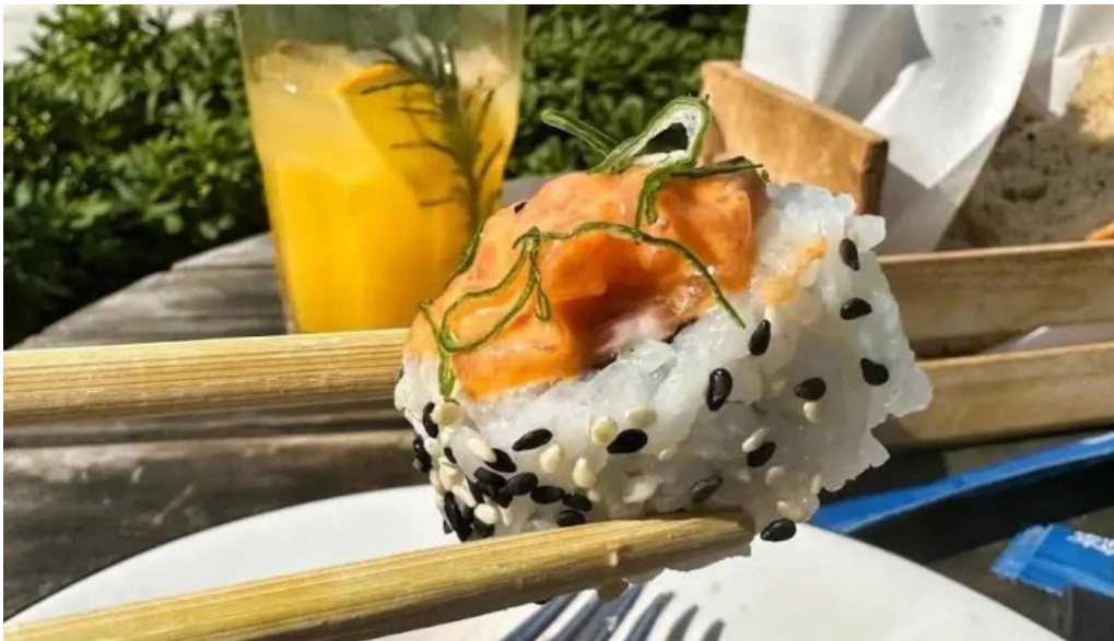
Manzanar restaurant comida y bebida