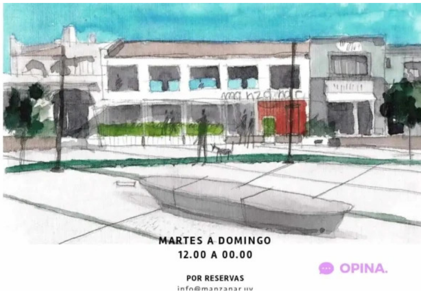
Manzanar restaurant del propietario