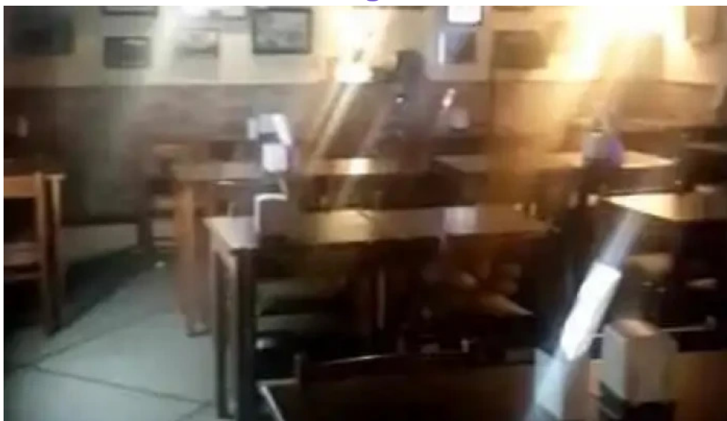
Lo de vicente videos