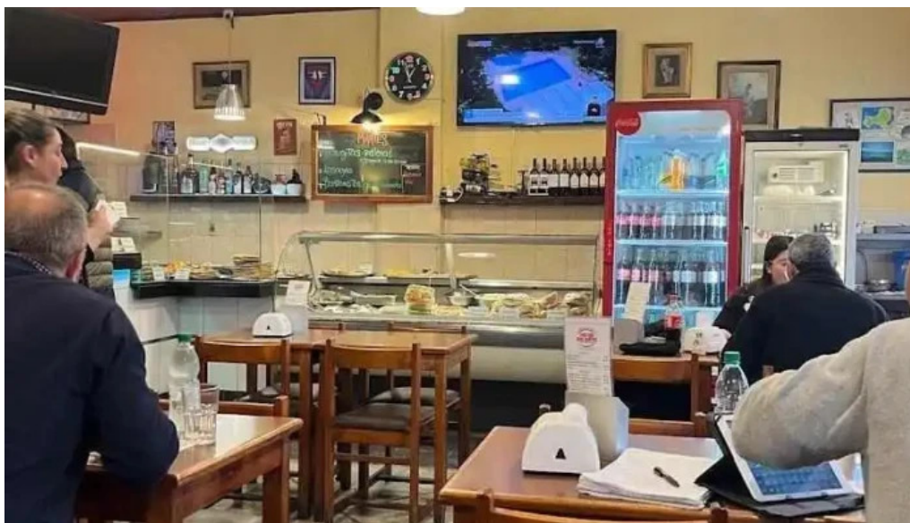
Lo de vicente ambiente