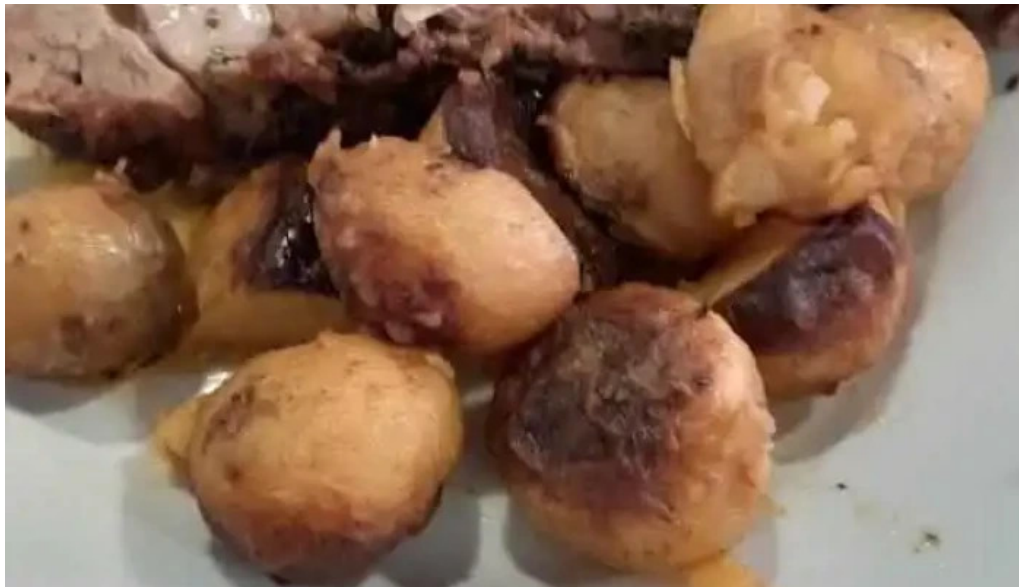
Lo de vicente mas recientes