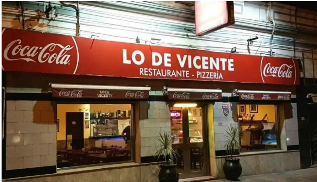
Lo de vicente montevideo