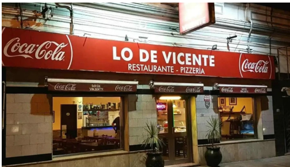
Lo de vicente todas