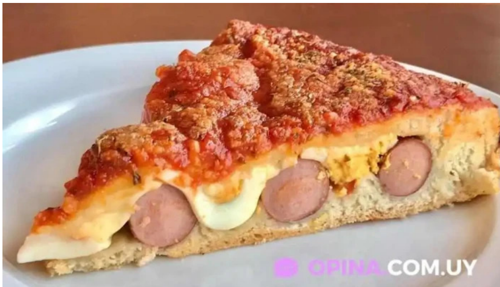
Lo de vicente comida y bebida