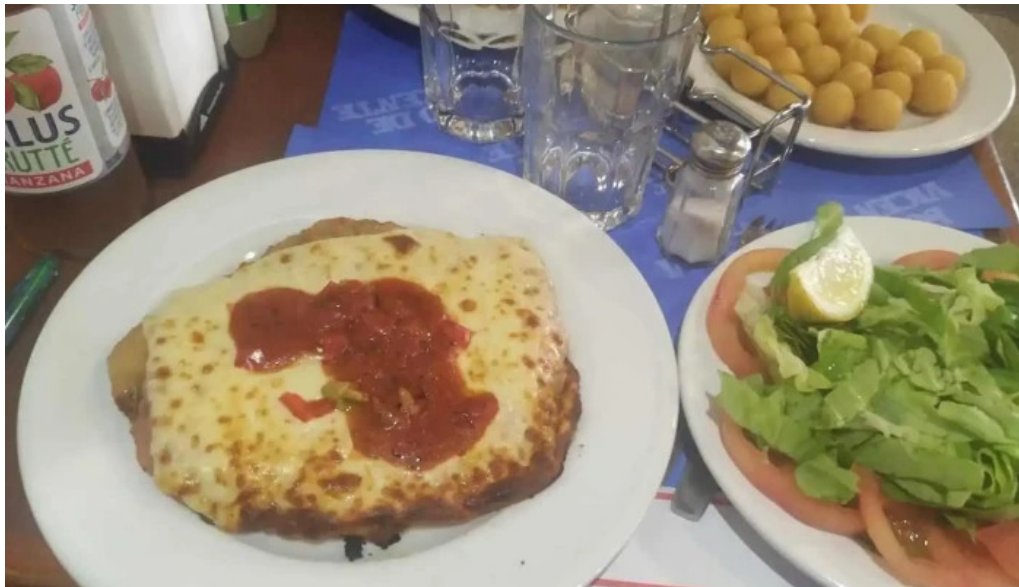
Lo de vicente milanesa