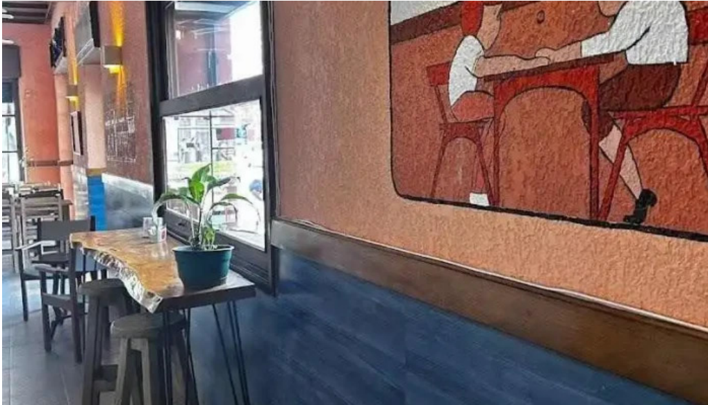
Lempicka restobar montevideo