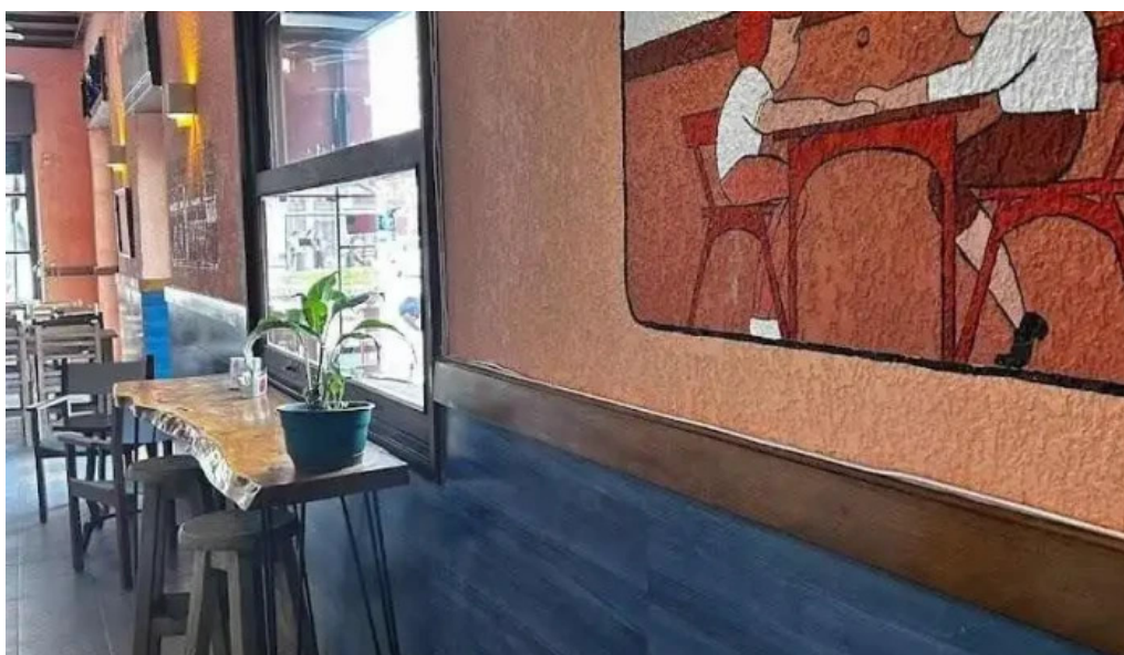
Lempicka restobar todas