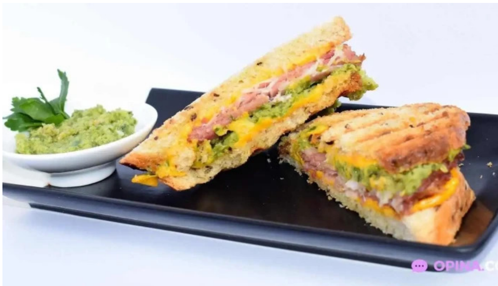
Lempicka restobar comida y bebida