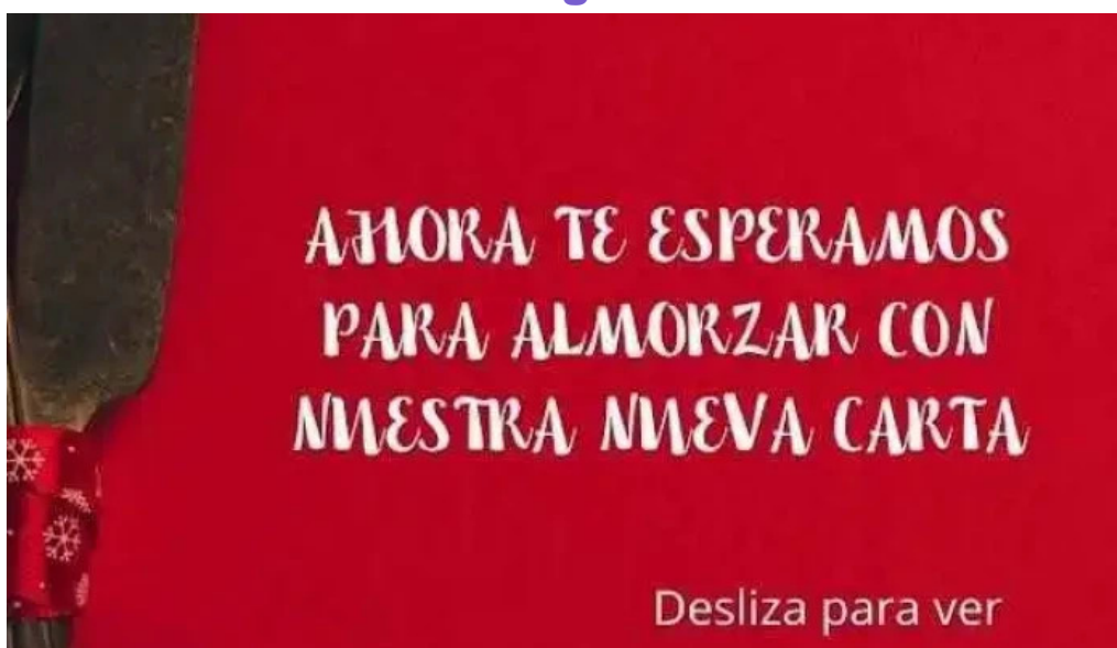
Lempicka restobar videos