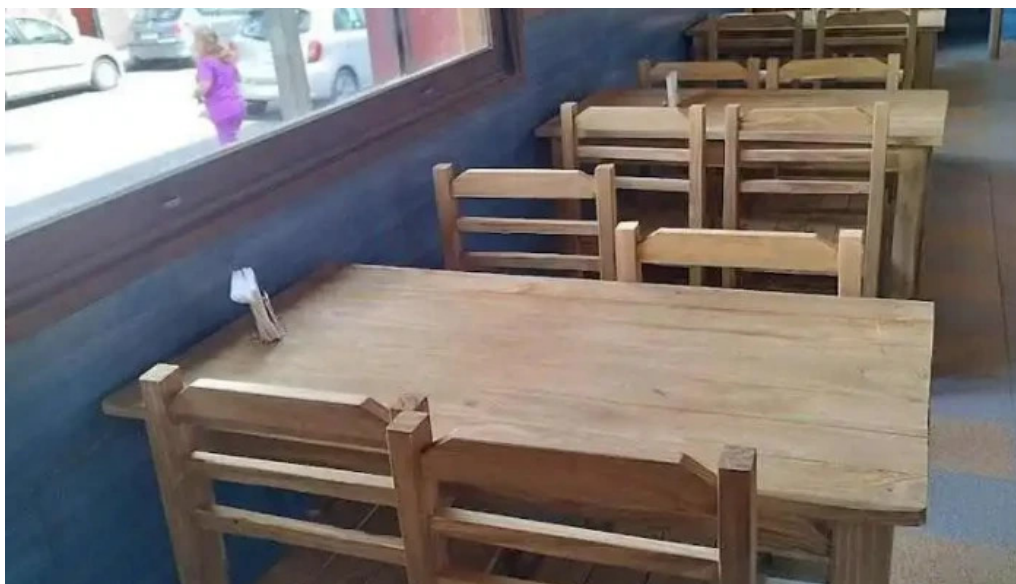
Lempicka restobar ambiente