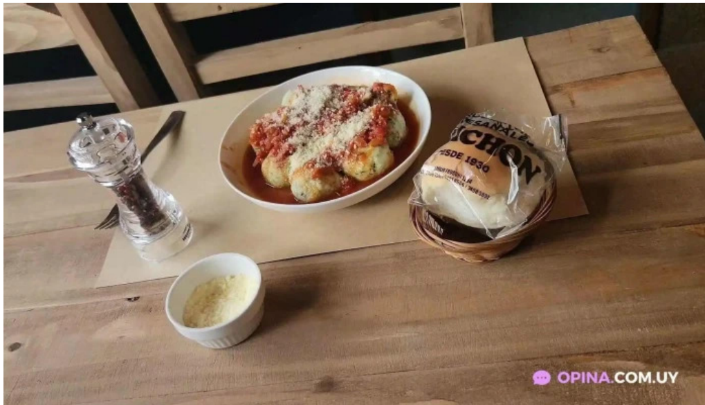
Lempicka restobar del propietario