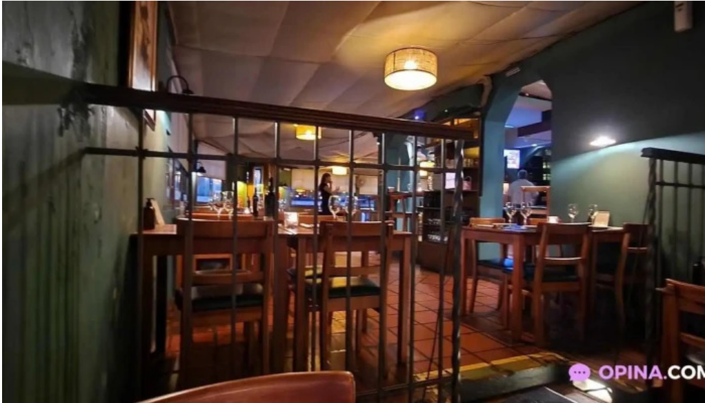
La perdiz ambiente