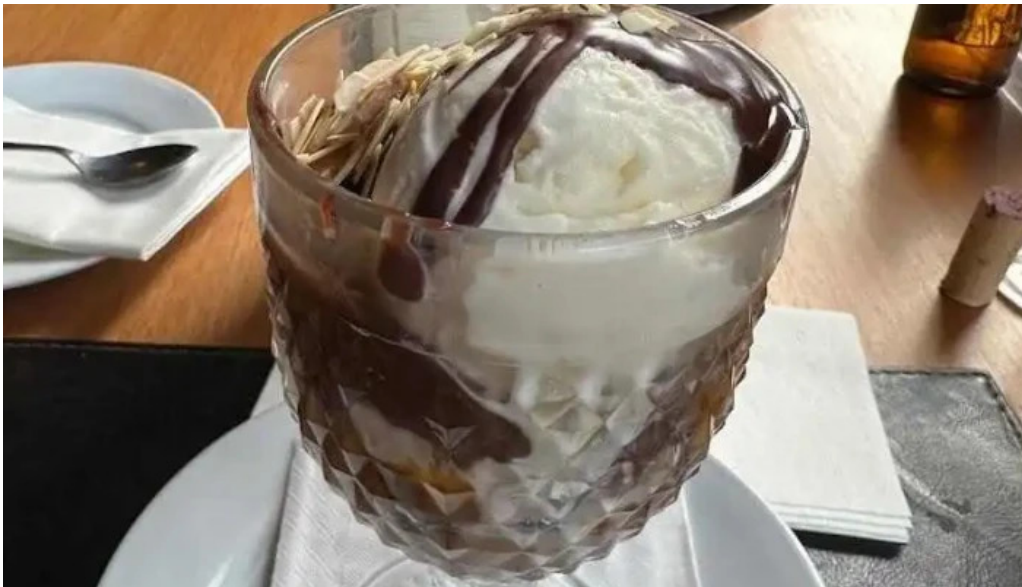
La perdiz affogato