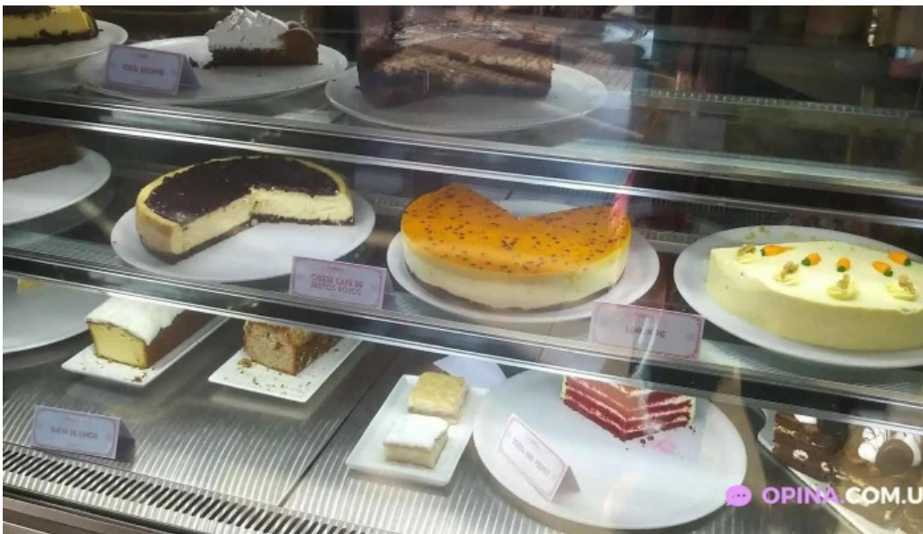
La panera rosa comida y bebida