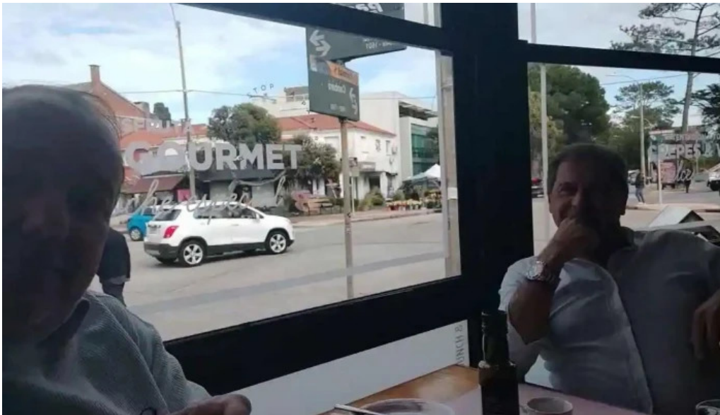
La panera rosa mas recientes