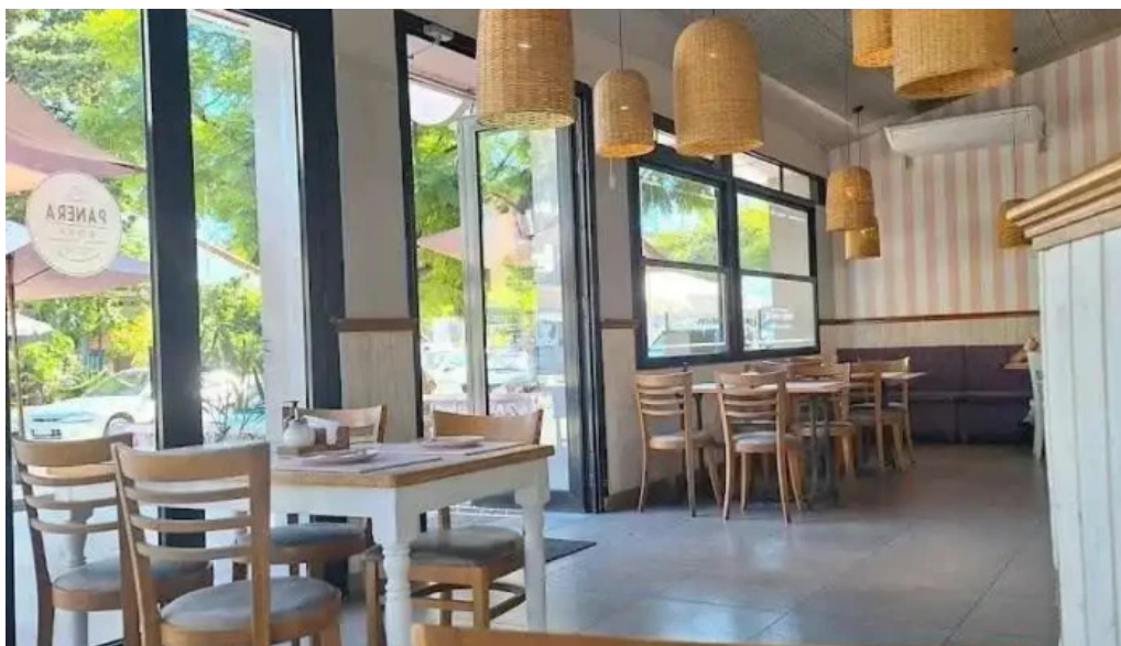
La panera rosa ambiente