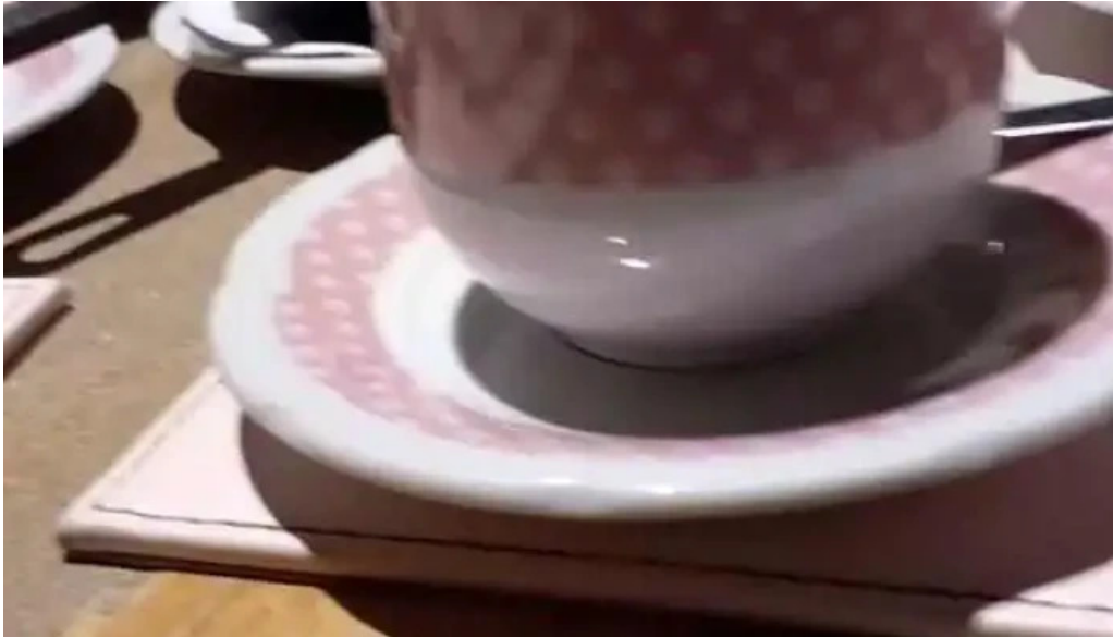
La panera rosa videos