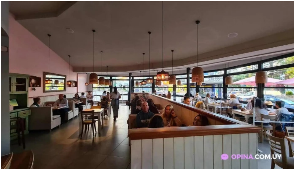
La panera rosa todas