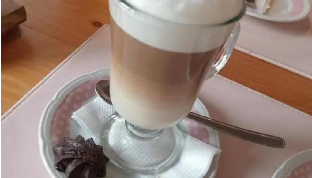
La panera rosa cortado