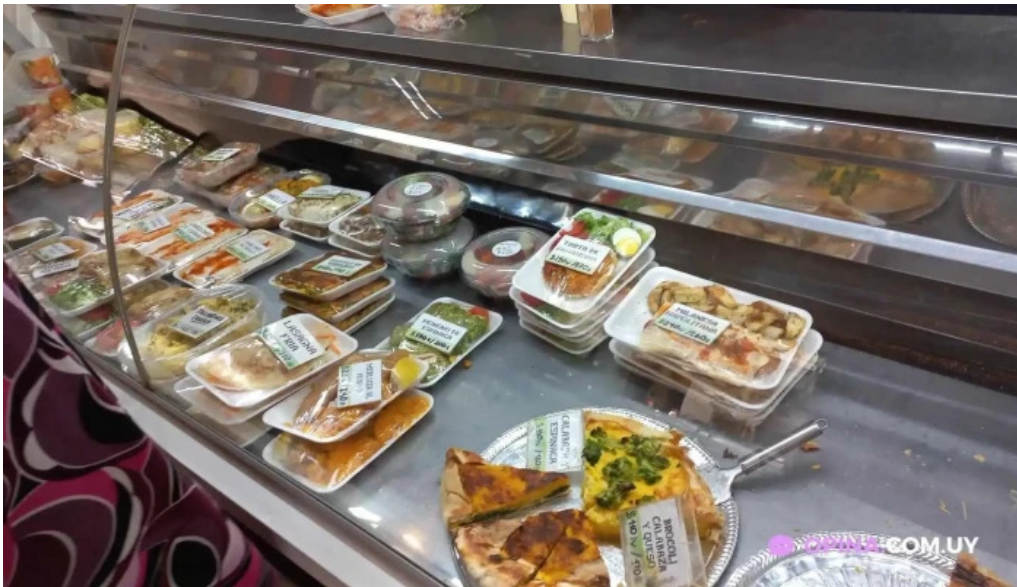
La iberica dos platos monteideo