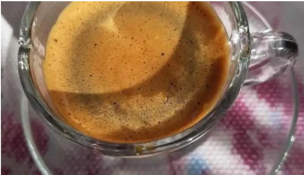
La iberica dos platos comida y bebida