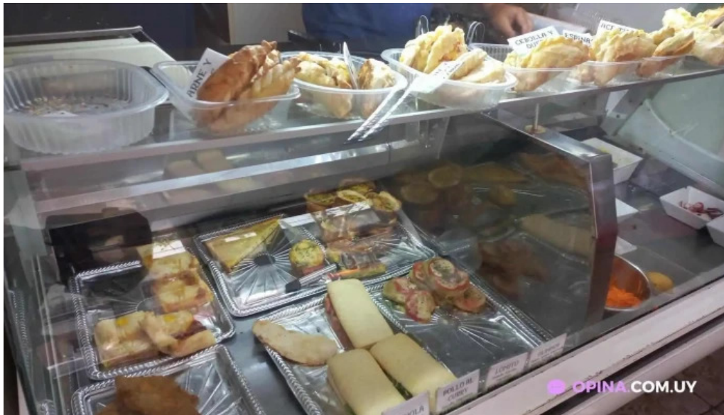
La iberica dos platos ambiente