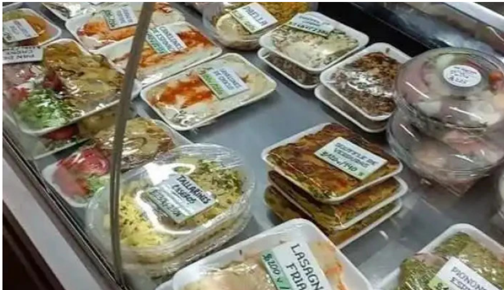
La iberica dos platos videos