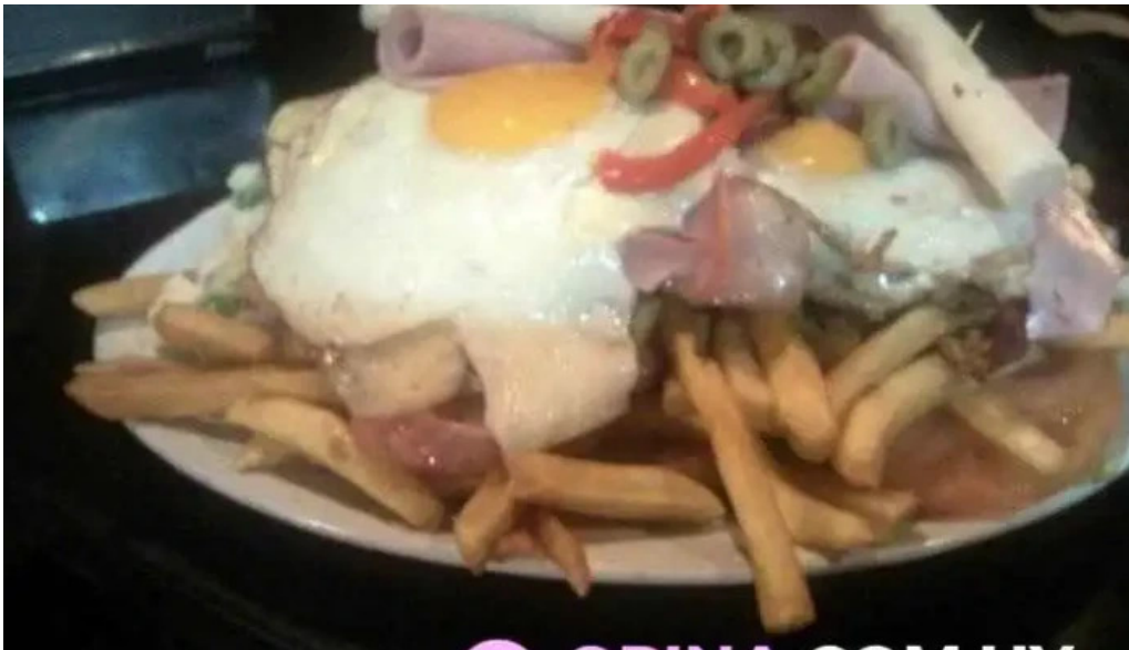
La flamma bar del propietario