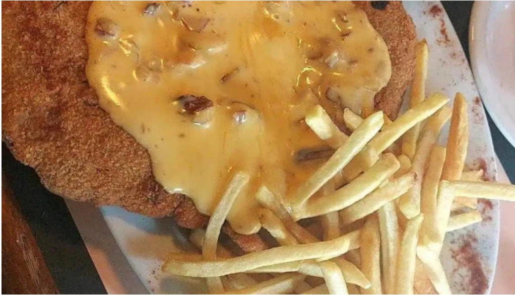
La flamma bar recientes