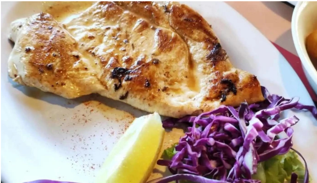
La flamma bar filete