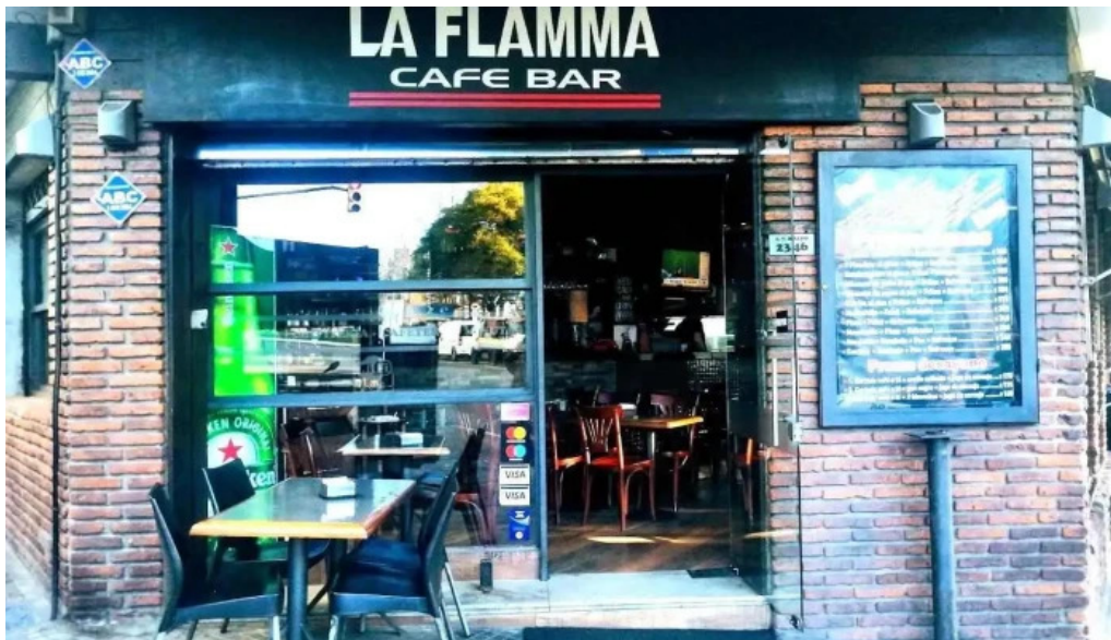
La flamma bar montevideo