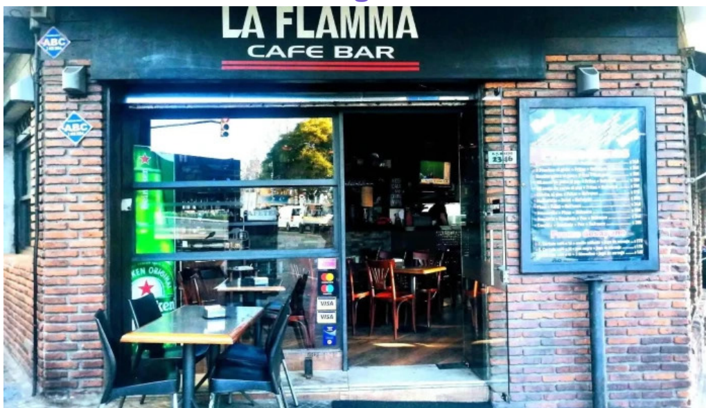
La flamma bar todo