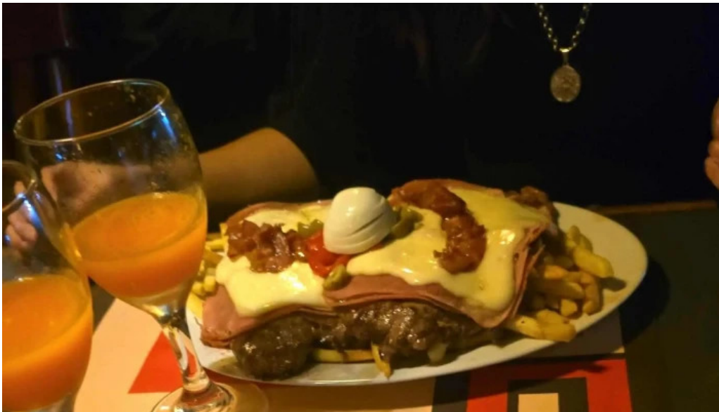
La flamma bar comentario 3