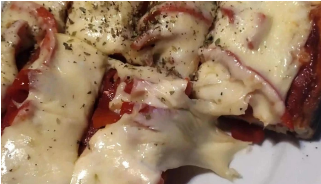
La flamma bar comentario 1