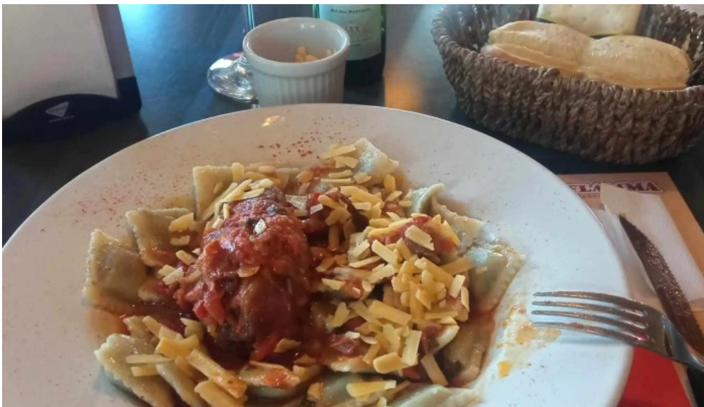
La flamma bar comentario 5