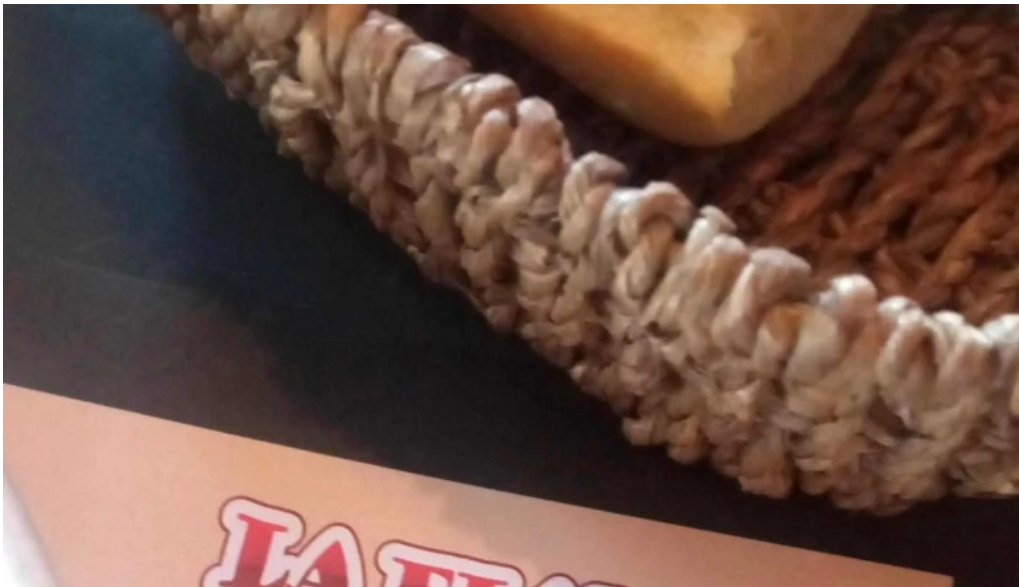
La flamma bar comentario 6