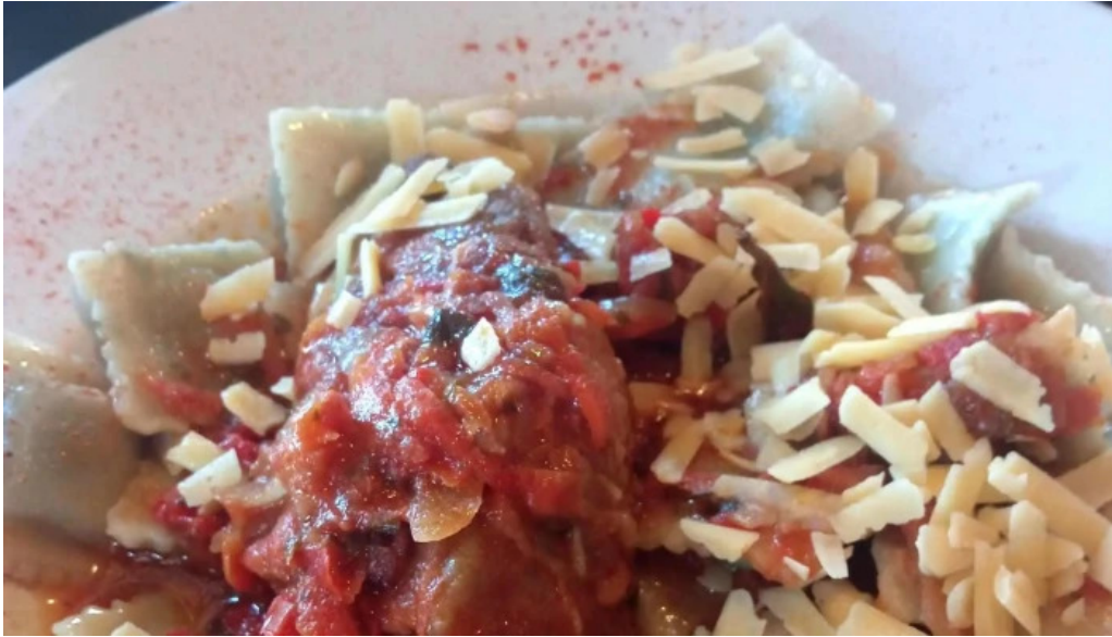
La flamma bar comentario 4