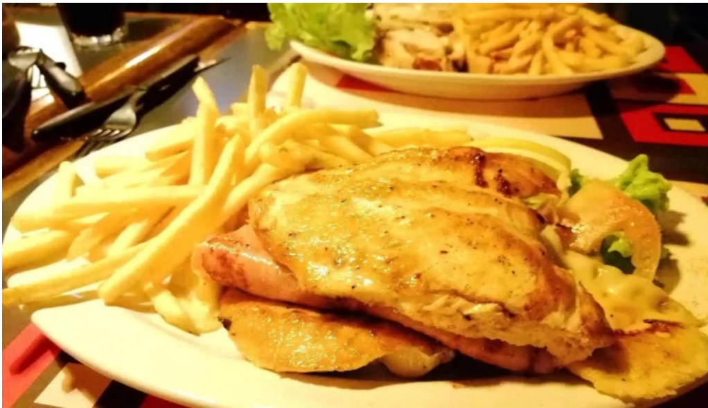
La flamma bar papas fritas