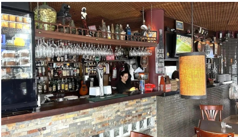
La flamma bar ambiente