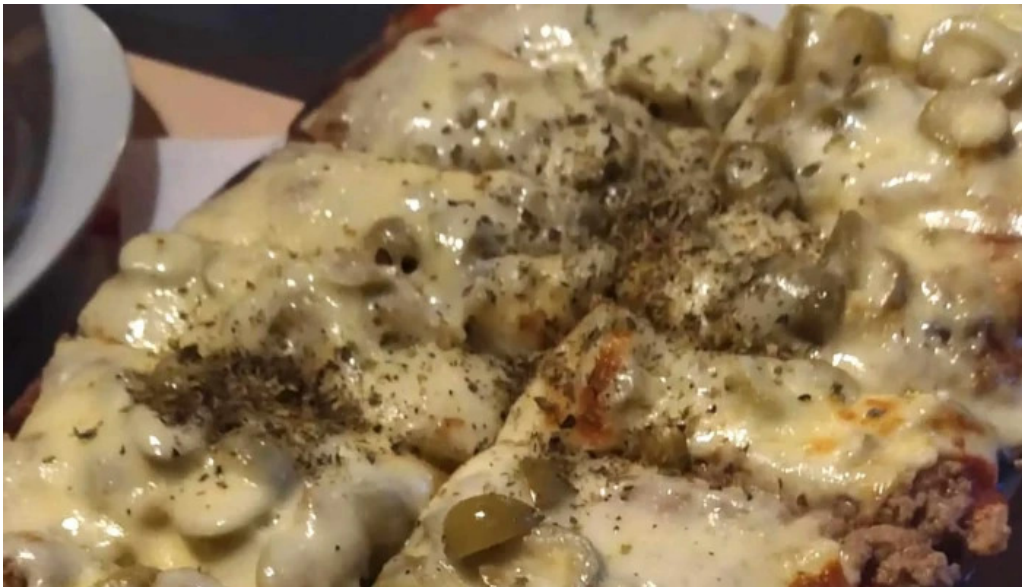
La flamma bar comentario 2