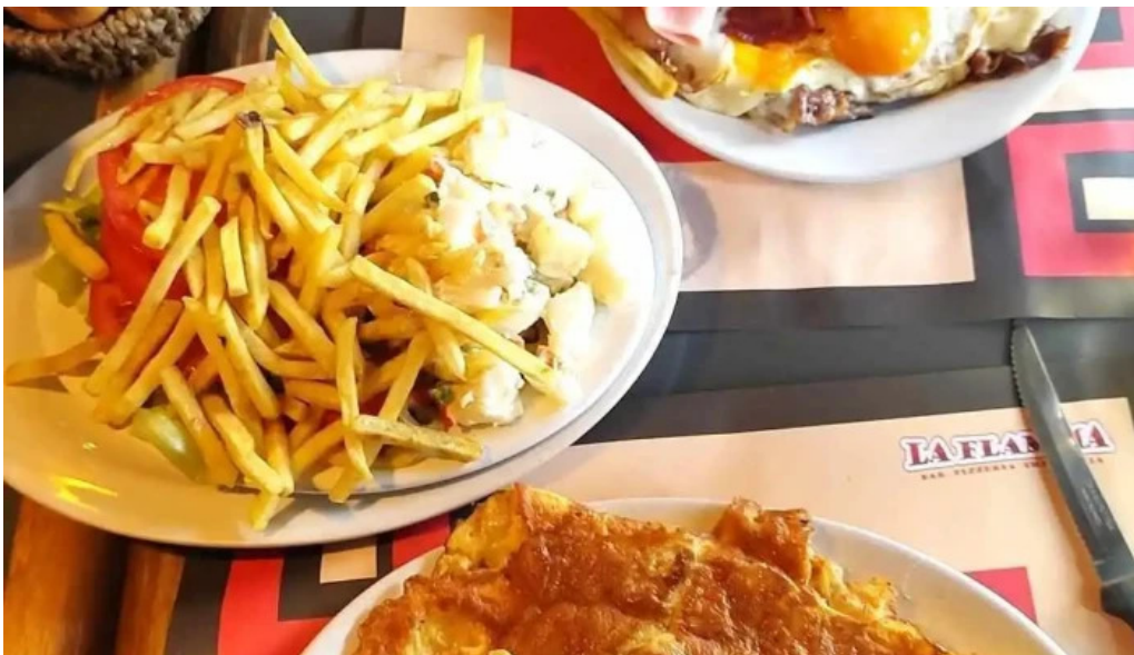
La flamma bar comidas y bebidas