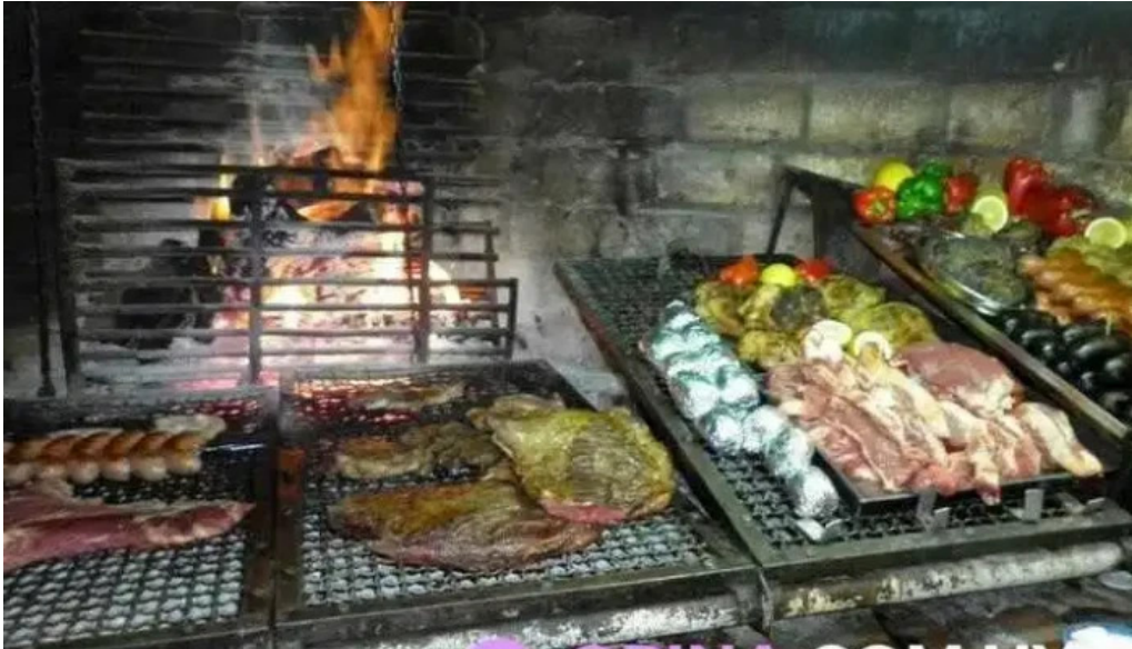
La esquina azul ambiente