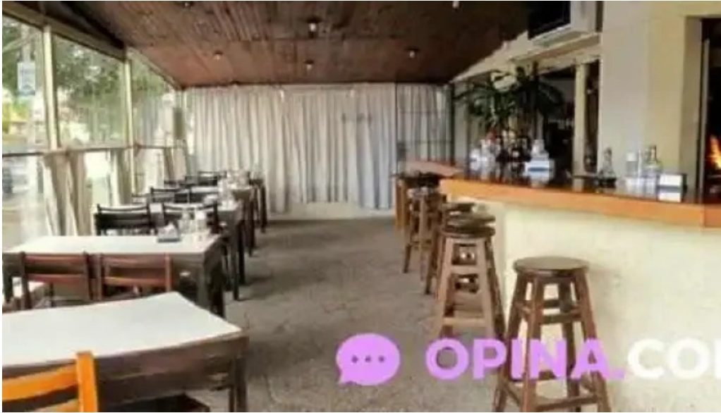
La esquina azul todas