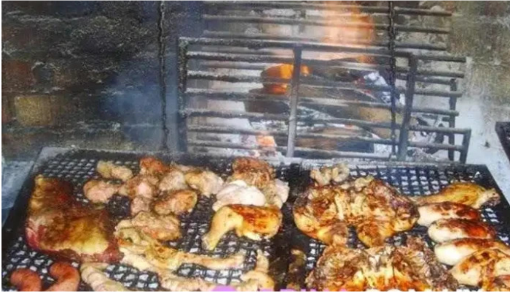
La esquina azul del propietario