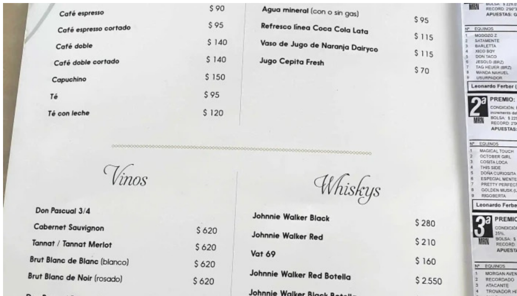
Ituzaiño restaurant comentario 2