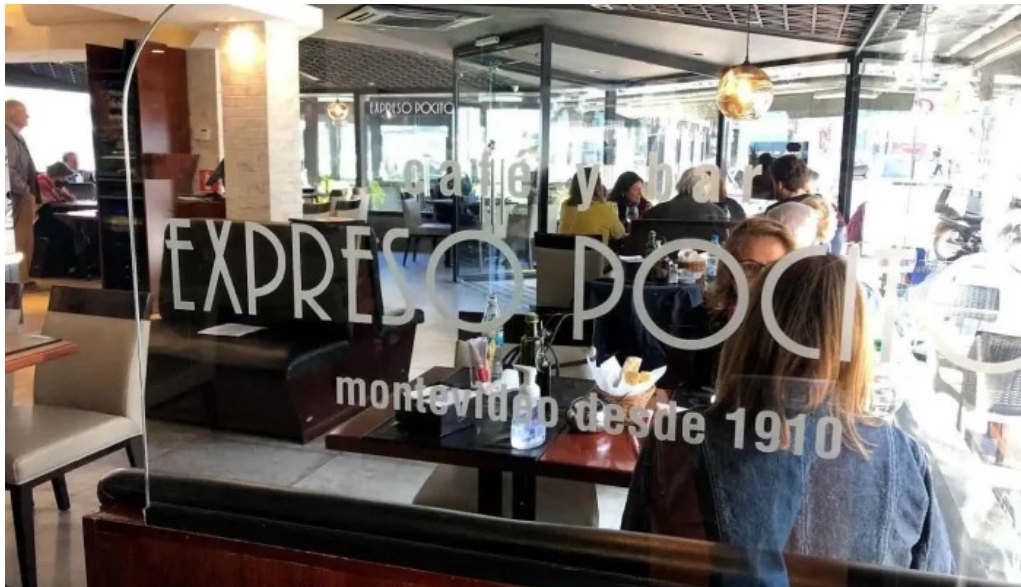
Expreso pocitos del propietario