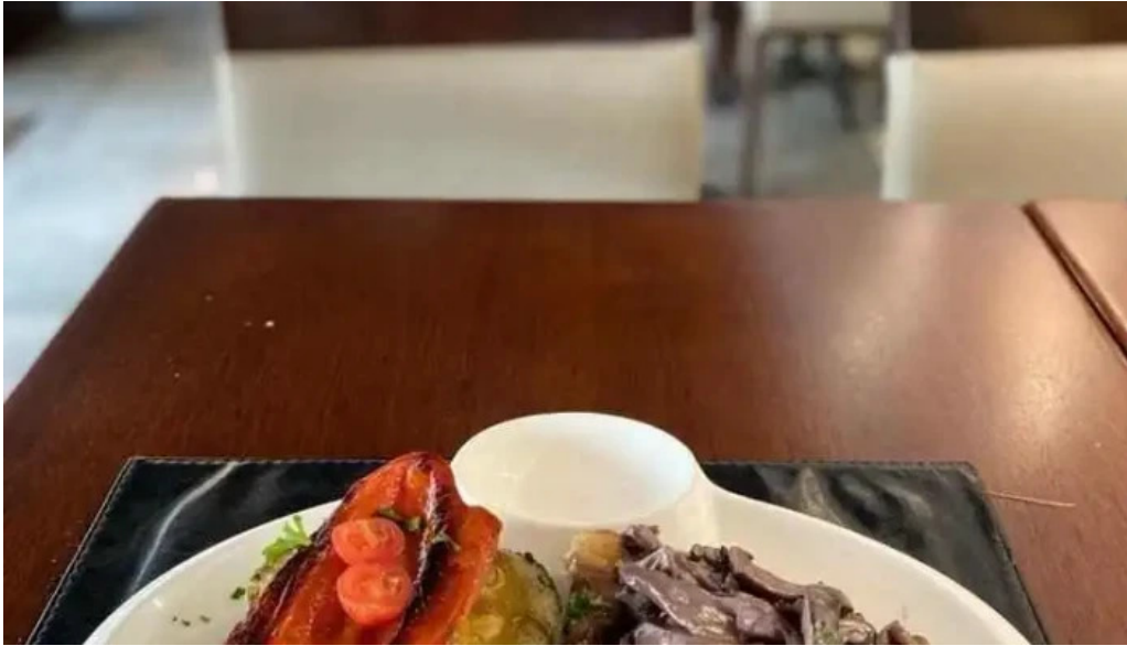
Expreso pocitos comida y bebida