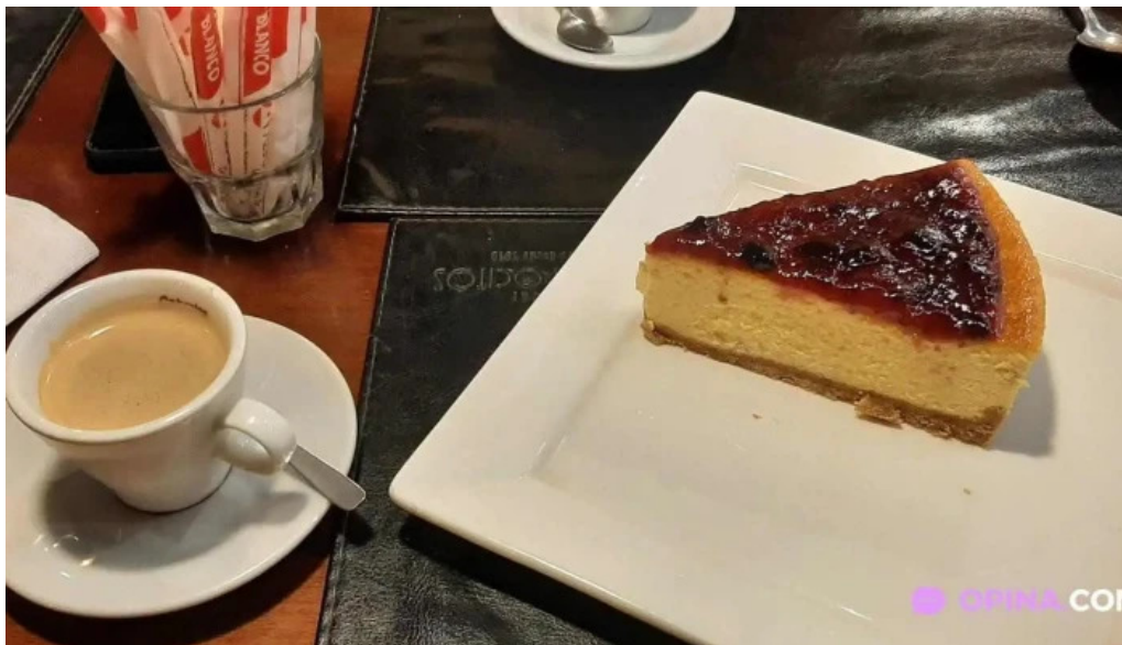
Expreso pocitos pastel de queso