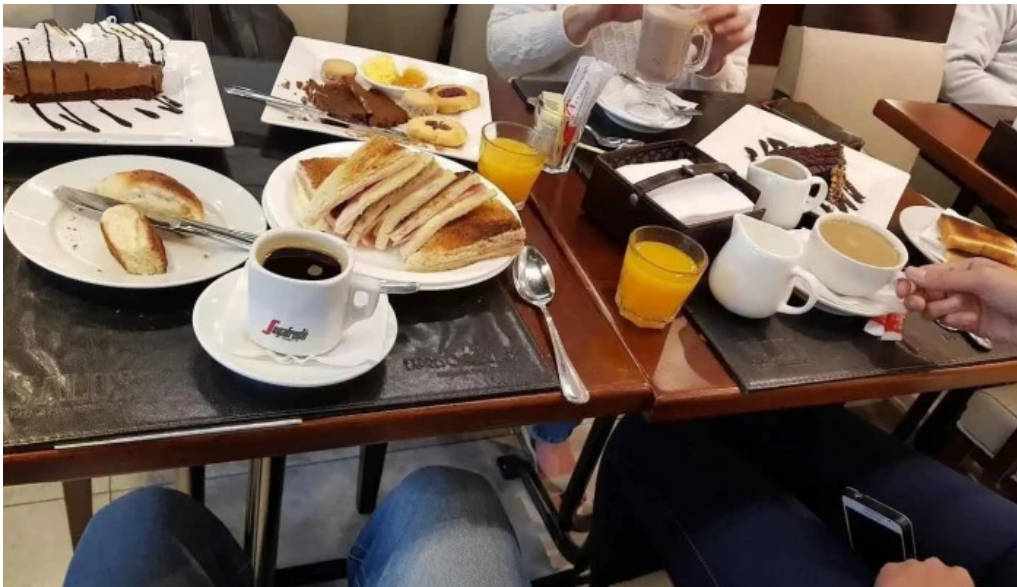
Expreso pocitos jugo