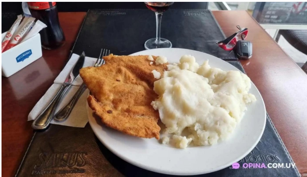
Expresso pocitos milanesa