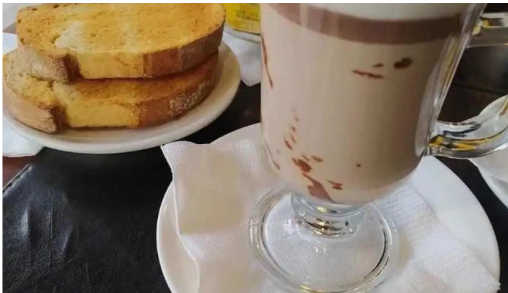
Expreso pocitos cortado