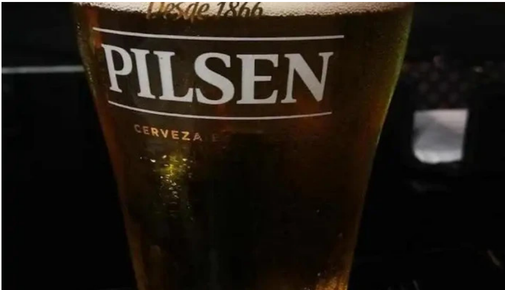
Expreso pocitos cerveza