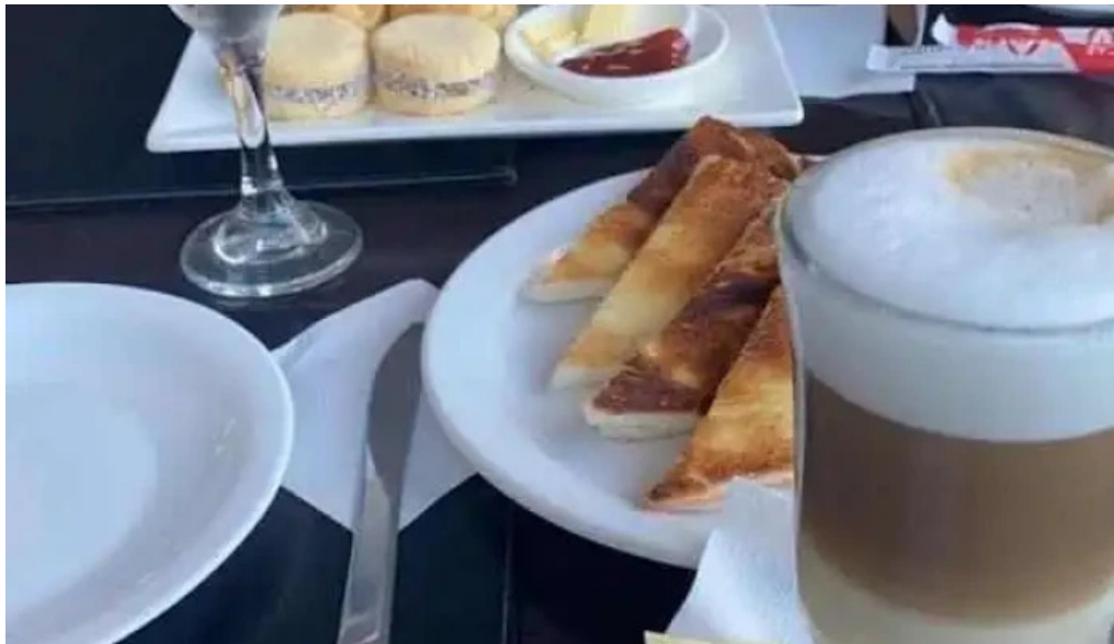
Expresso pocitos mas recientes