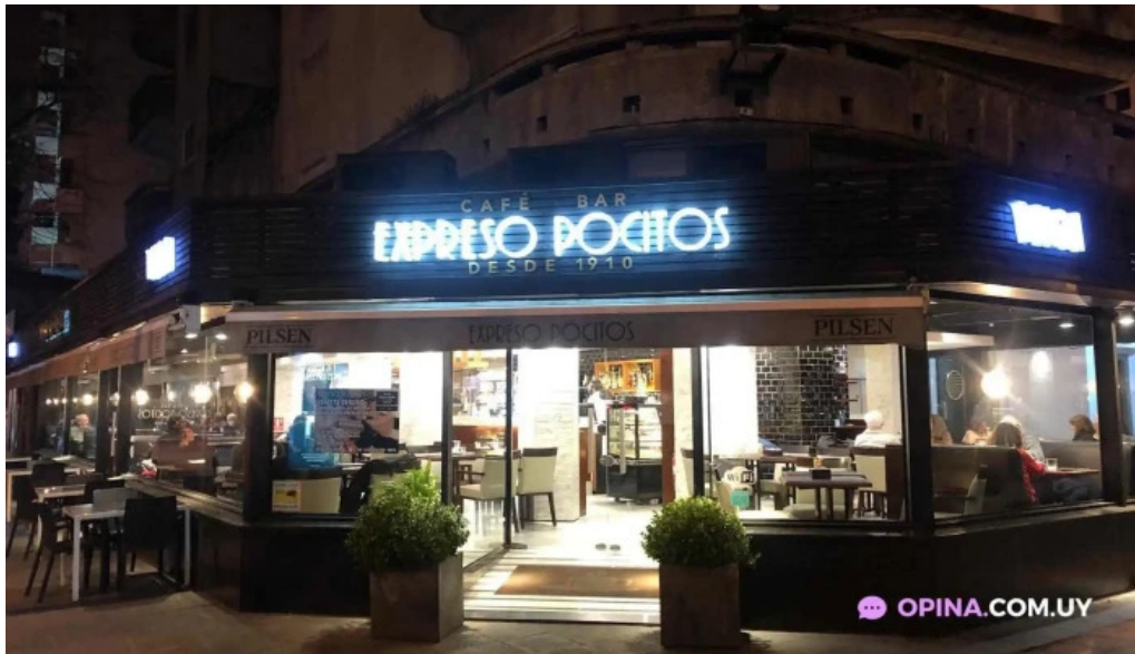
Expreso pocitos todas