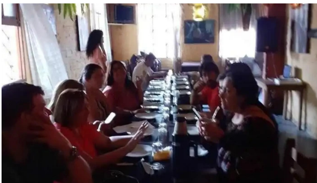
El viejo buzón ambiente