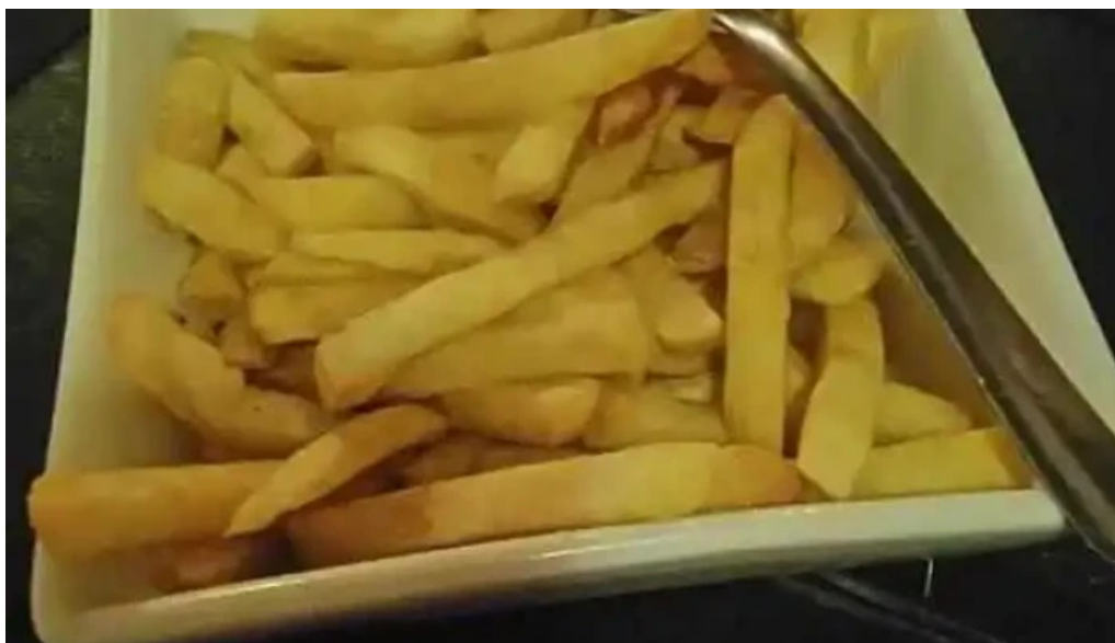
El viejo buzón comida y bebida