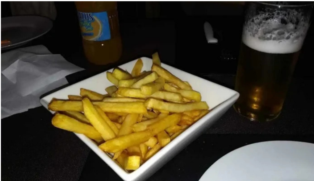
El viejo buzón montevideo