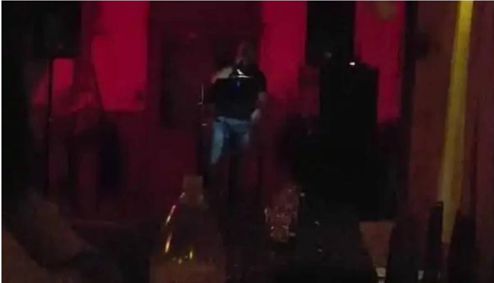
El viejo buzón videos