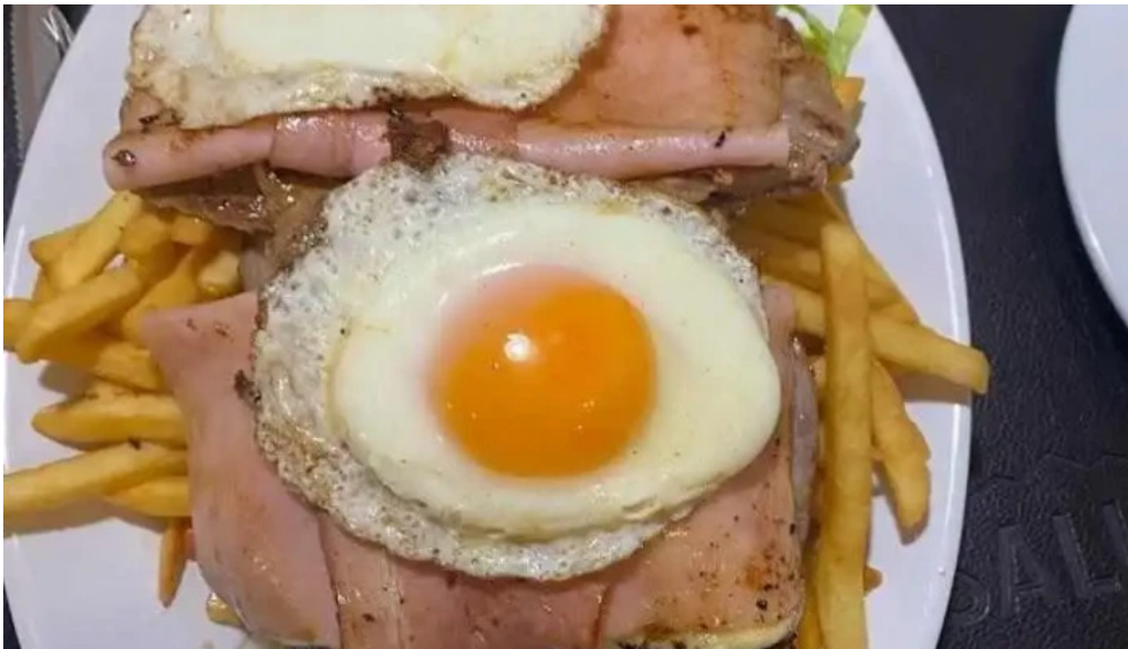
El gaucho comida y bebida