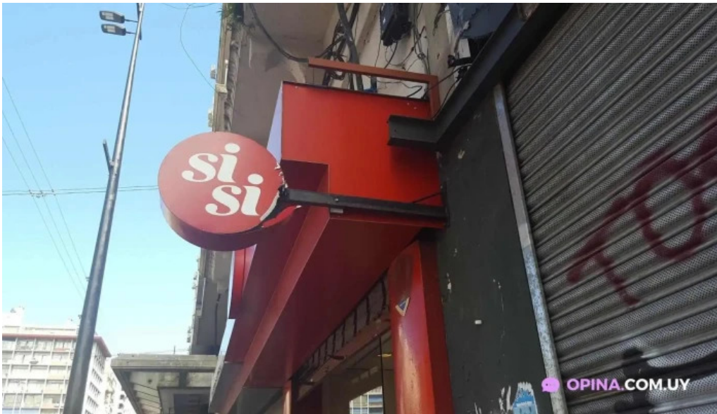
El gaucho todas