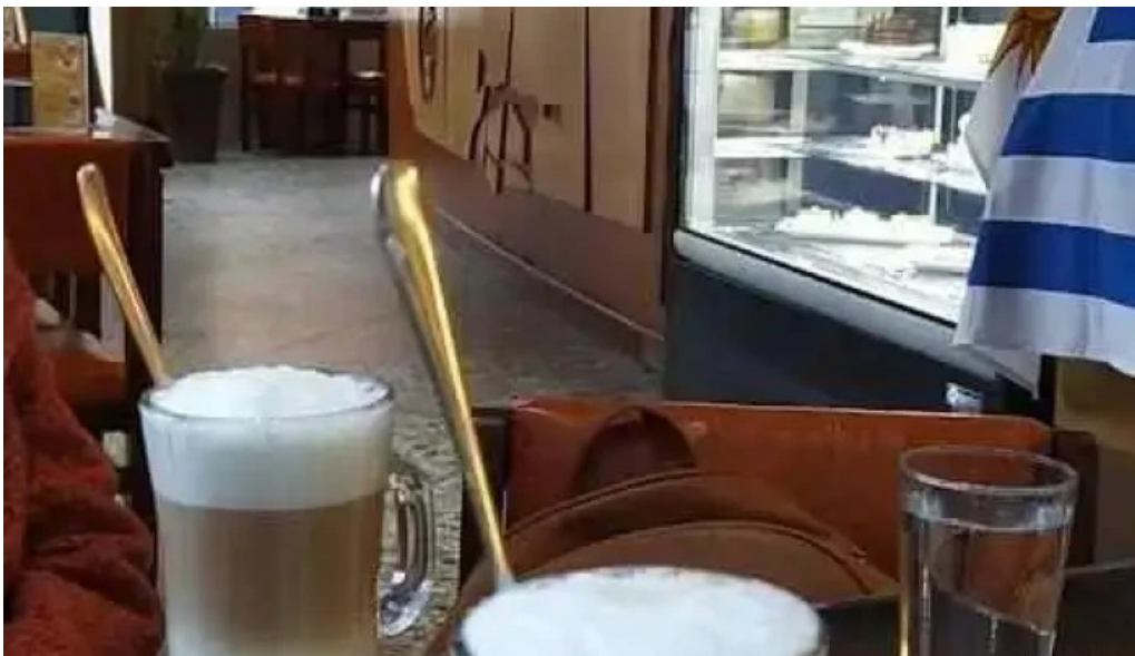
El gaucho cafe irlandés