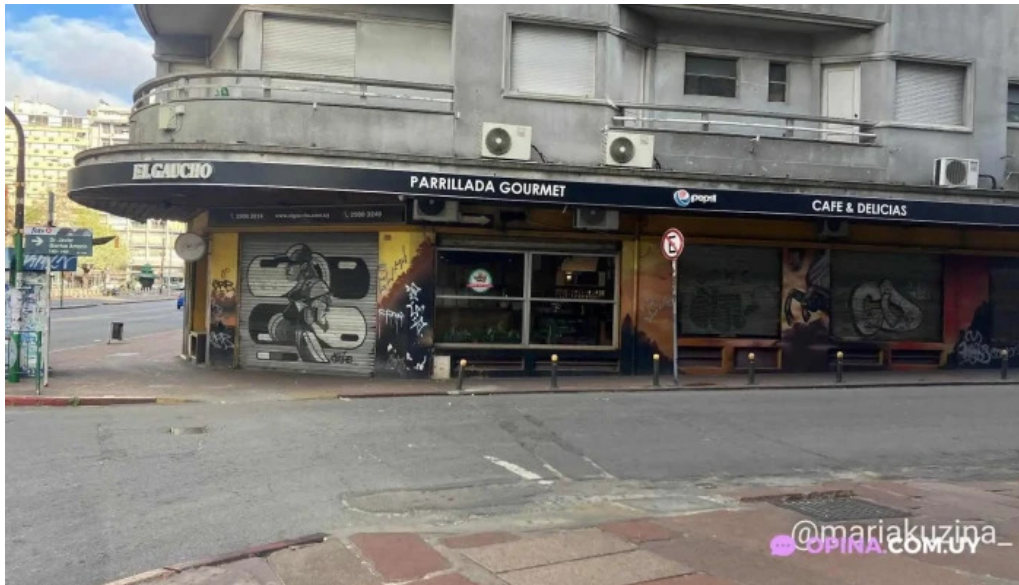
El gaucho montevideo