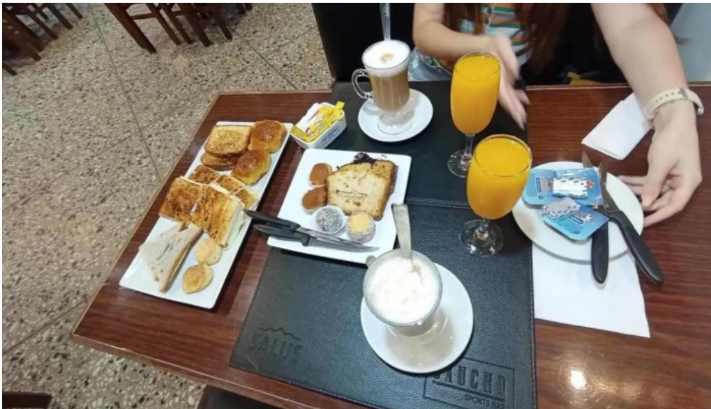
El gaucho jugo