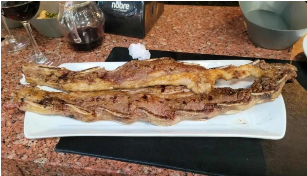
Don garcia comida y bebida