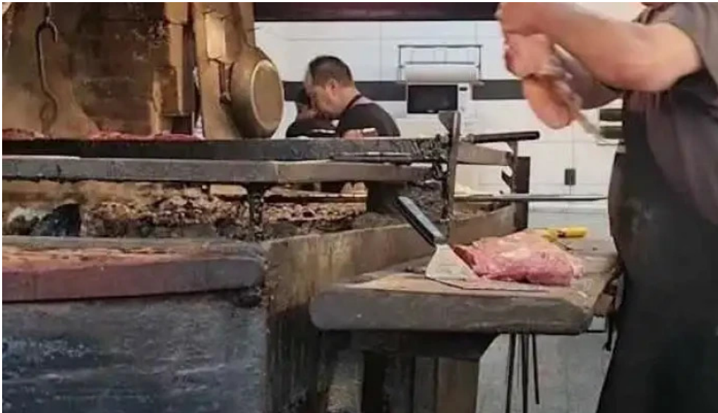
Don garcia videos