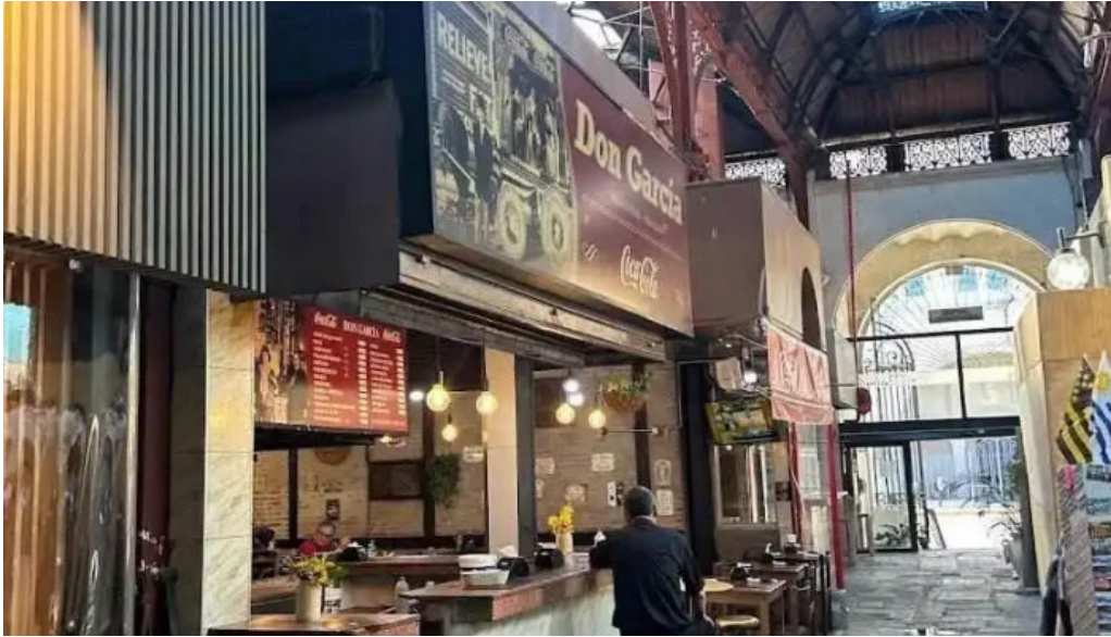
Don garcia todas