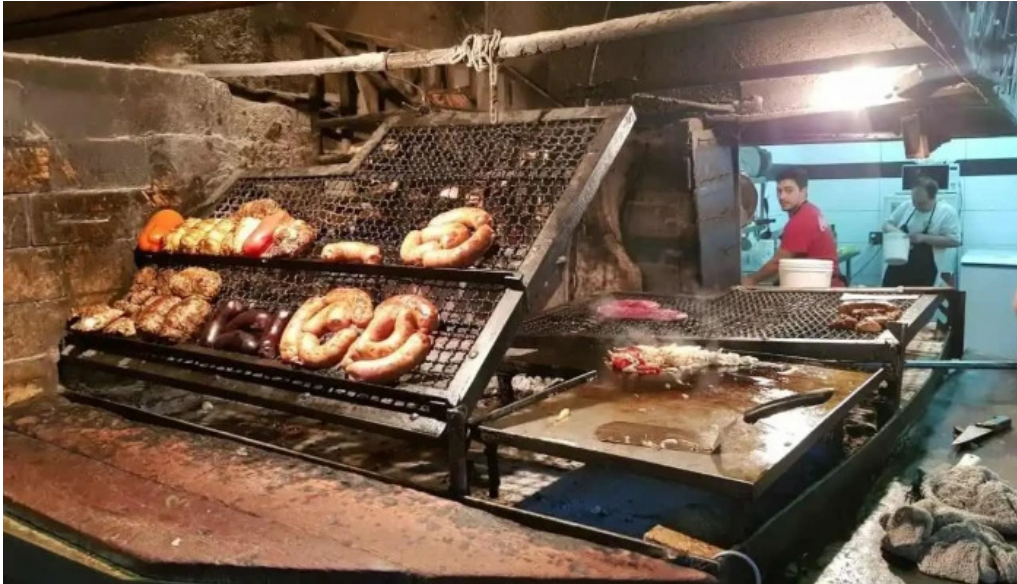
Don garcía ambiente