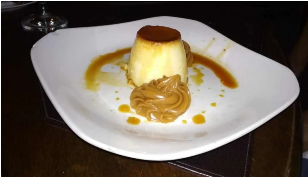
Don andres flan