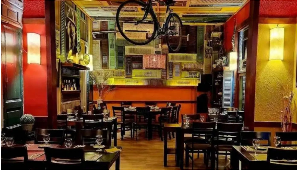
Don andres todas