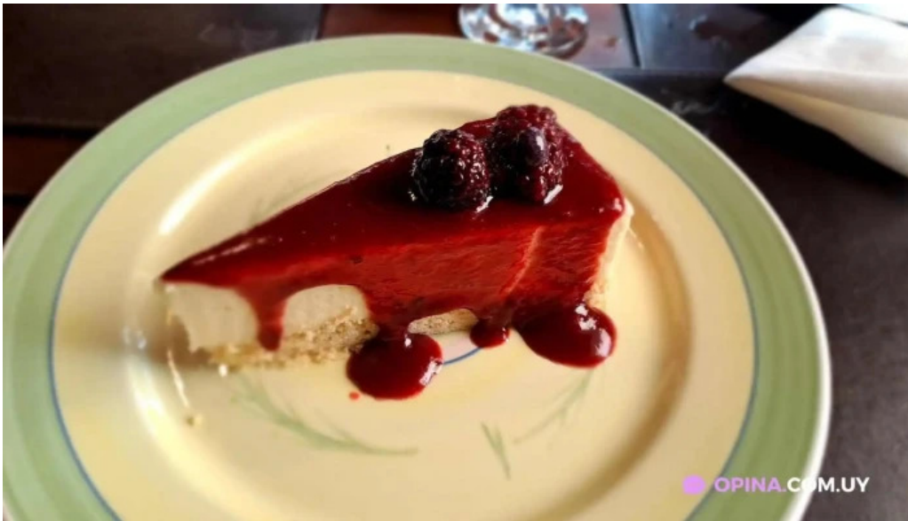
Don andres pastel de queso