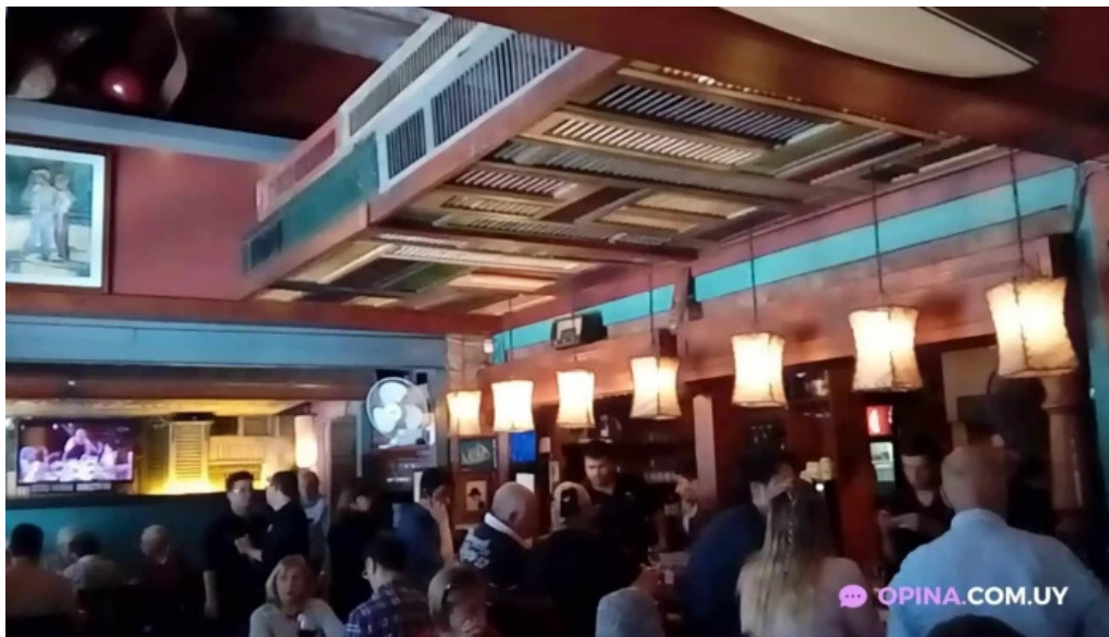
Don andres videos