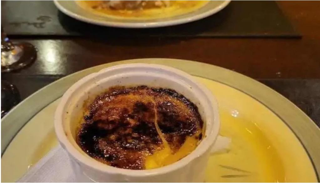
Don andres mas recientes