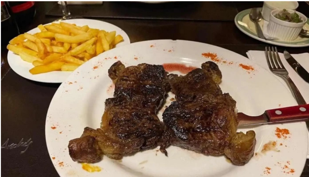
Don andres comida y bebida