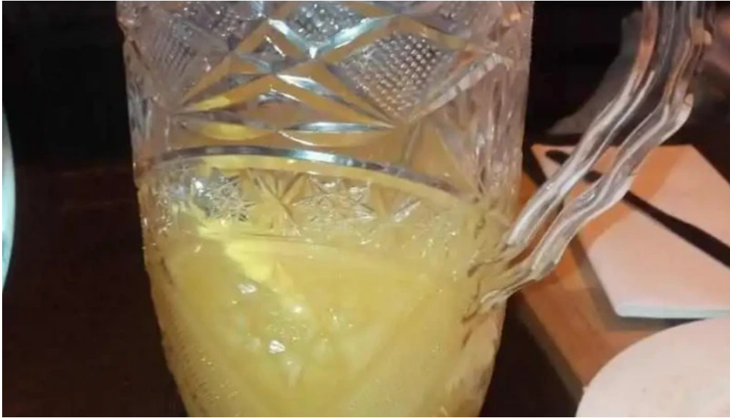
Don andres jugo