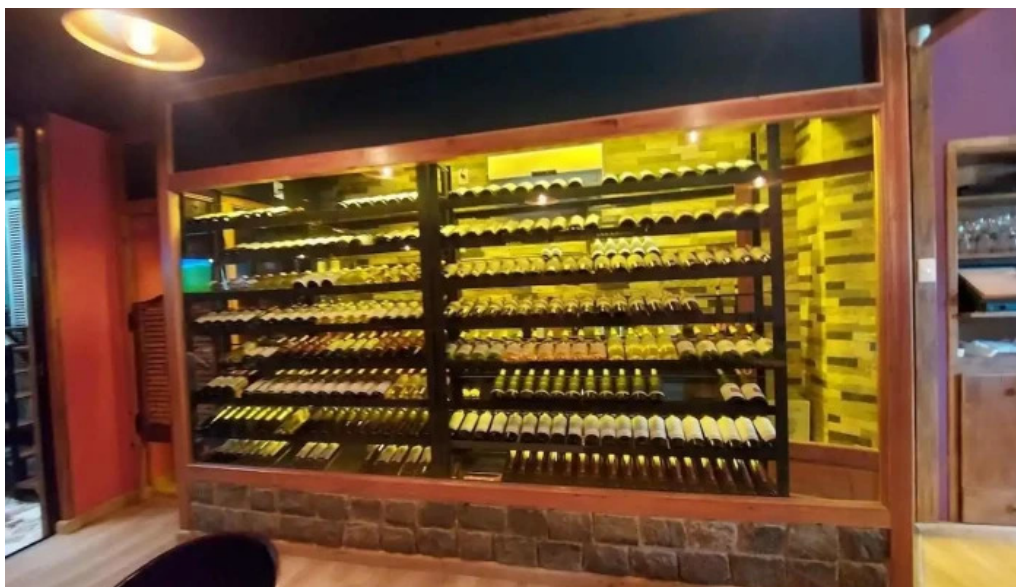
Don andres ambiente