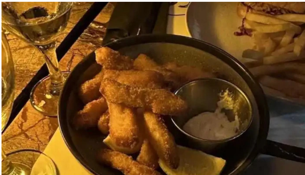
Cotidiano mas recientes