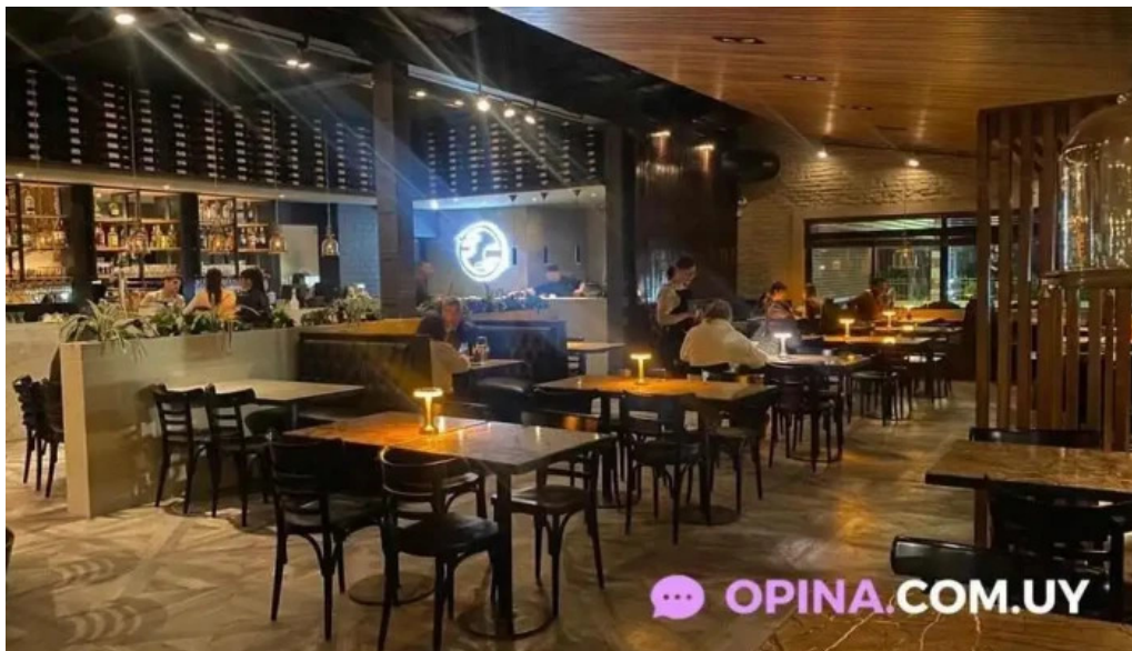
Cotidiano del propietario