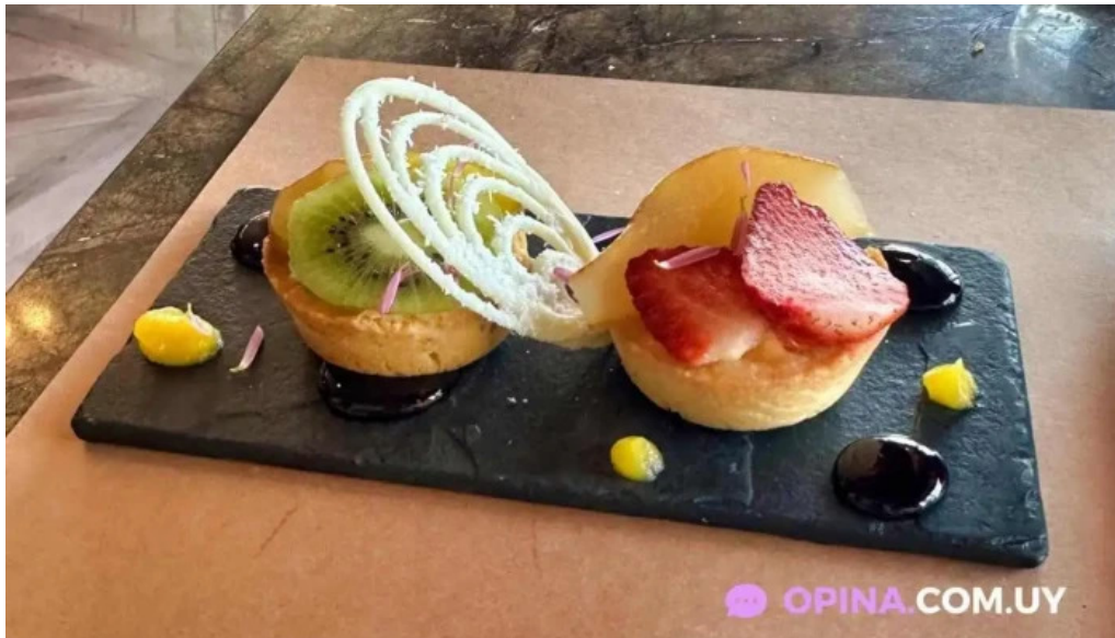
Cotidiano comida y bebida