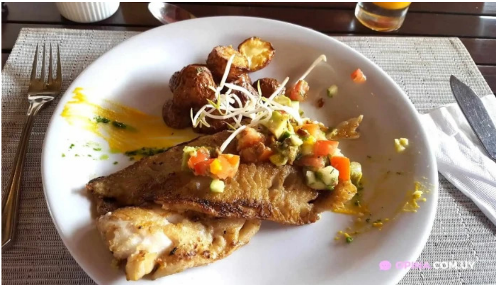
Basilico comidas y bebidas