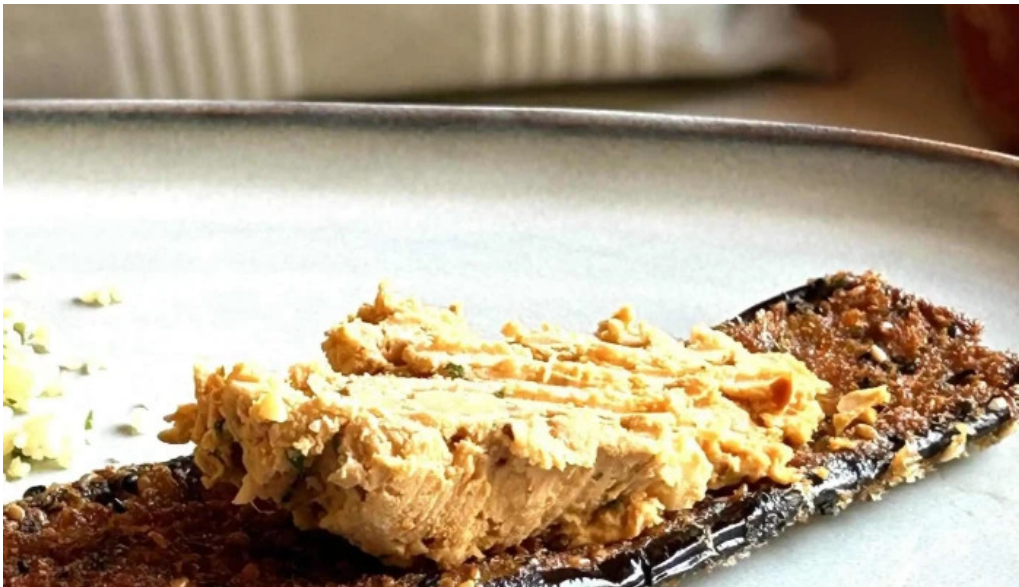
Basilico comentario 3