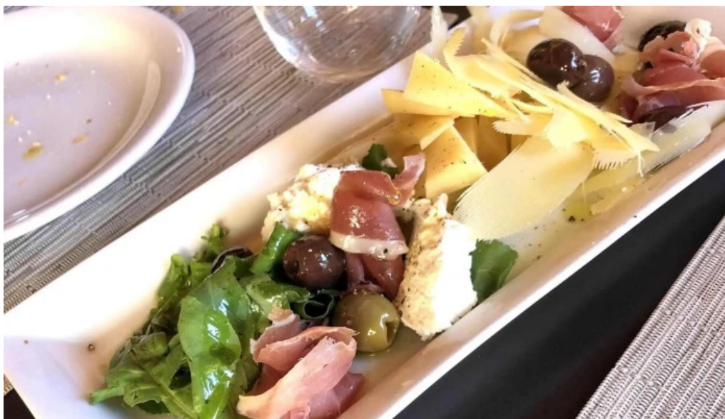
Basilico comentario 10