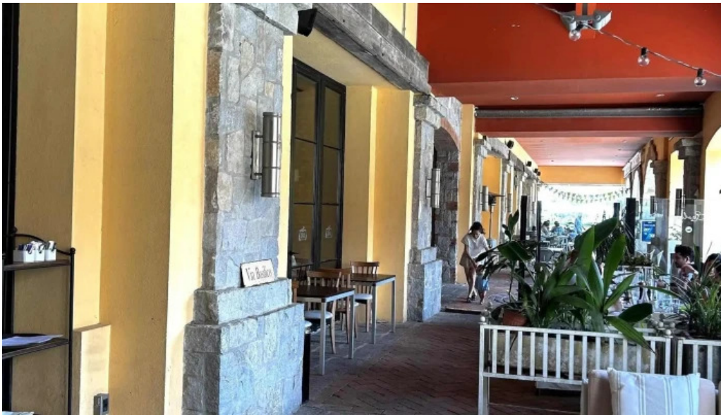
Basilico comentario 1