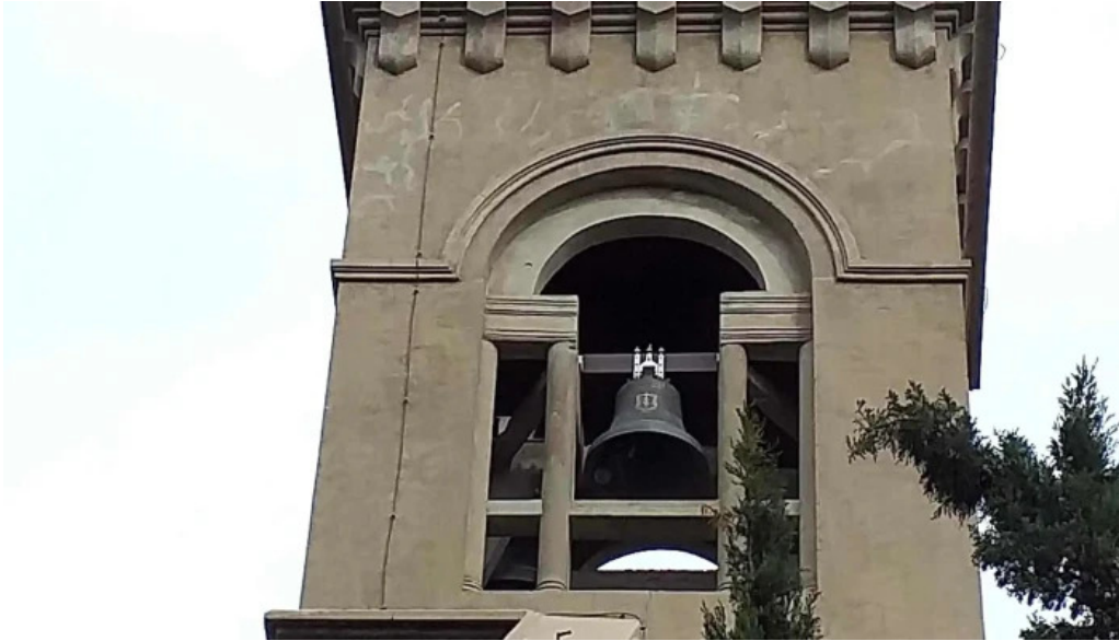
Basilico comentario 6