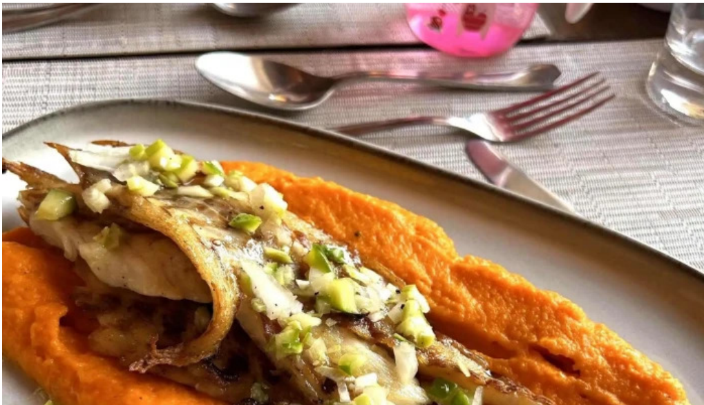
Basilico comentario 4