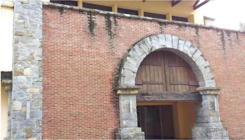
Basilico comentario 8