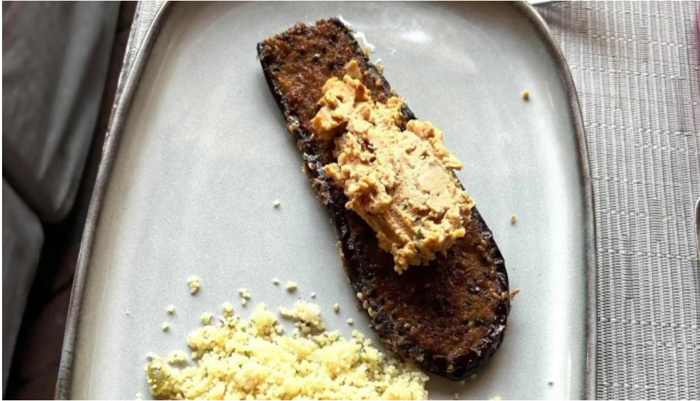
Basilico comentario 2