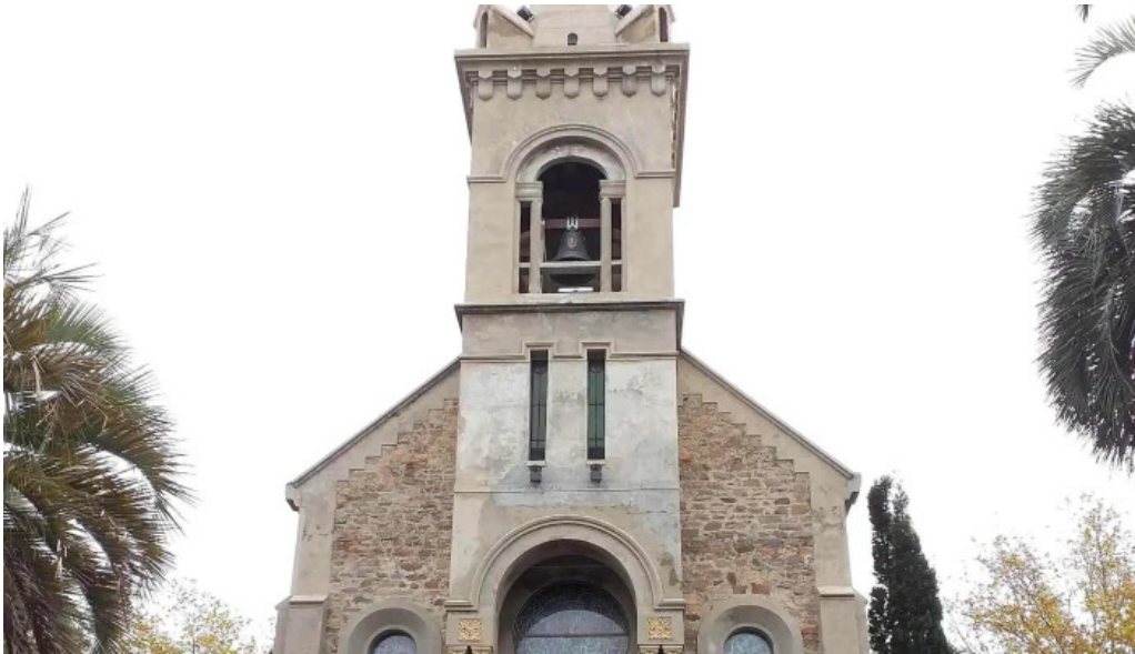
Basilico comentario 5