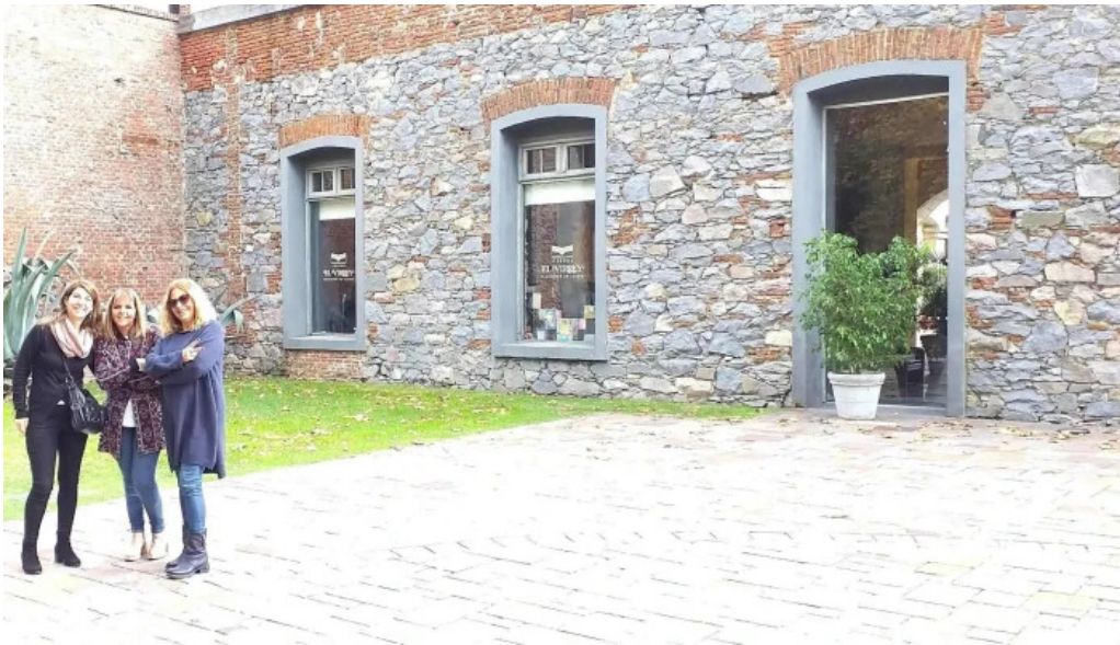
Basilico comentario 7