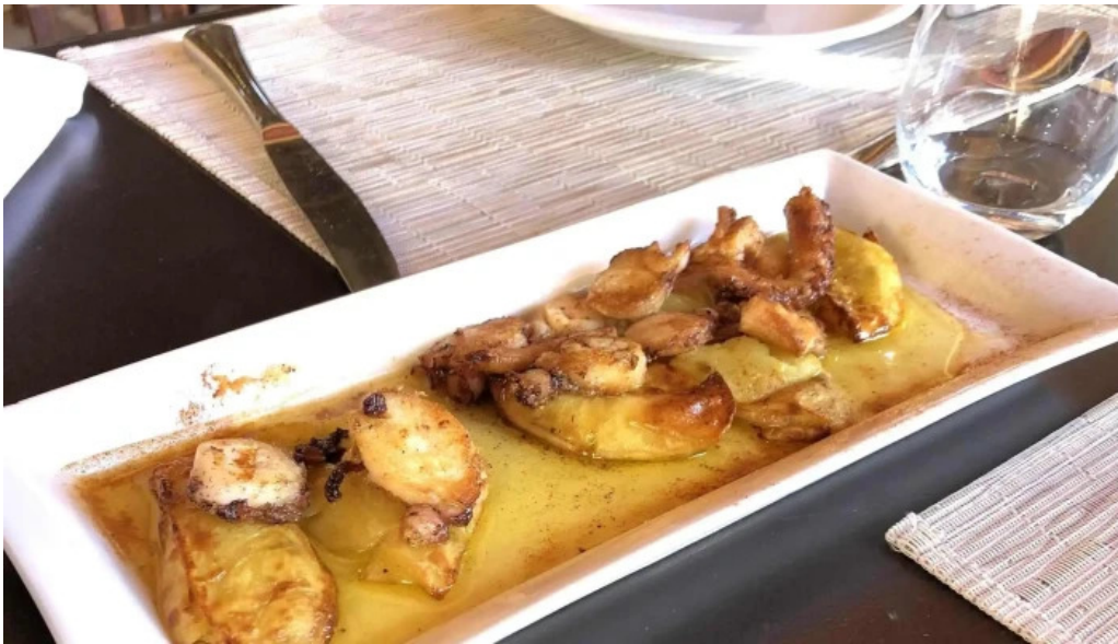
Basilico comentario 9