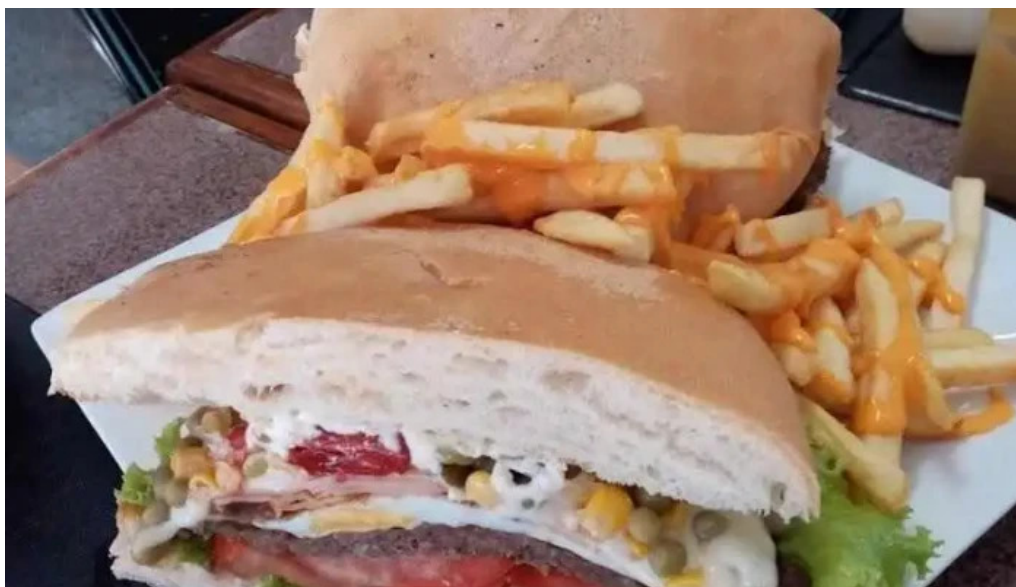
Montevideo retro comida y bebida