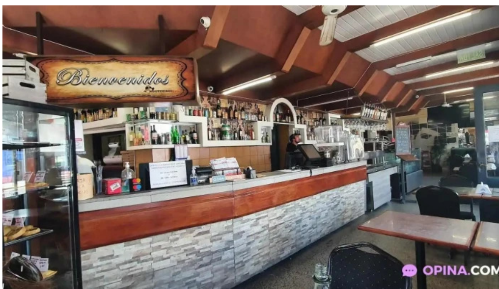
Montevideo retro ambiente