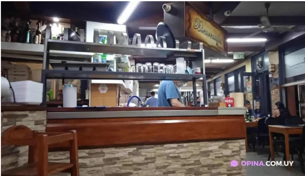
Montevideo retro todas