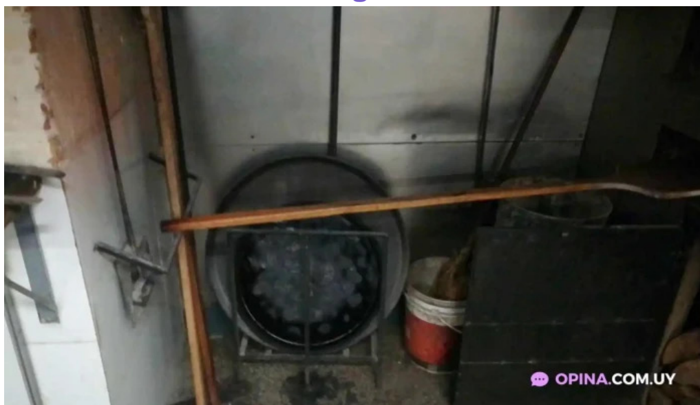
Montevideo retro videos