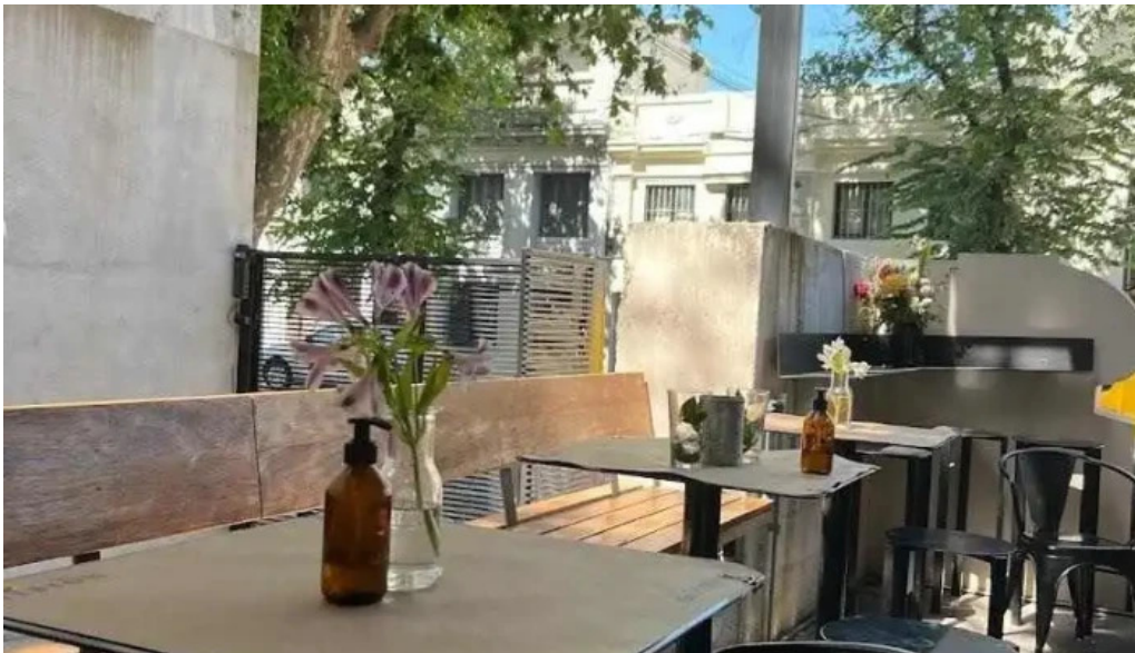
Mision comedor ambiente