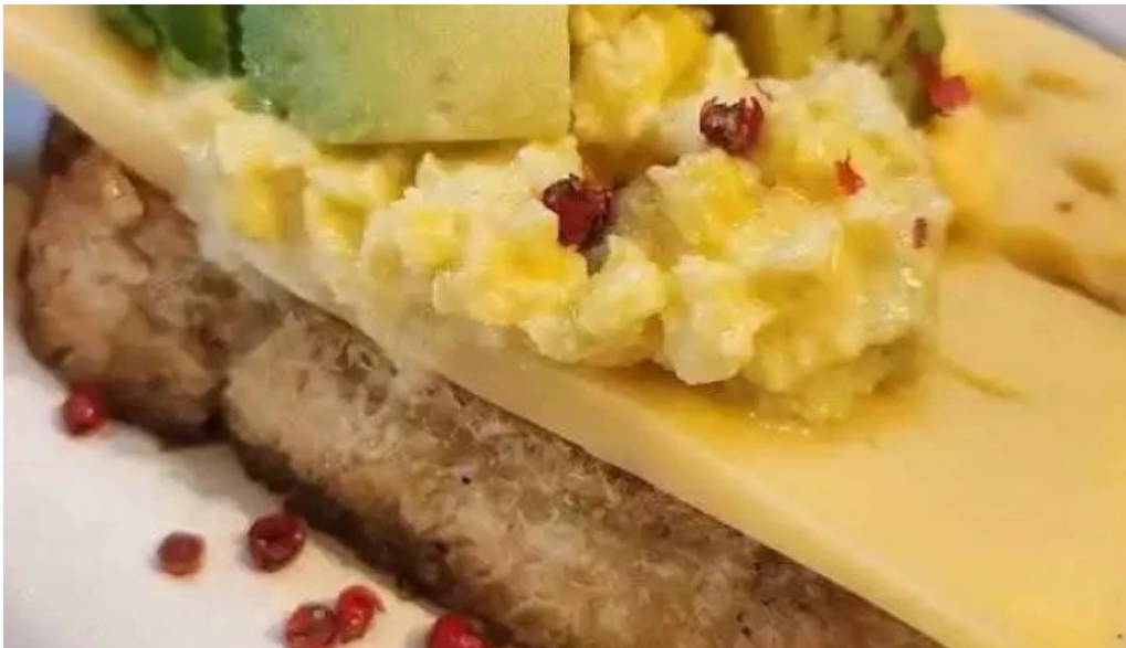
Mision comedor mas recientes