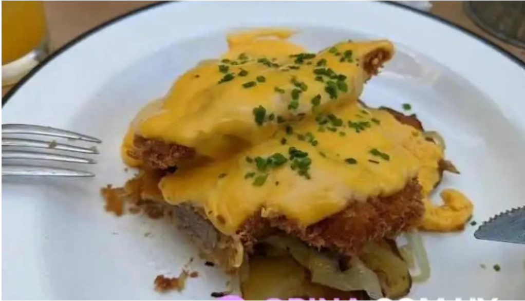
Mision comedor huevos benedict