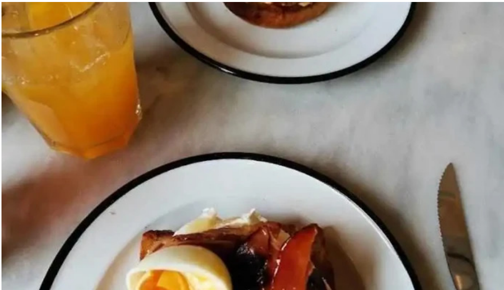
Mision comedor comida y bebida