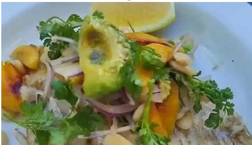
Mision comedor videos