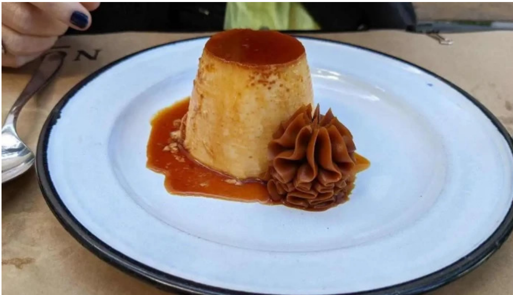
Mision comedor flan