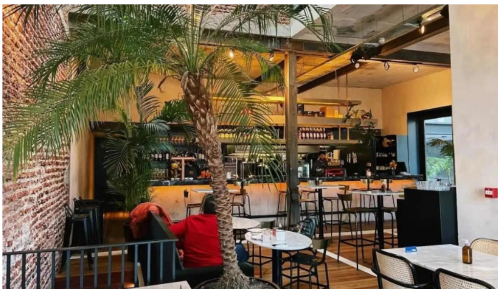
Mision comedor todas