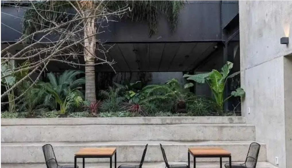
Mision comedor monteideo