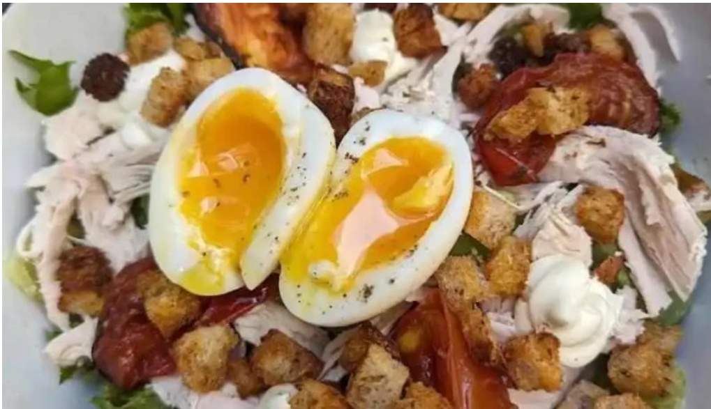
Mision comedor ensalada cesar