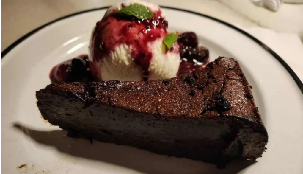
Mision comedor brownie