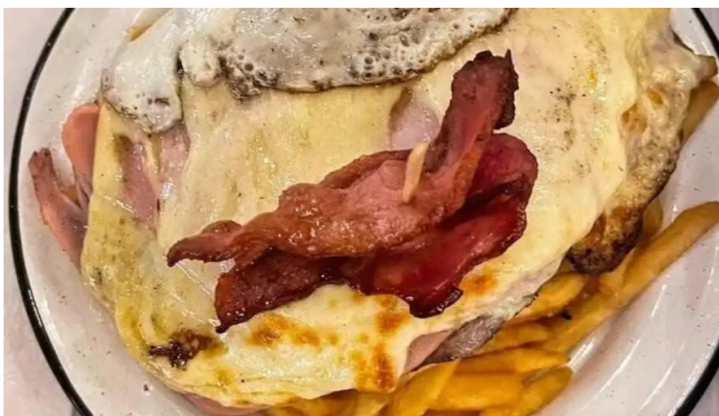
Mil milas comida y bebida