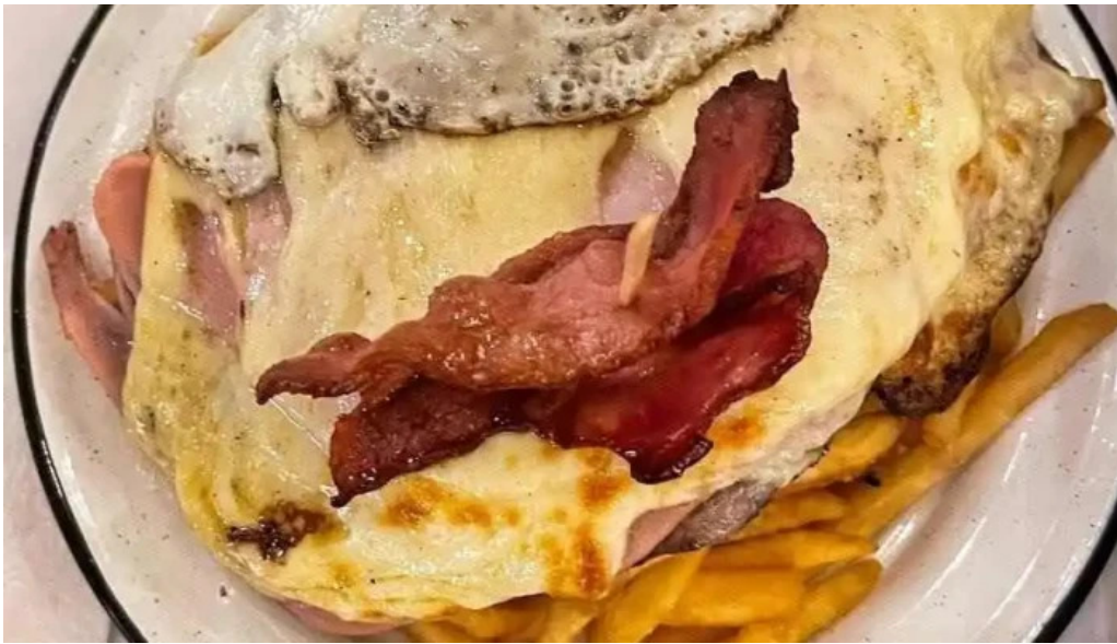
Mil milas todas