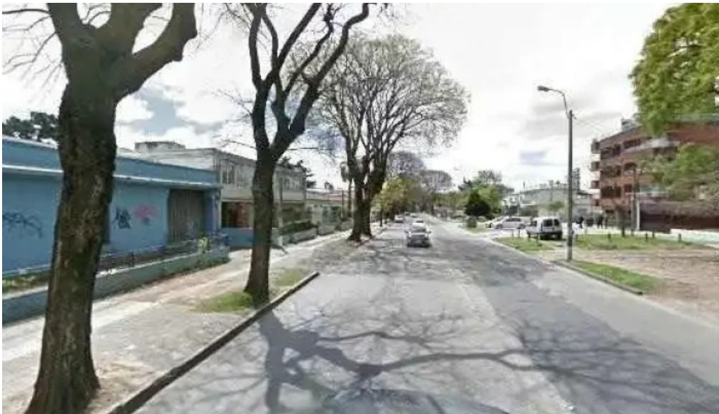
Mil milas street view y 360