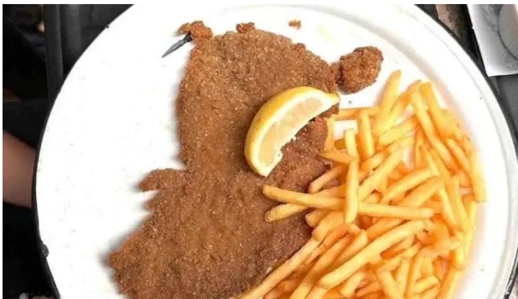
Mil milas comida y bebida