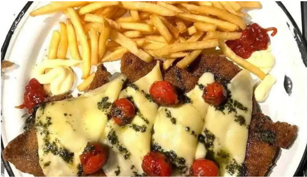
Mil milas todas