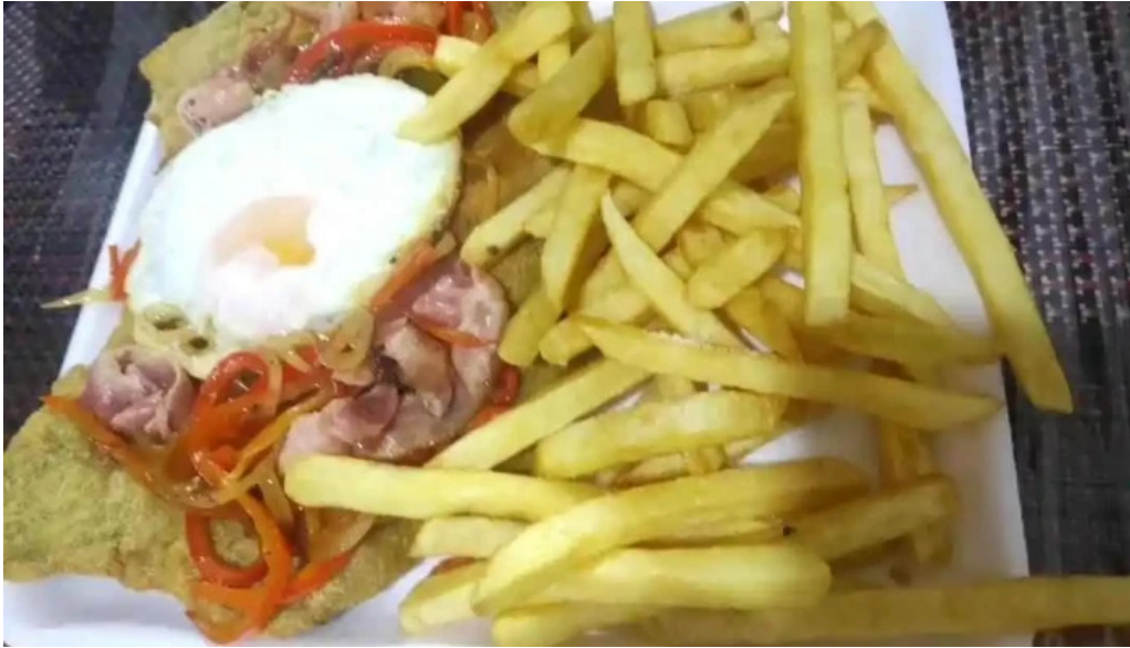
Mil delicias comidas al paso papas fritas