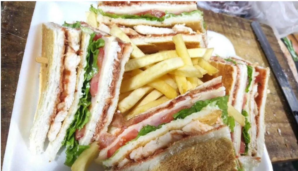
Mil delicias comidas al paso del propietario