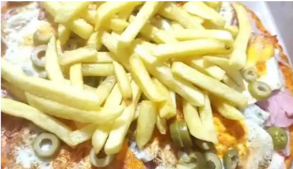
Mil delicias comidas al paso paso de los toros