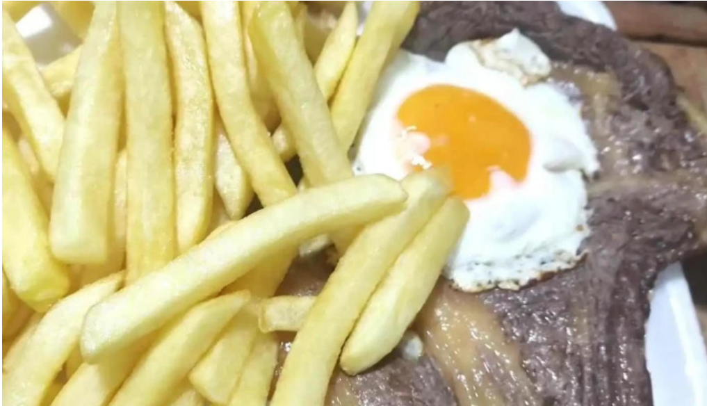
Mil delicias comidas al paso comidas y bebidas