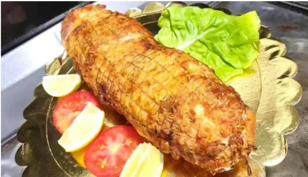
Mil delicias comidas al paso menu