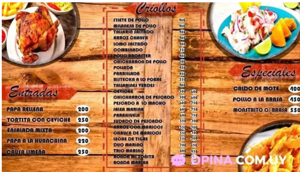
Mi tonita resto bar menu