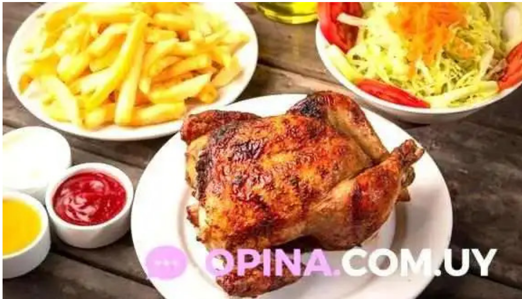
Mi tonita resto bar papas fritas