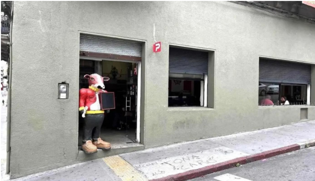
Mi tonita resto bar todas