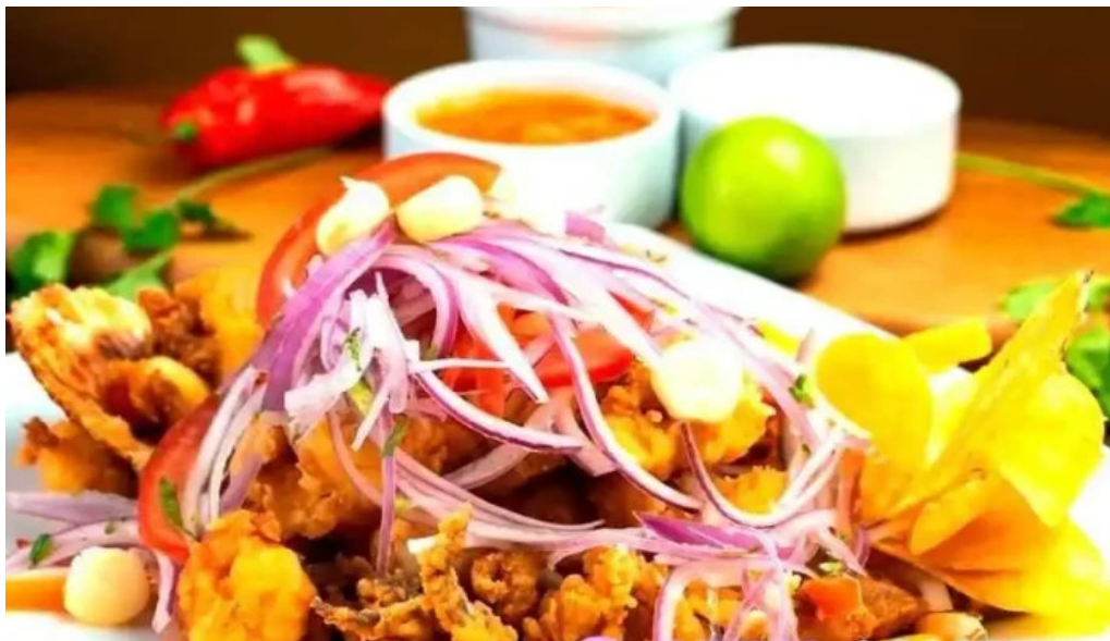
Mi tonita resto bar comida y bebida