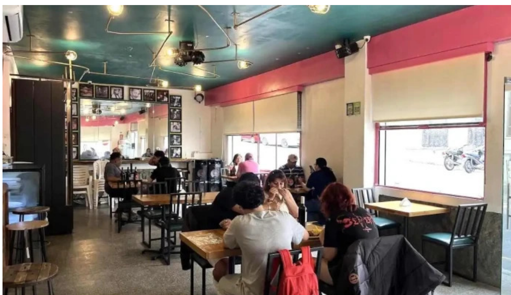
Mi tonita resto bar ambiente