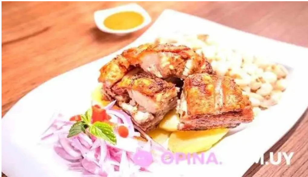
Mi tonita resto bar del propietario