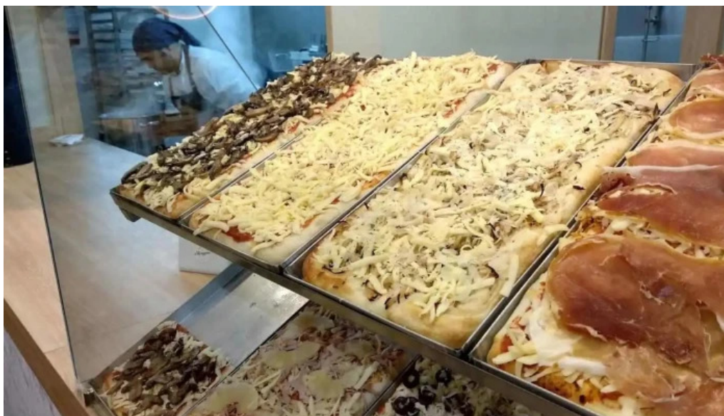
Meriggare pastas pizzas e pane comida y bebida