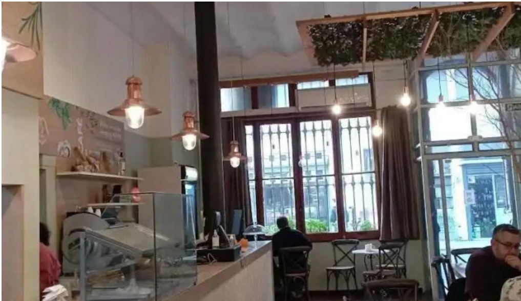
Merigiare pastas pizzas e pane todas