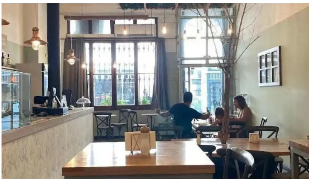
Meriggare pastas pizzas e pane ambiente