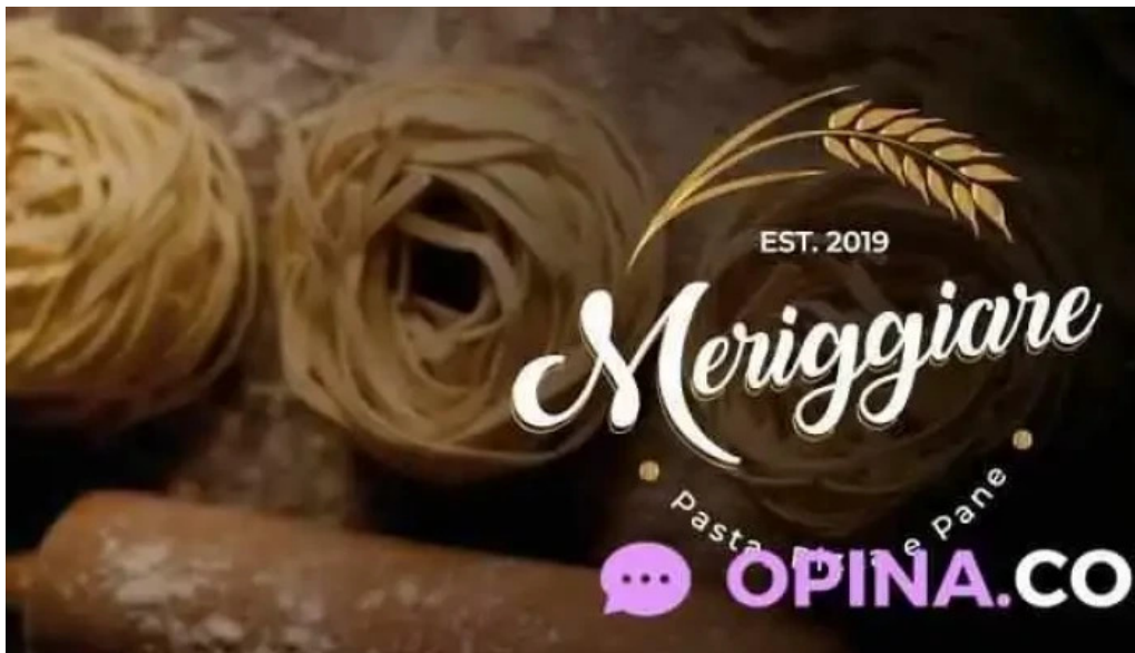
Meriggiaire pastas pizzas e pane del proprietario