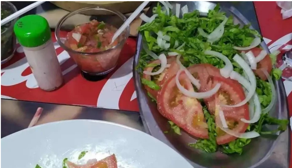
Parrillada san cono comida y bebida