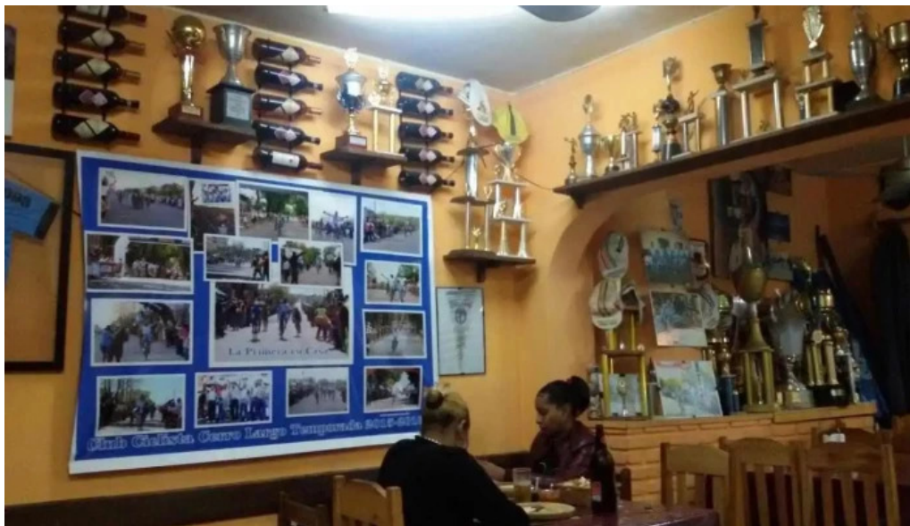
Parrillada san cono melo