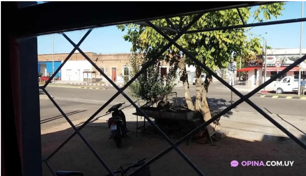
Parrillada san cono videos