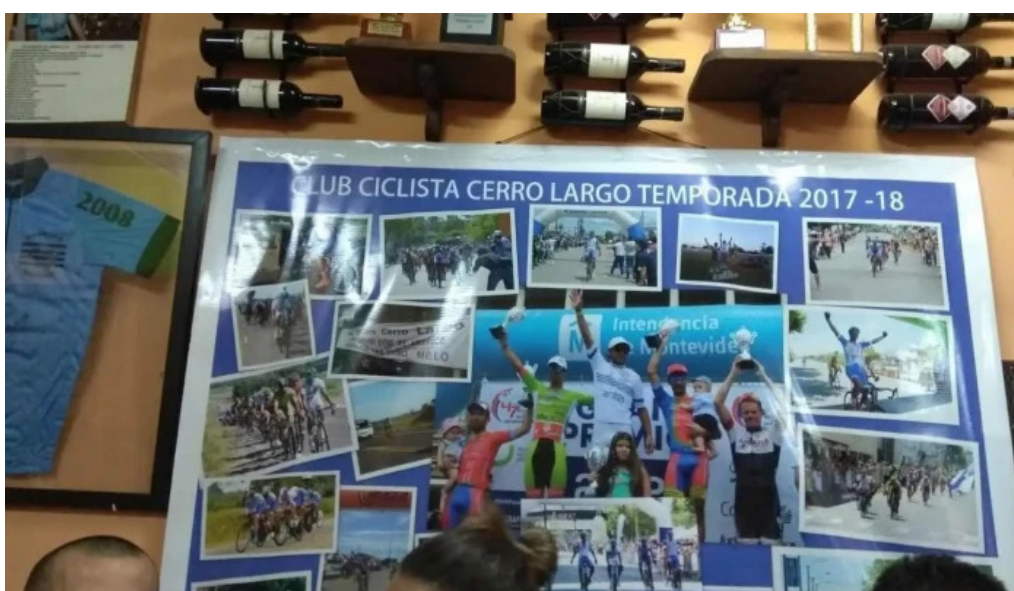
Parrillada san cono ambiente