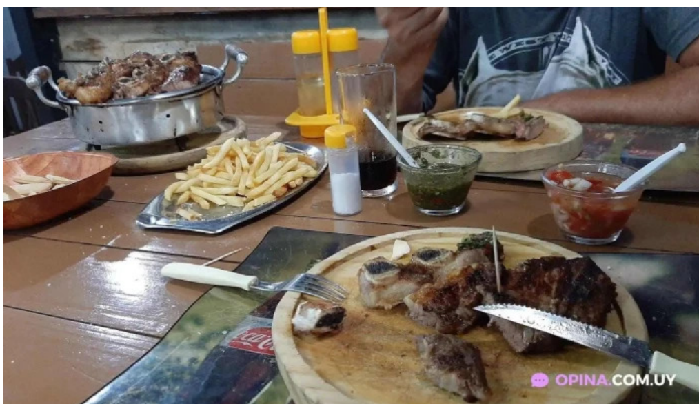
Parrillada san cono churrasco