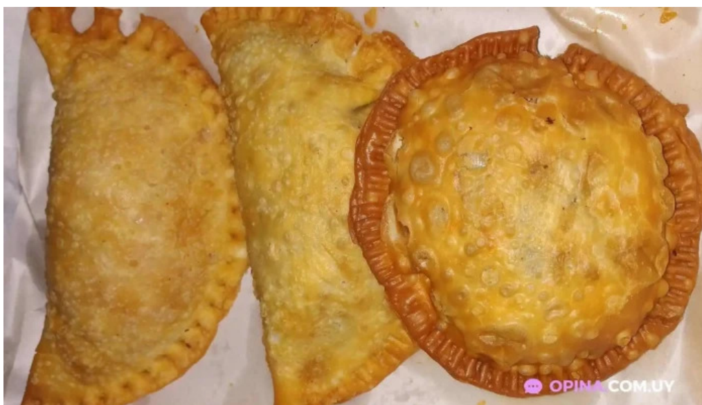
Mc lucas empanadas comida y bebida