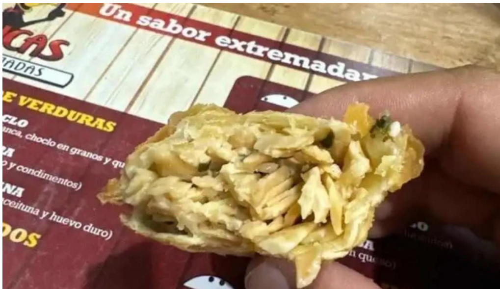
Mc lucas empanadas menu