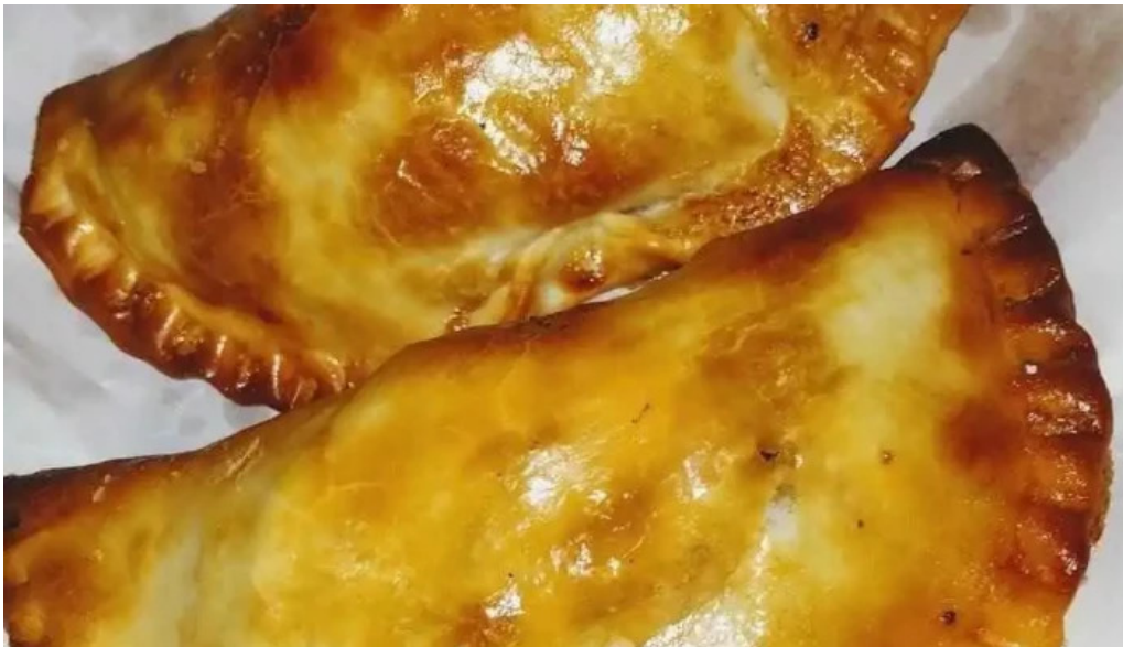
Mc lucas empanadas todas