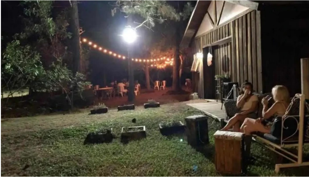
Marieta del propietario