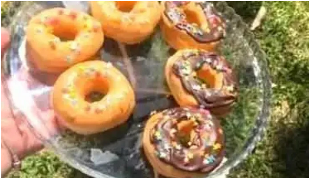
Marieta comida y bebida