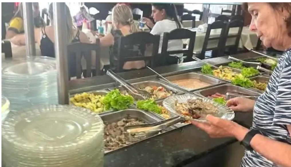
Mar del plata ambiente