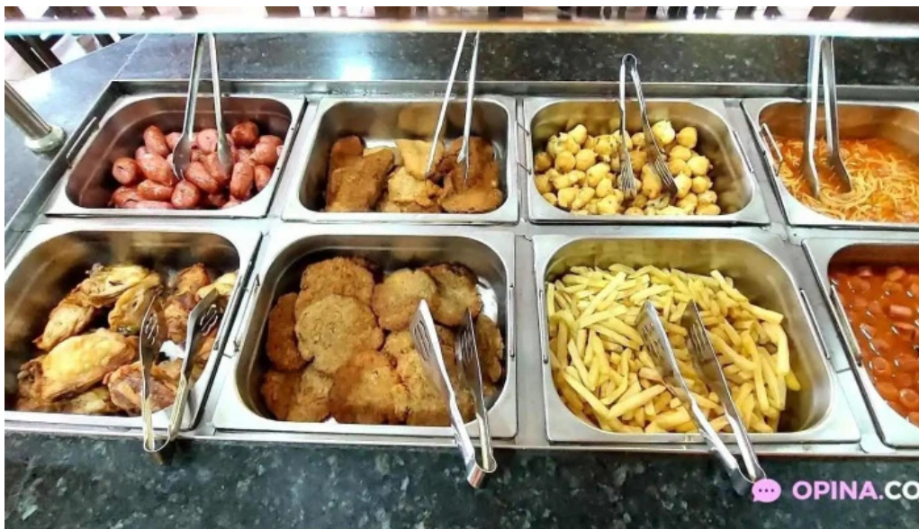
Mar del plata del propietario