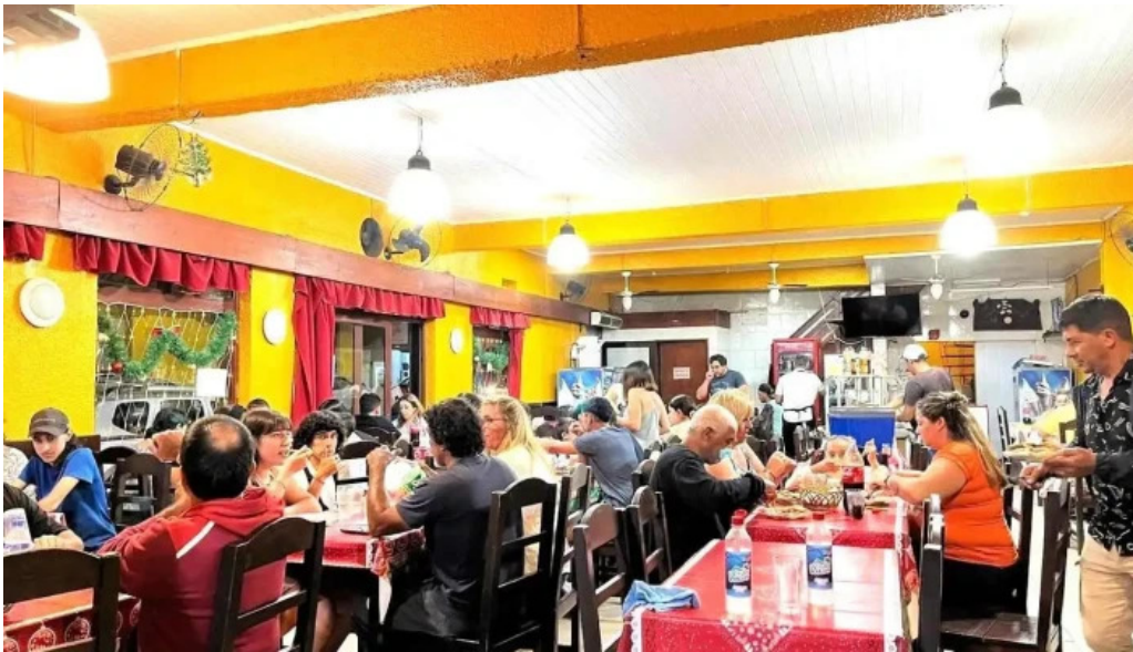
Mar del plata chui