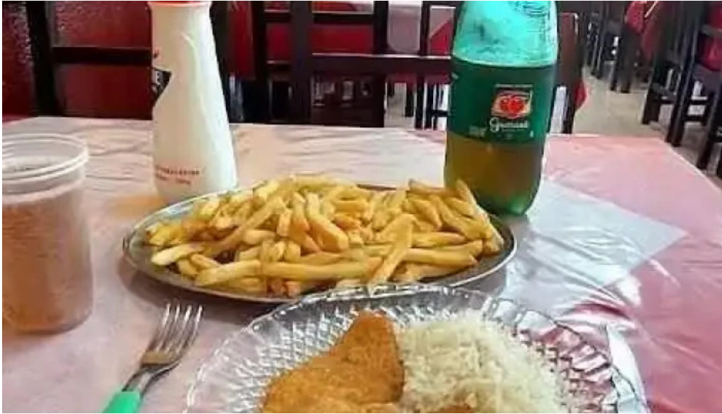
Mar del plata comida y bebida