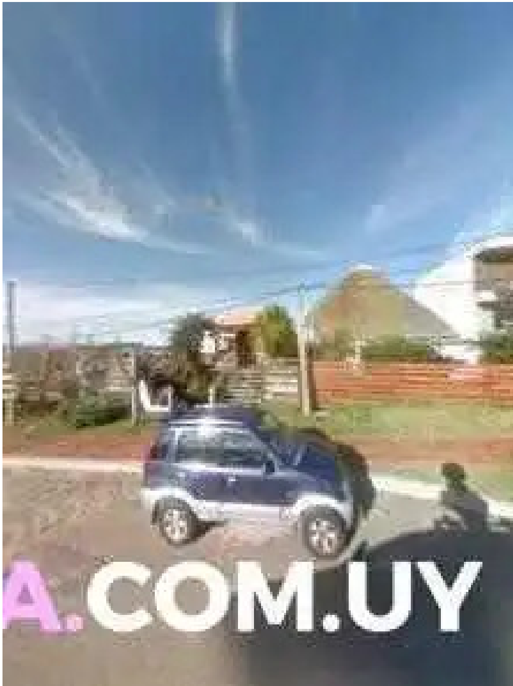
El fondin de manantiales street view y 360