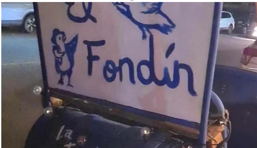
El fondin de manantiales videos