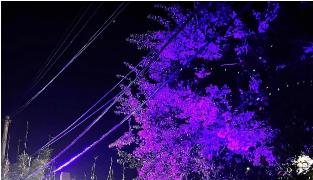
El fondin de manantiales comentario 6