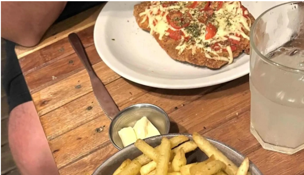
El fondin de manantiales comentario 5