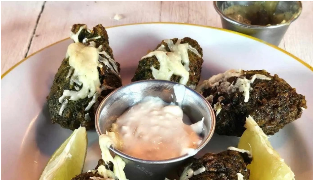
El fondin de manantiales comentario 3