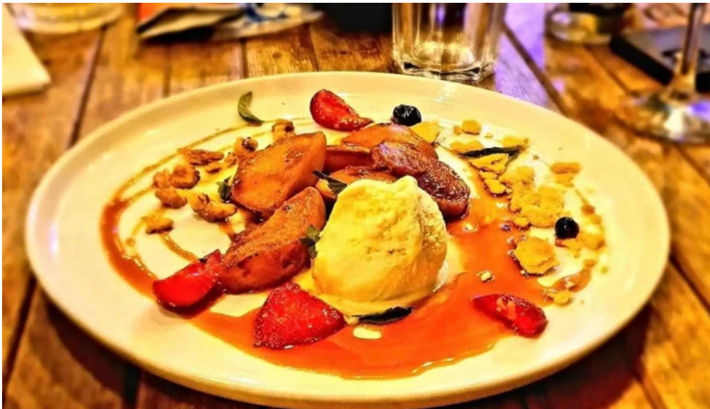
El fondin de manantiales comidas y bebidas