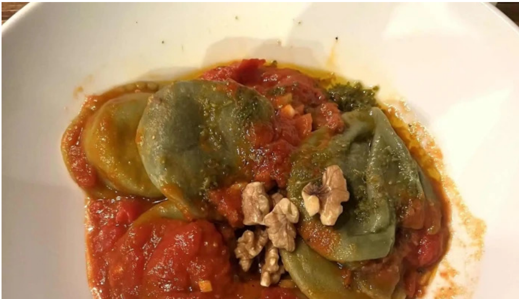
El fondin de manantiales comentario 4