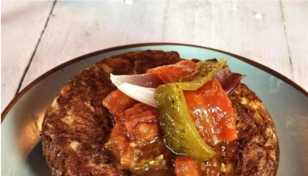
El fondin de manantiales comentario 1