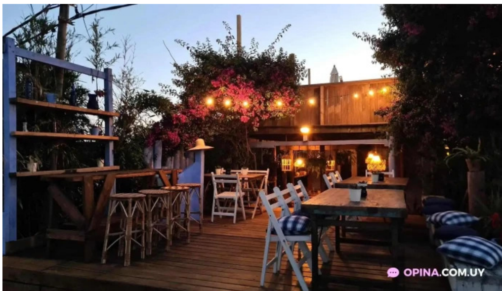
El fondin de manantiales todo