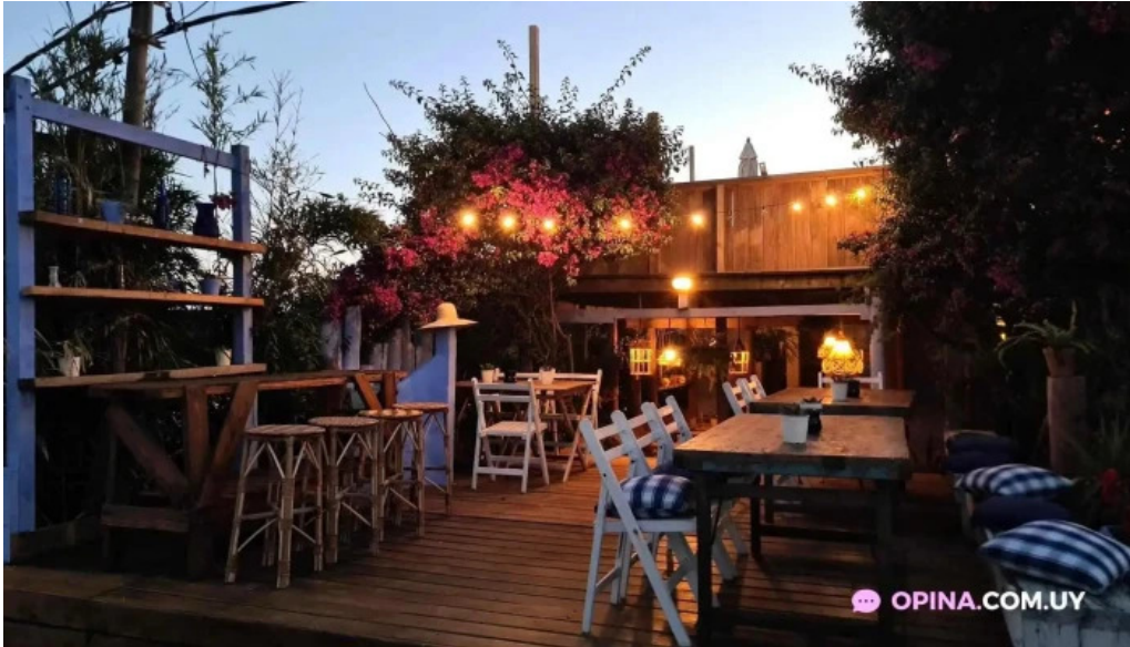
El fondin de manantiales manantiales