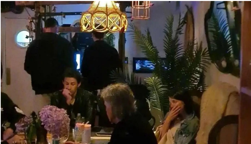
El fondin de manantiales ambiente