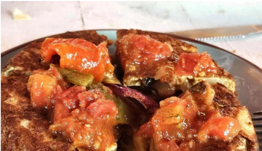
El fondin de manantiales comentario 2