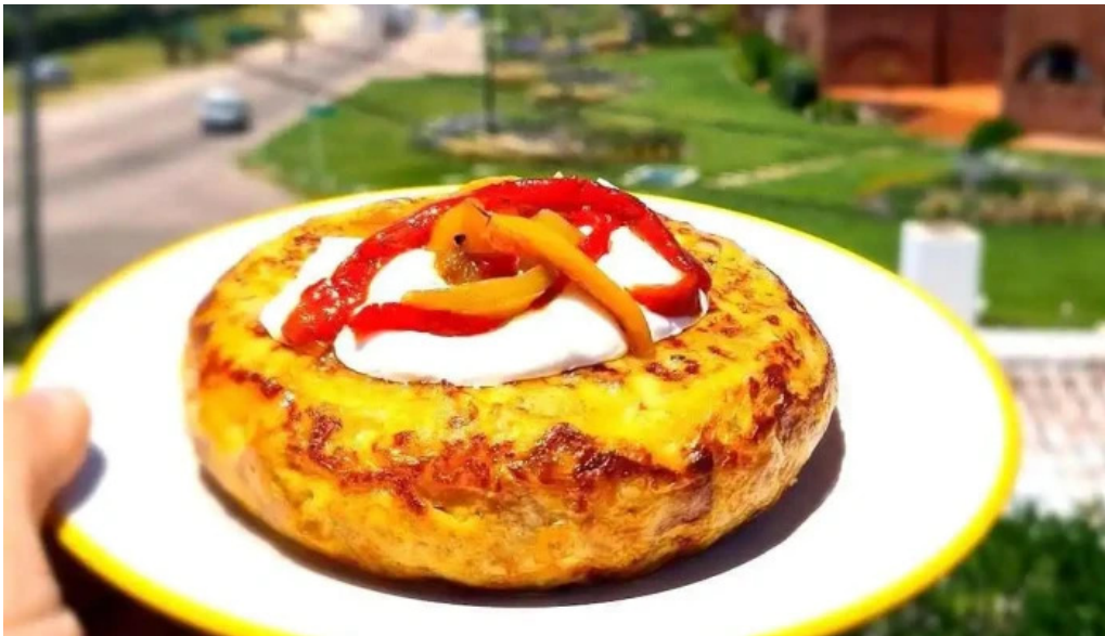
El fondin de manantiales del propietario