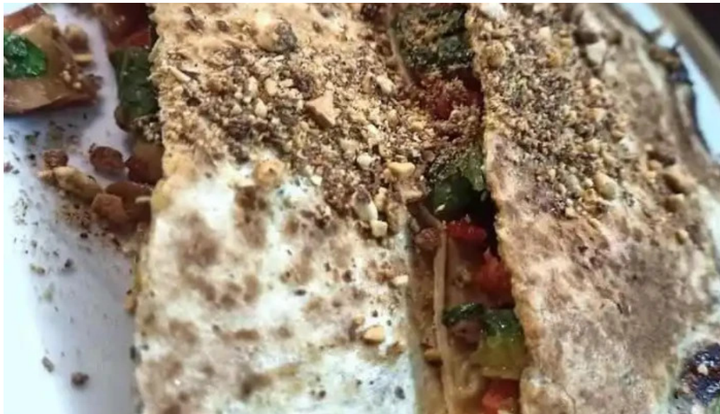
Ikigai cocina vegetariana del propietario