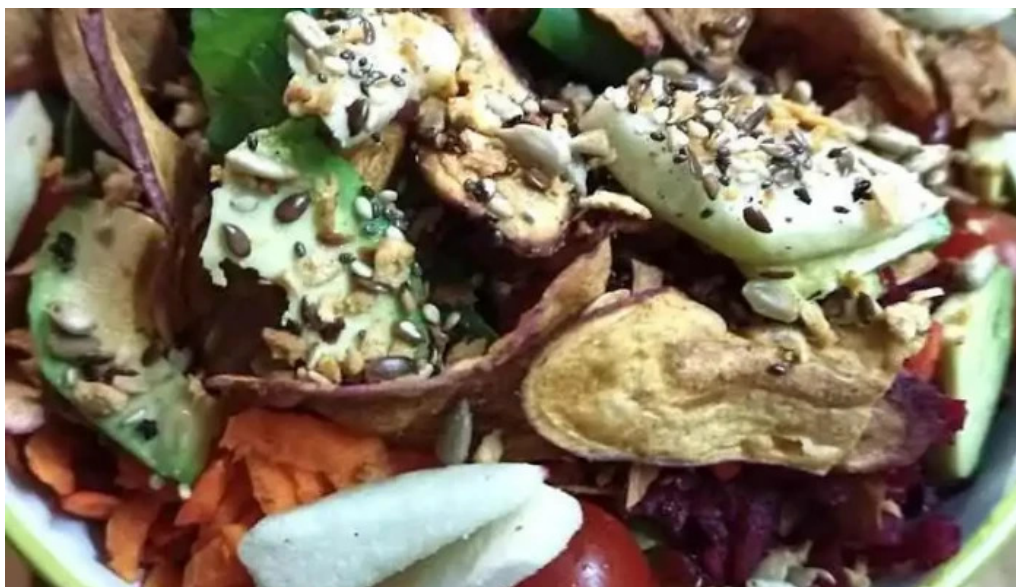
Ikigai cocina vegetariana comida y bebida