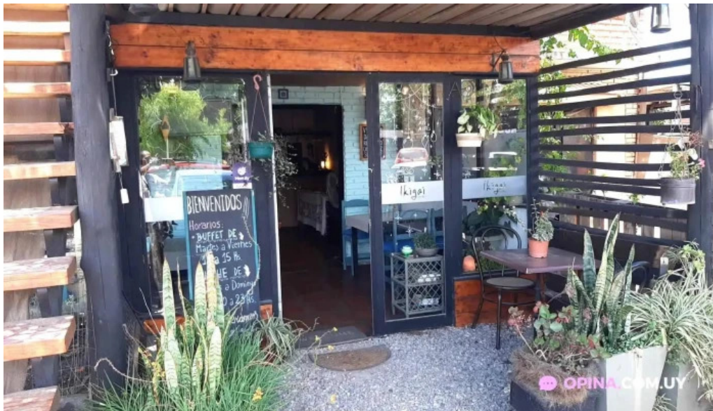
Ikigai cocina vegetariana todas