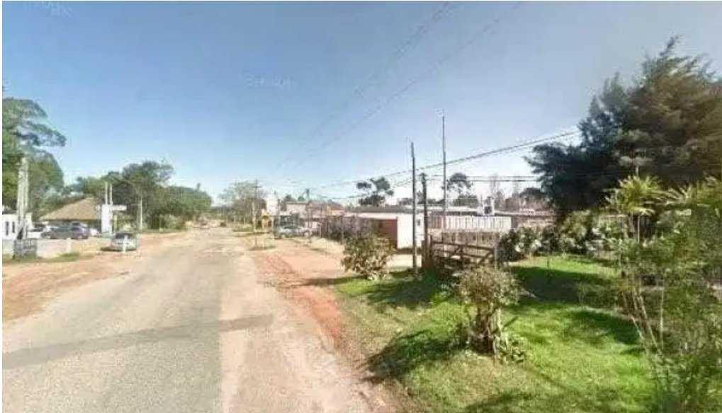
Ikigai cocina vegetariana street view y 360