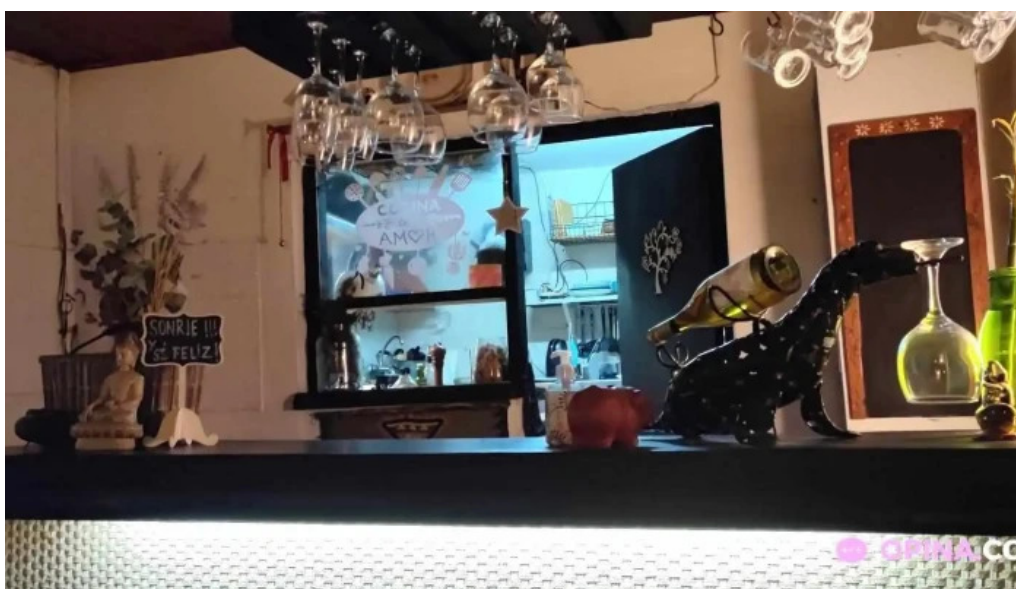
Ikigai cocina vegetariana ambiente