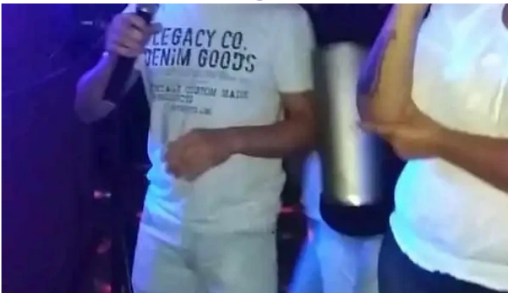
Los dos reales restaurant familiar videos