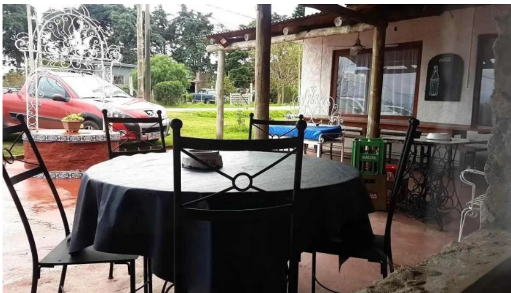
Los dos reales restaurant familiar ambiente