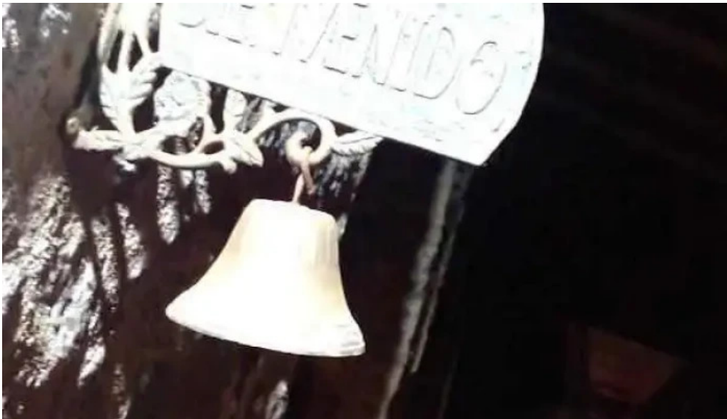
Los dos reales restaurant familiar mas recientes