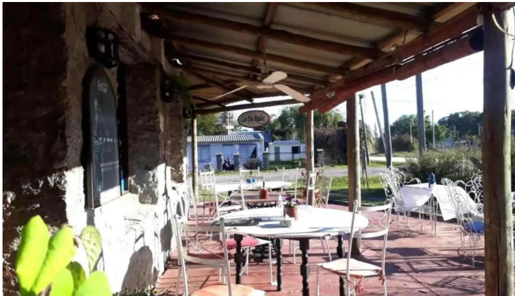
Los dos reales restaurant familiar col del sacramento