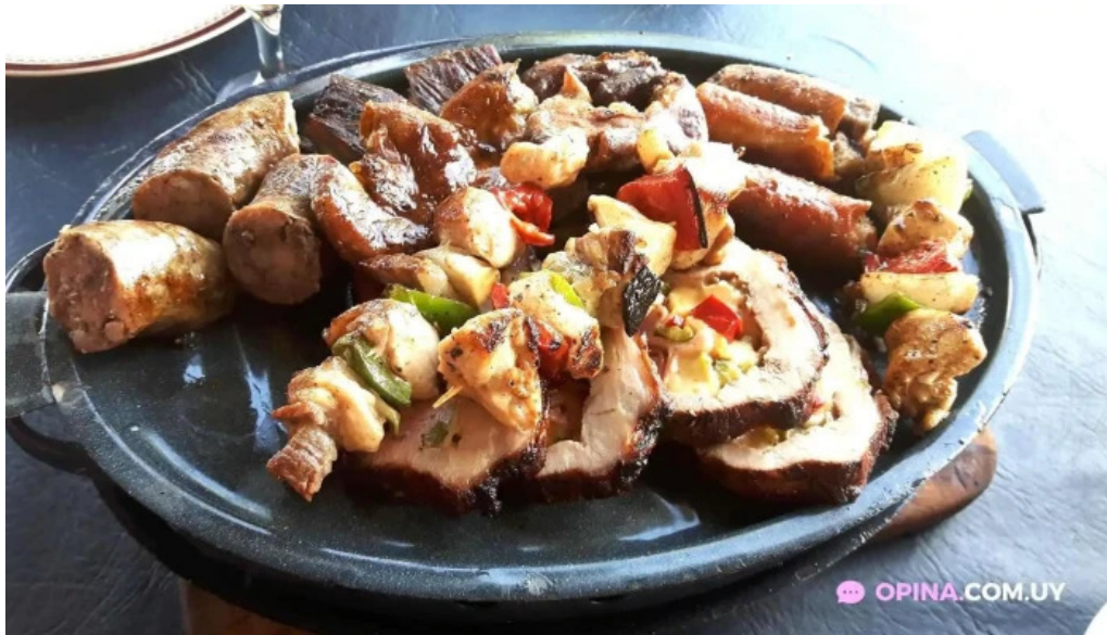
Los dos reales restaurant familiar comida y bebida