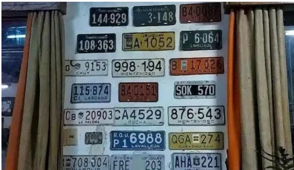
Lo de nancy menu