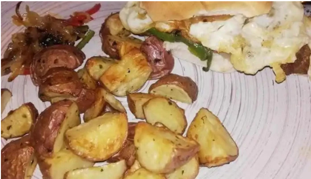
Lo de nancy comida y bebida