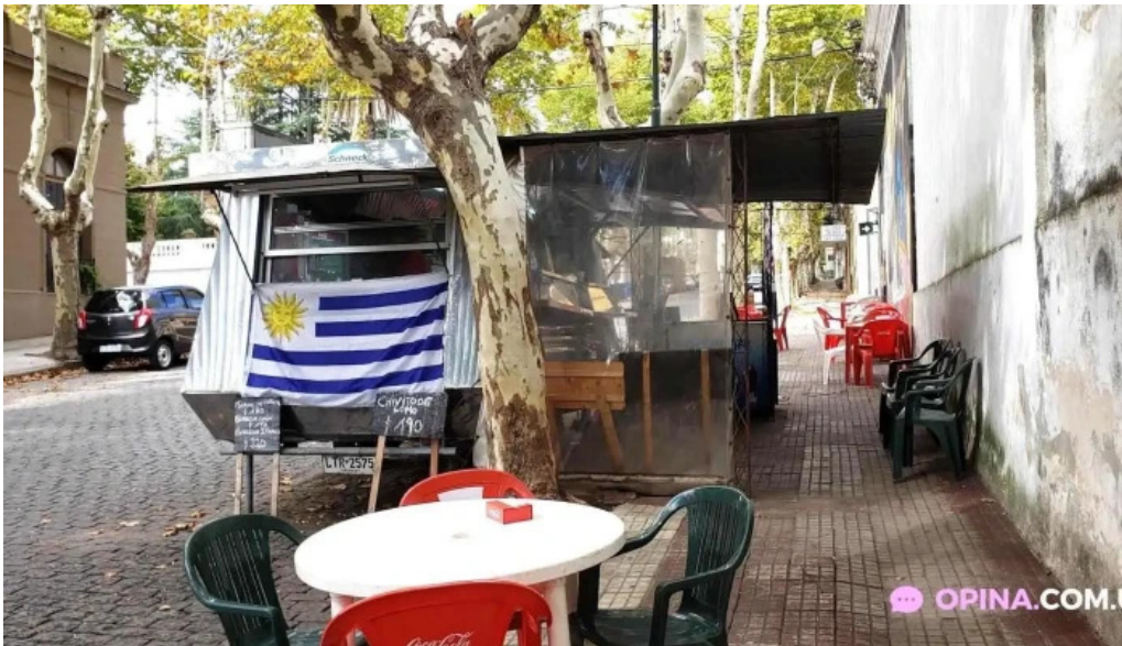
Lo de mario col del sacramento