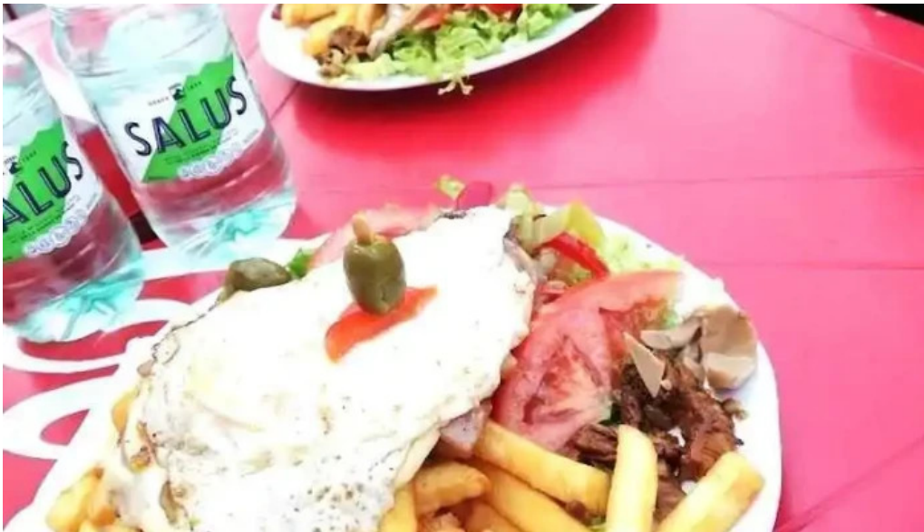
Lo de mario comida y bebida