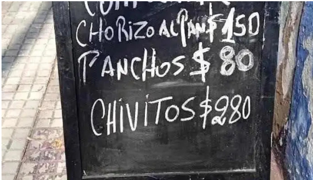
Lo de mario menu