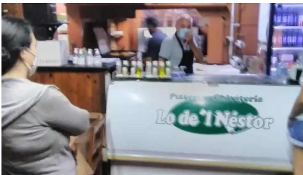
Lo de I nesor ambiente