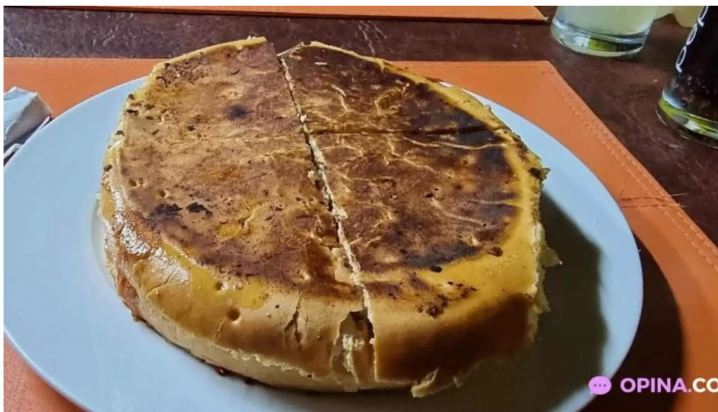
Lo de I nesor comida y bebida