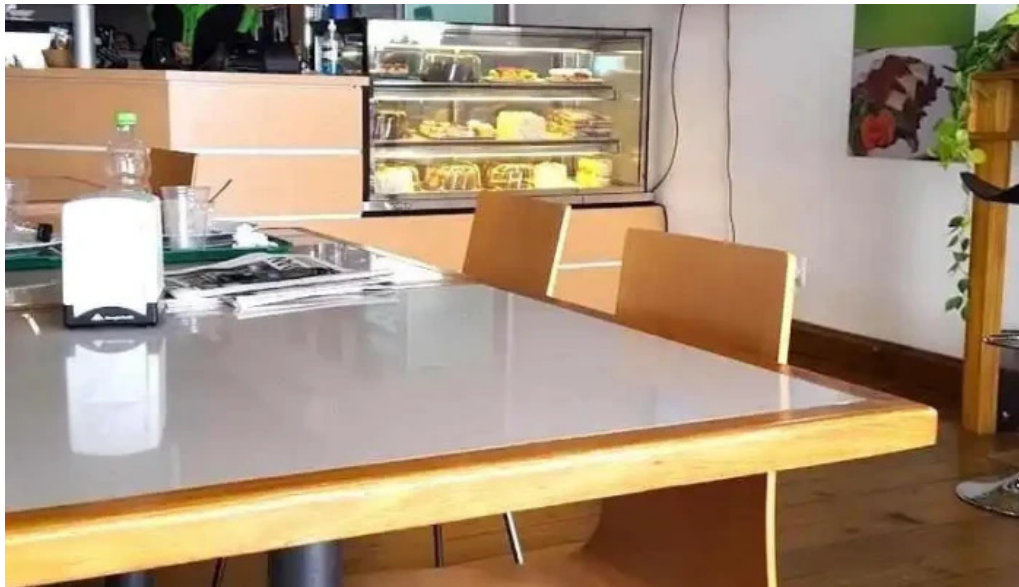
Lo de hontou ambiente