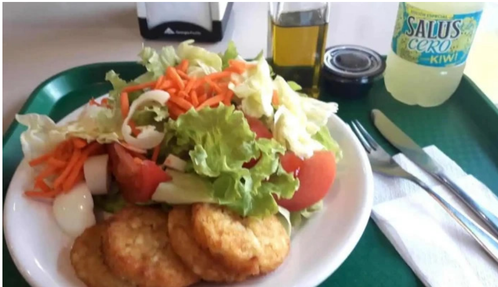
Lo de hontou comida y bebida