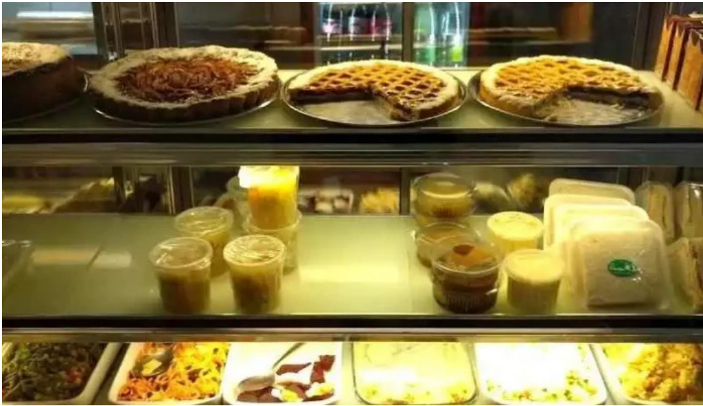
Lo de hontou minas