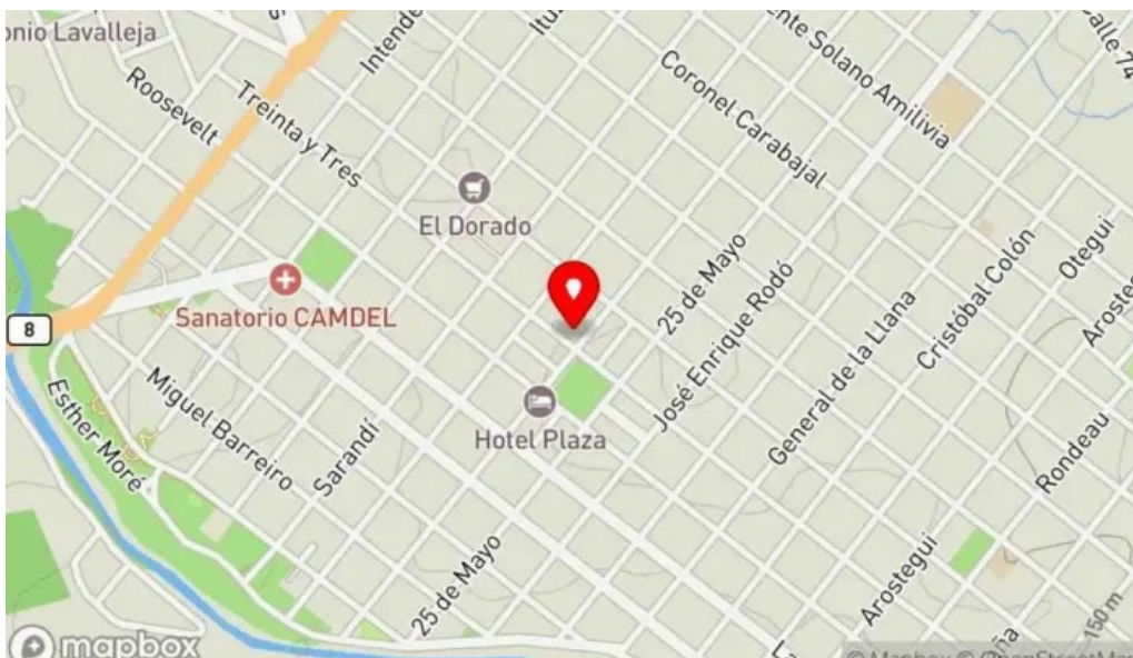
Lo de hontou mapa