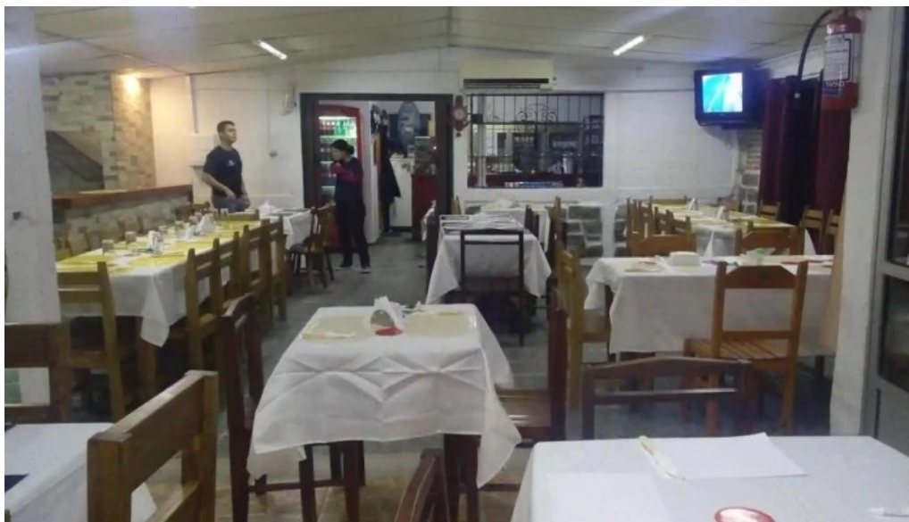
Lo de fierro todas