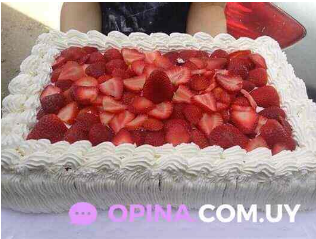
Lo de fierro comida y bebida