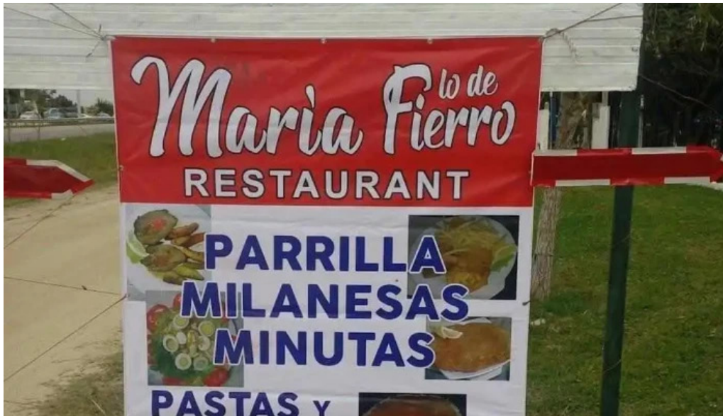
Lo de fierro menu