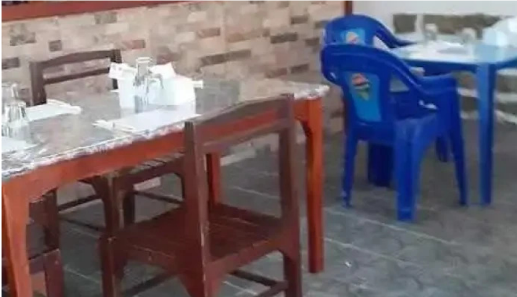
Lo de fierro ambiente