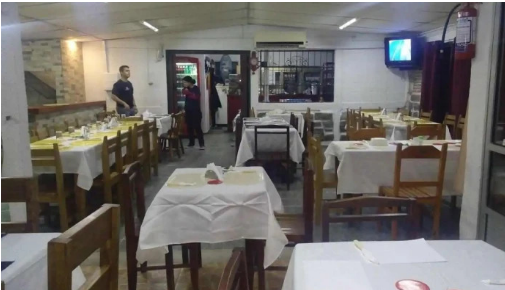
Lo de fierro florida