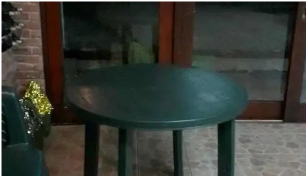
Lo de fierro videos