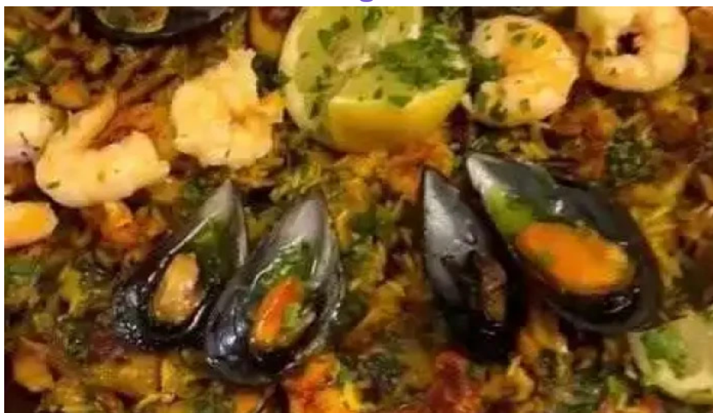
Leonardo etxea videos