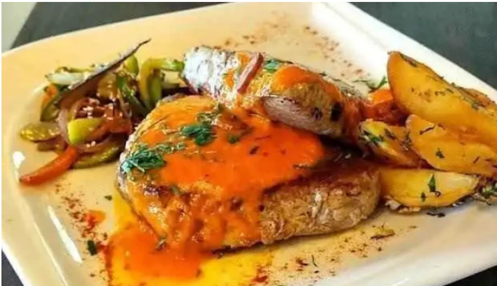
Leonardo etxea comida y bebida