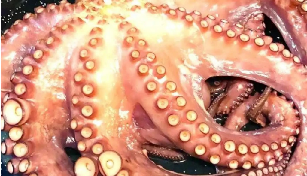
Leonardo etxea del propietario