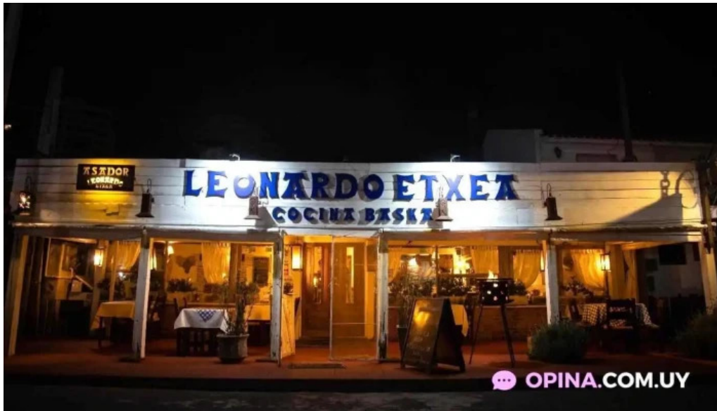
Leonardo etxea punta del este