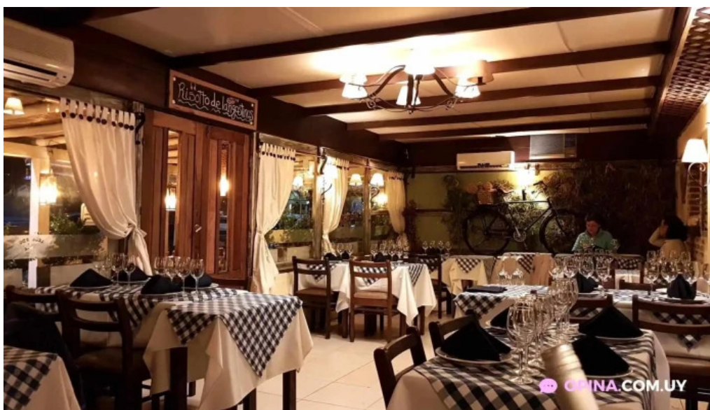
Leonardo etxea ambiente