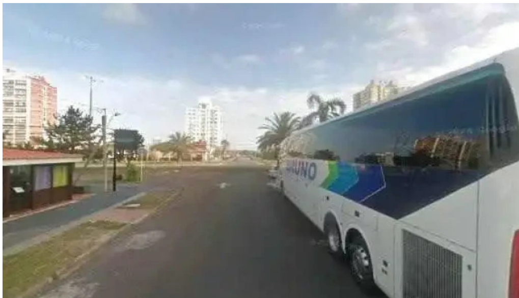
Leonardo etxea street view y 360