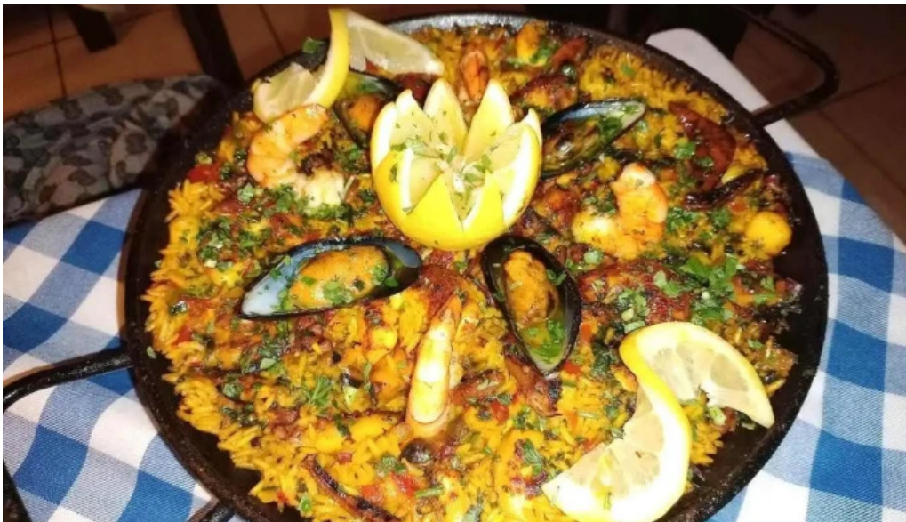
Leonardo etxea paella