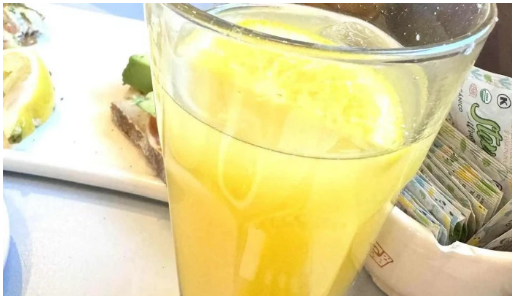
Le pain quotidien jugo