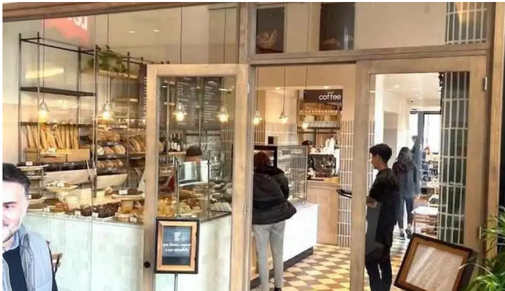
Le pain quotidien montevideo