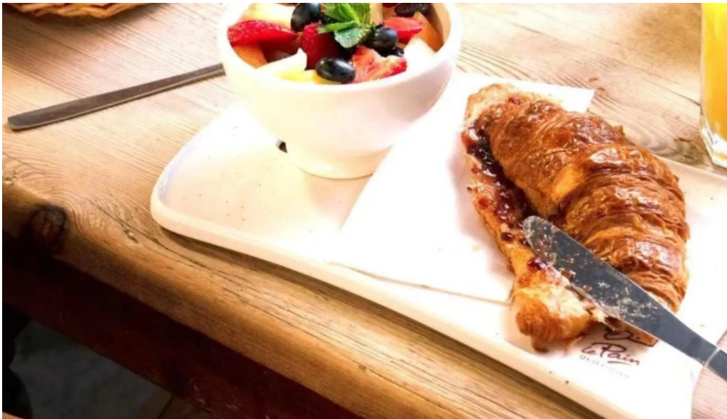
Le pain quotidien croissant