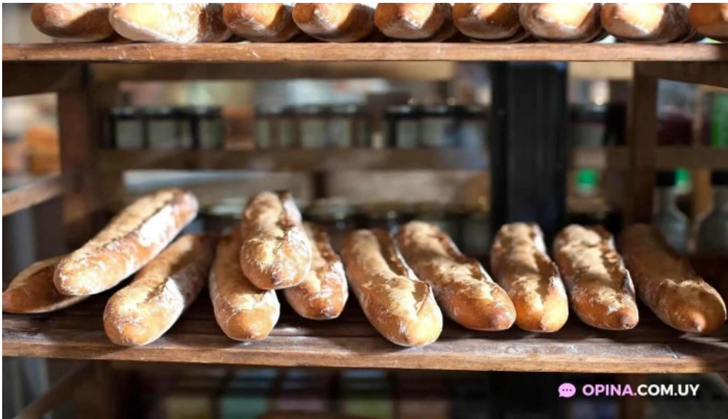
Le pain quotidien del propietario