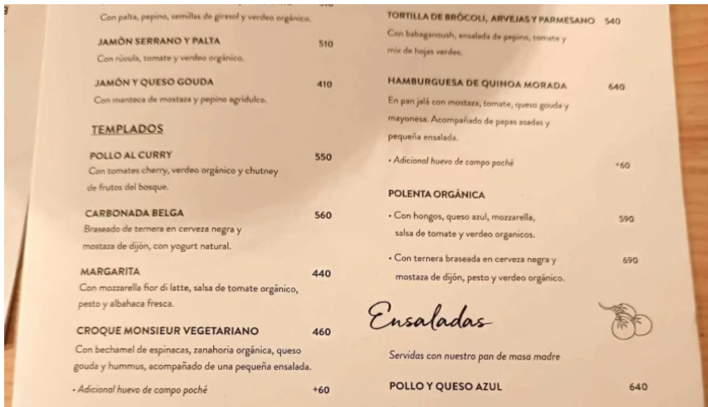
Le pain quotidien comentario 2