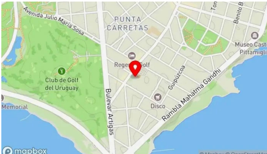
Le pain quotidien mapa