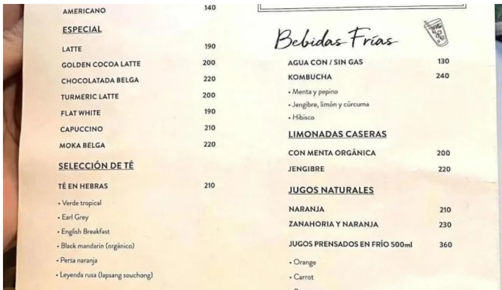
Le pain quotidien menu