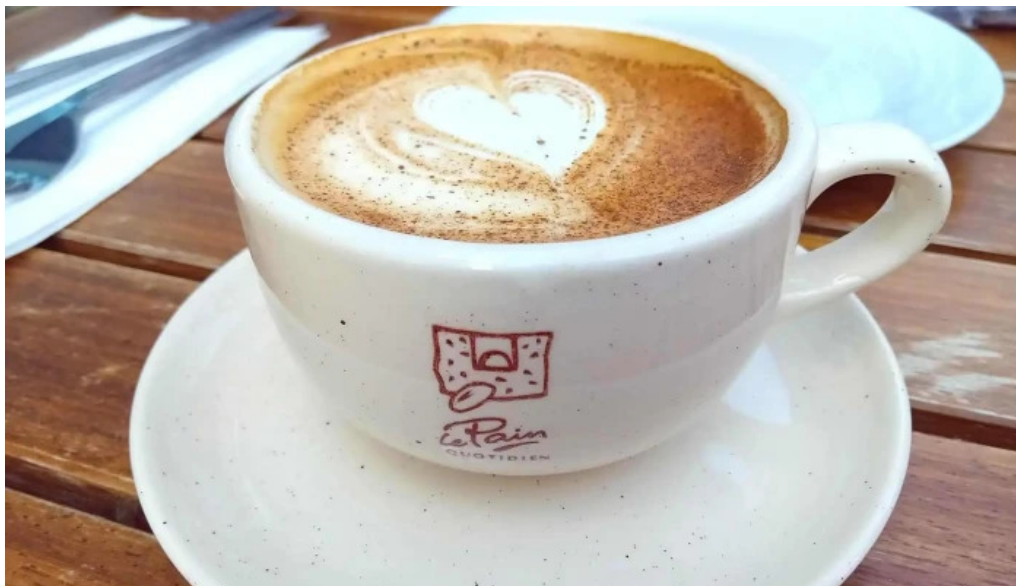
Le pain quotidien capuchino