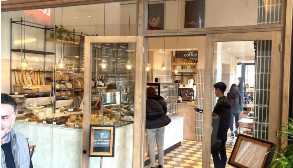
Le pain quotidien todo