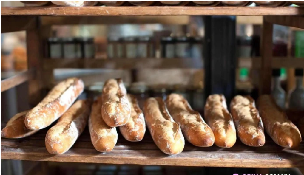
Le pain quotidien recientes