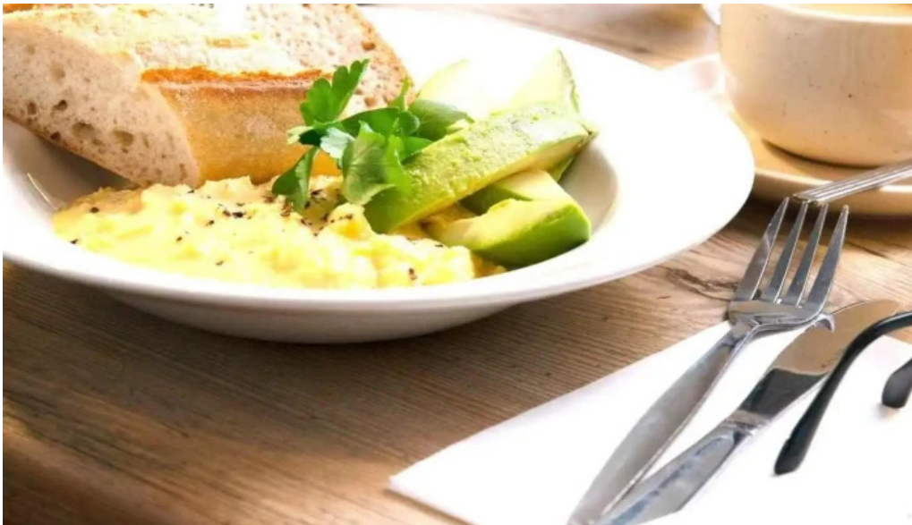
Le pain quotidien comidas y bebidas