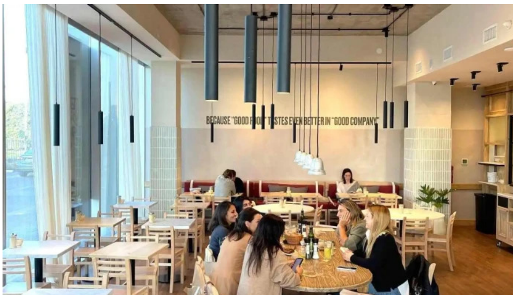
Le pain quotidien ambiente