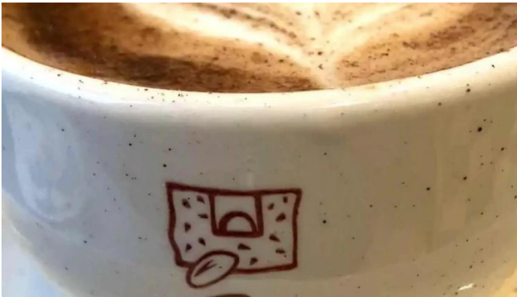
Le pain quotidien videos