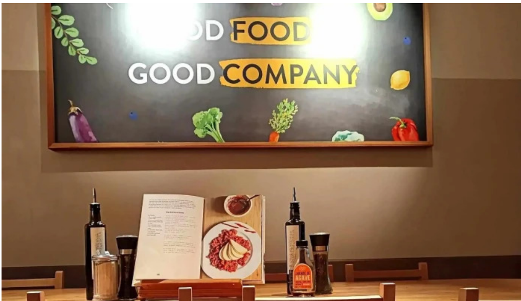
Le pain quotidien comentario 4