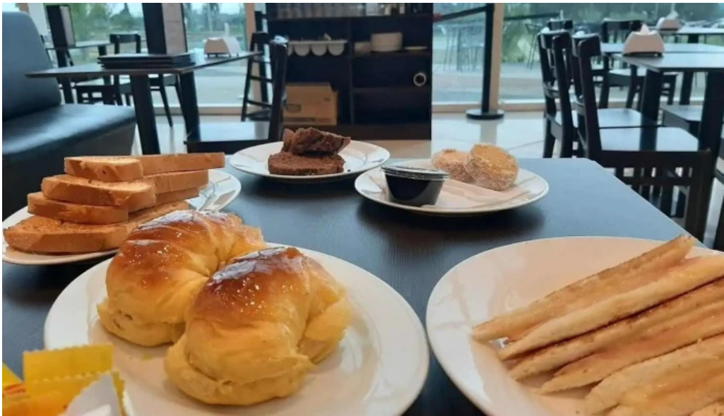
La pasiva comida y bebida