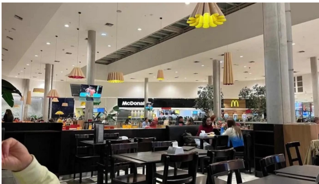
La pasiva ambiente