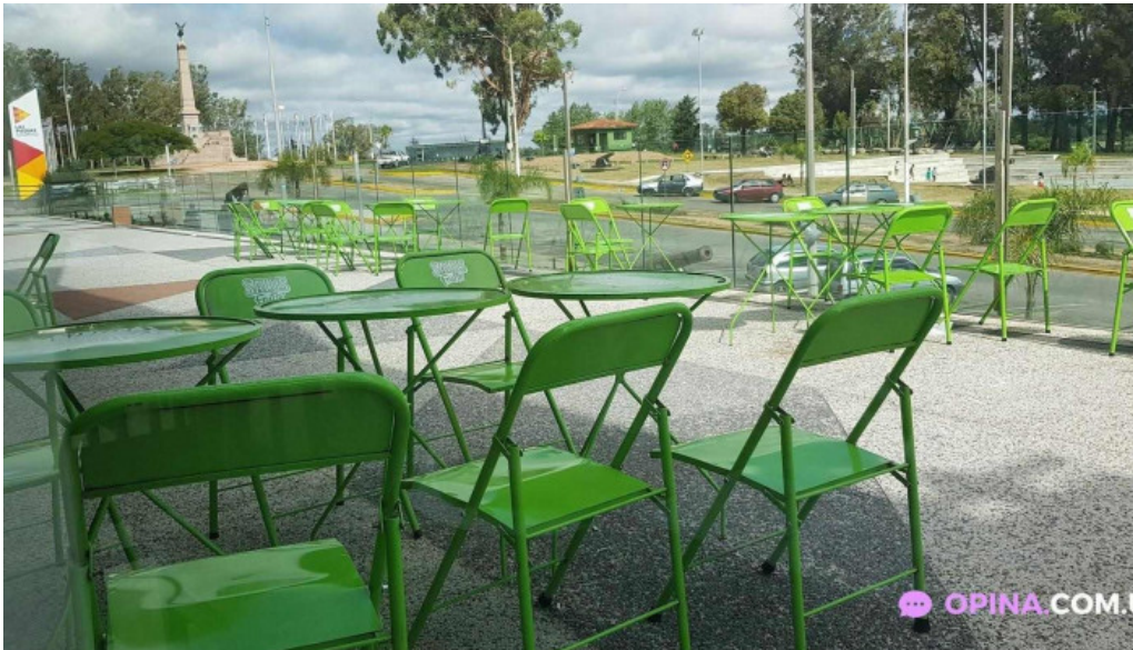
La pasiva todas