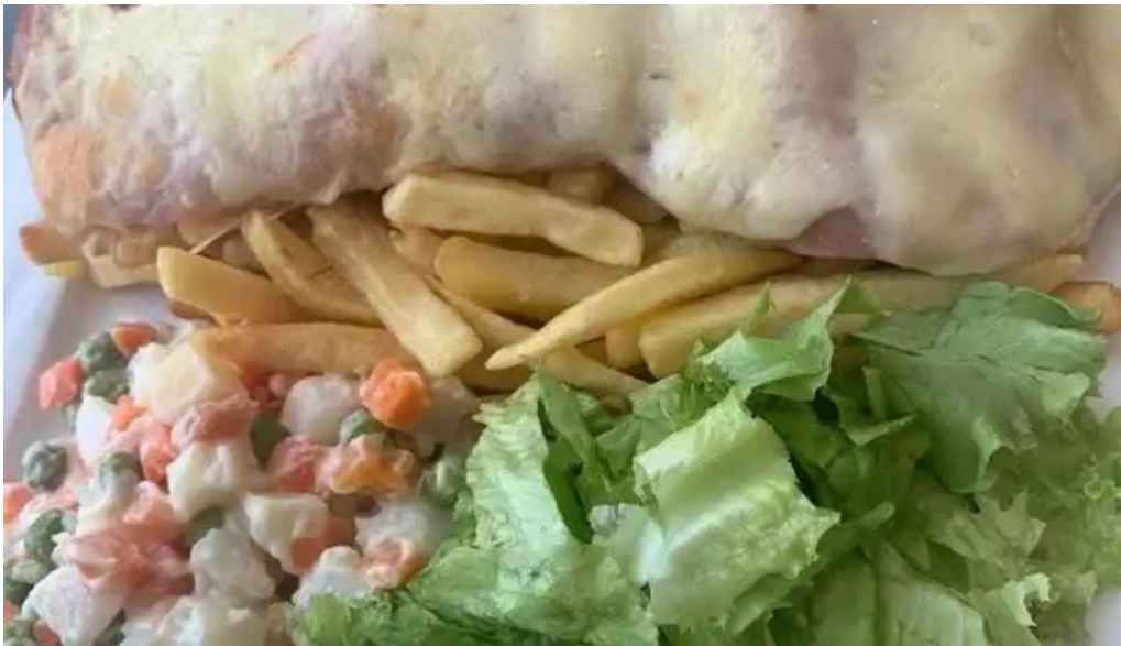
La pasiva papas fritas