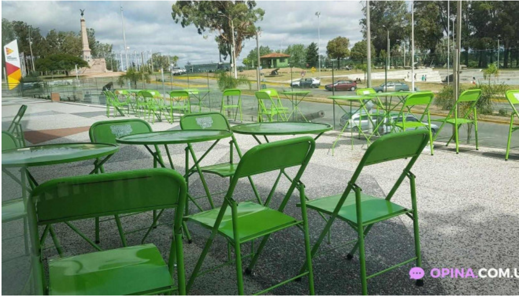
La pasiva las piedras