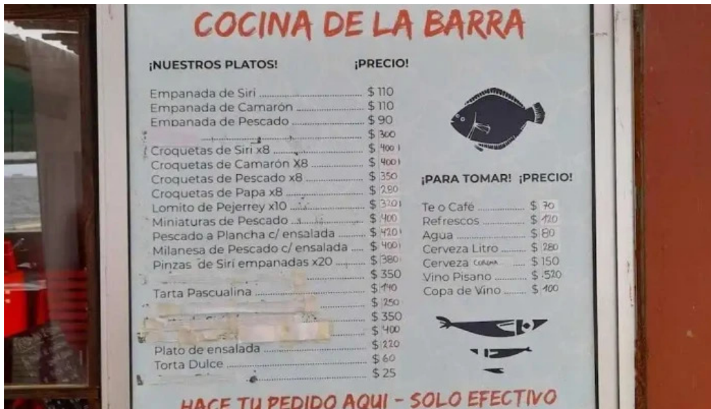
Cocina de la barra laguna de rocha menu